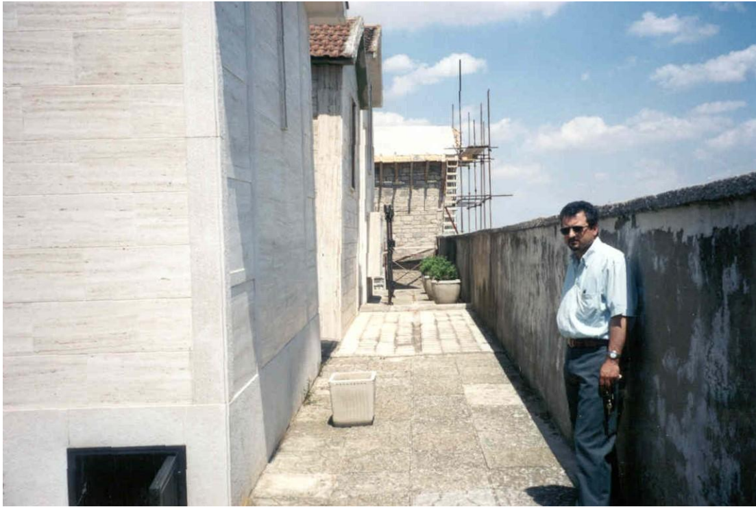
Figura 3. Cappelle fuori piombio all'interno del cimitero. Sullo sfondo si notano i lavori di restauro e rifacimento della copertura della cappella cimiteriale.