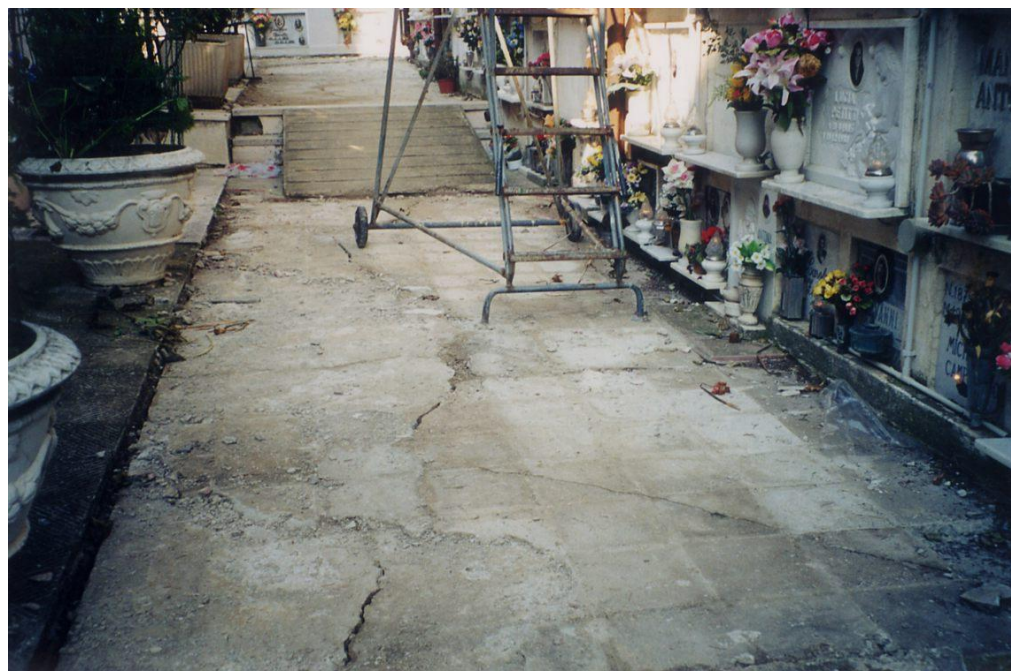
Figura 10. Settore NE del Cimitero dove nel corso dei lavori è stata rilevata un cedimento dei terreni ed un movimento traslativo verso valle che minaccia la stabilità di alcuni loculi incastonati al muro di cinta. Visibile la frattura di trazione aperta messa alla luce dall’asportazione della copertura dei viali dissestati. Per sanare questa situazione il comune intende richiedere una perizia di variante in corso d’opera.