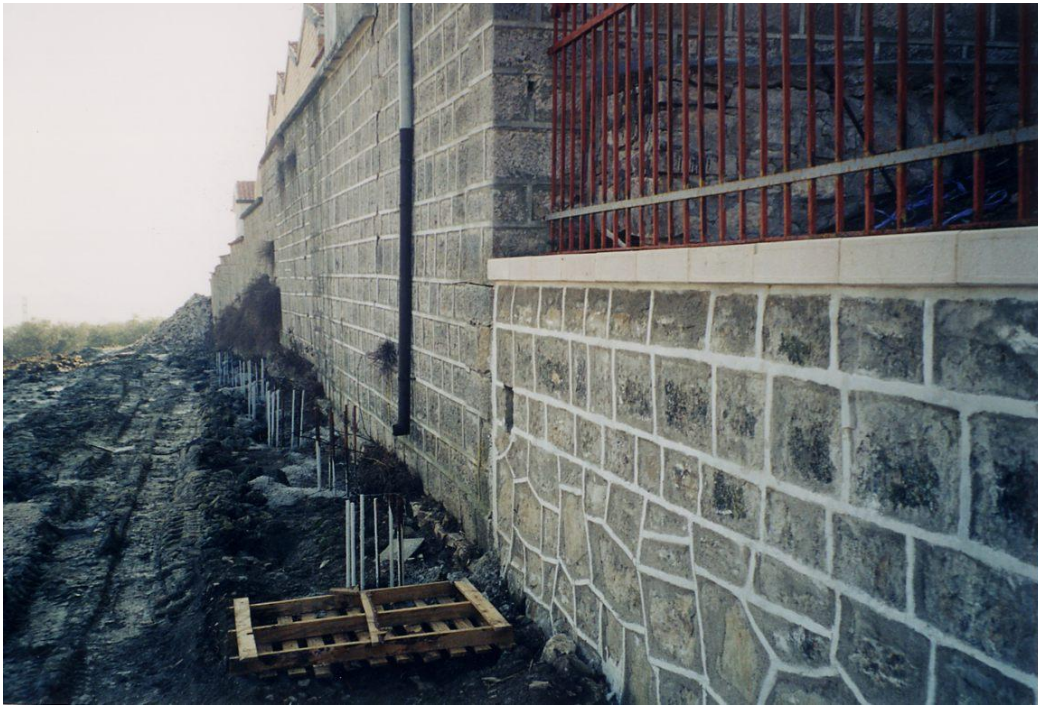
Figura 7 Palificata di sostegno realizzata esternamente al muro di cinta del Cimitero sul lato NNE