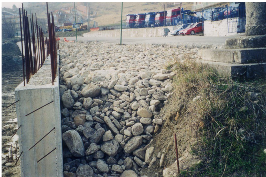
Figura 9 Particolare del sistema drenante realizzato a tergo del muro di sostegno in c.a. con fondazione su pali in un tratto della strada provinciale “Ponte Celone” nella parte alta della zona d’intervento