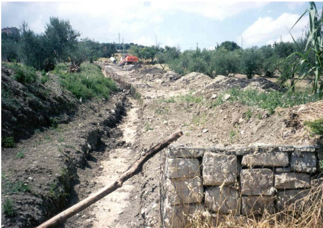
Figura 6. Scavo a sezione per la messa in opera della tubazione drenante nel pendio lato ovest del Campo di calcio per il drenaggio delle acque sorgentizie