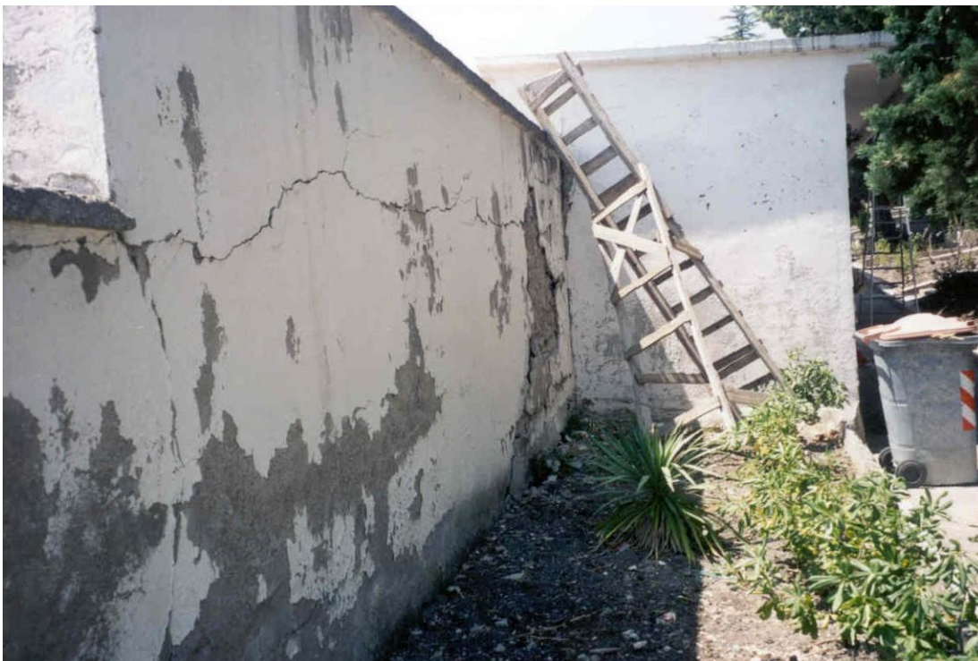
Figura 4. Vista del muro di cinta e degli annessi loculi lesionati sul lato ovest del cimitero.