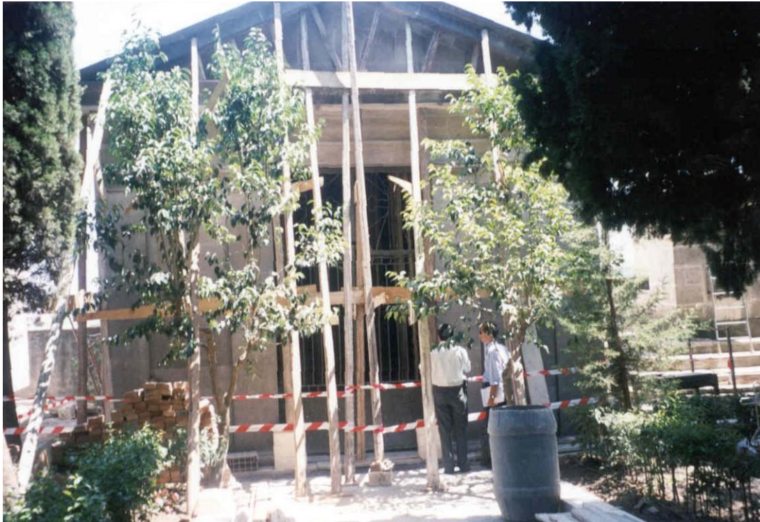
Figura 5. Lavori di consolidamento e ricostruzione della Cappella cimiteriale gravemente danneggiata e resa inagibile dai dissesti idrogeologici.