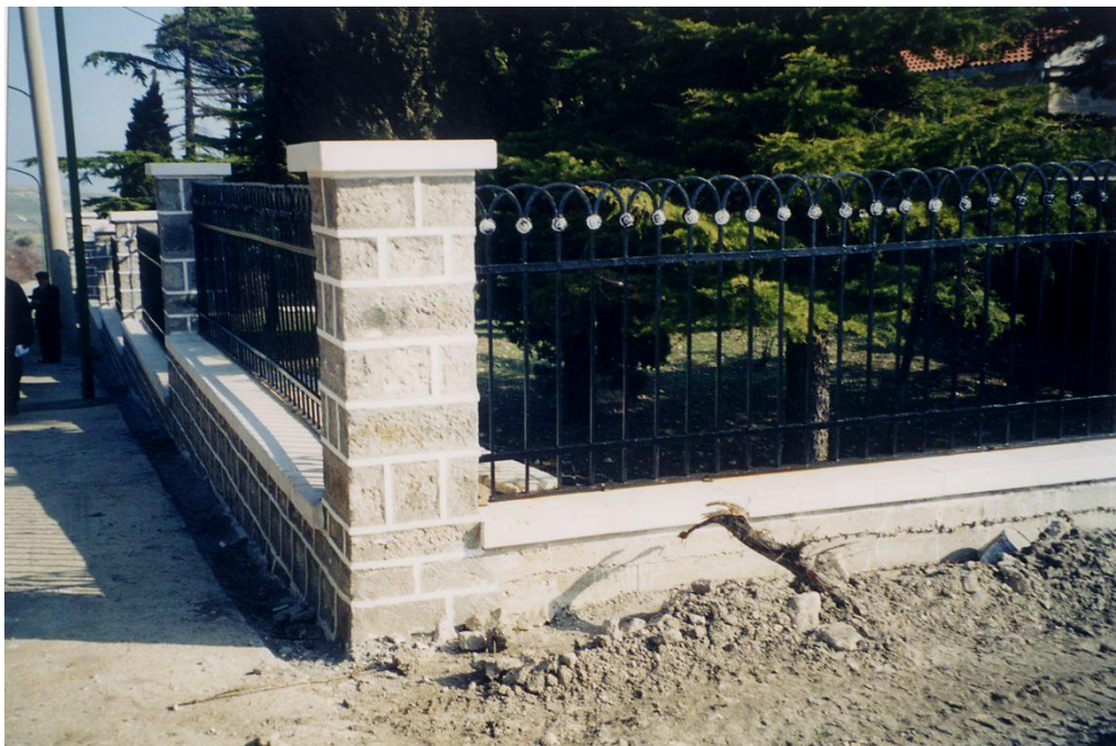
Figura 8 Recinzione esterna ricostruita lungo la Via del Sole sul lato ovest del Cimitero