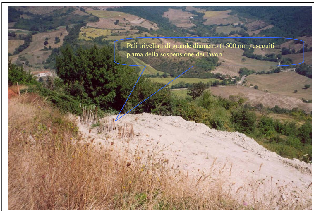
Figura 4. Paratia di pali di grande diametro, tirantata, ubicata a valle della strada. I lavori sono stati sospesi nel mese di agosto 2002 a causa delle difficoltà incontrata nelle operazioni di trivellazione e getto dei pali per la presenza di grossi trovanti di roccia e di abbondante acqua di falda. La ripresa è prevista non appena approvata la perizia di variante.