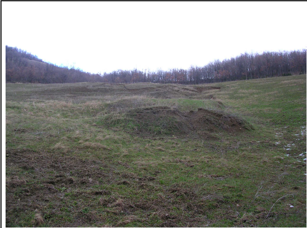
VEDUTA GENERALE CORPO DI FRANA