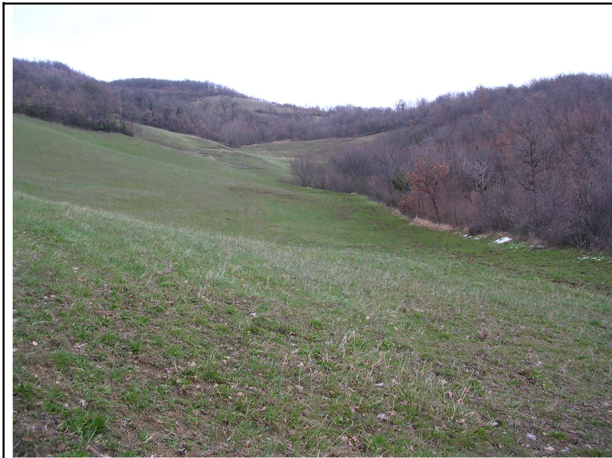
VEDUTA GENERALE CORPO DI FRANA