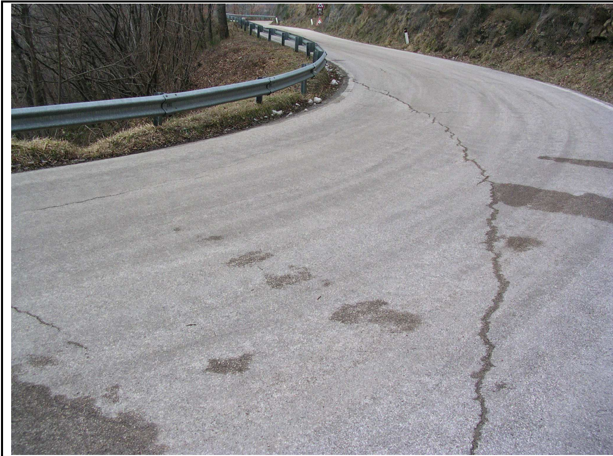
LESIONI STRADA PROVINCIALE