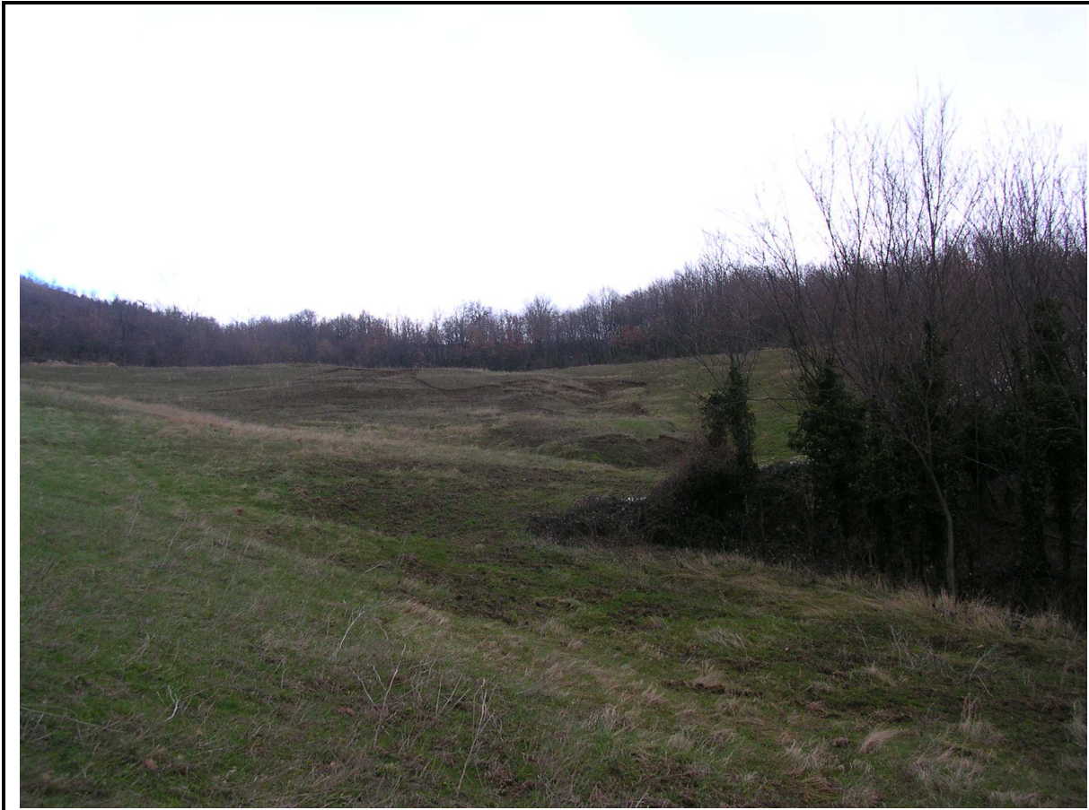
VEDUTA GENERALE CORPO DI FRANA