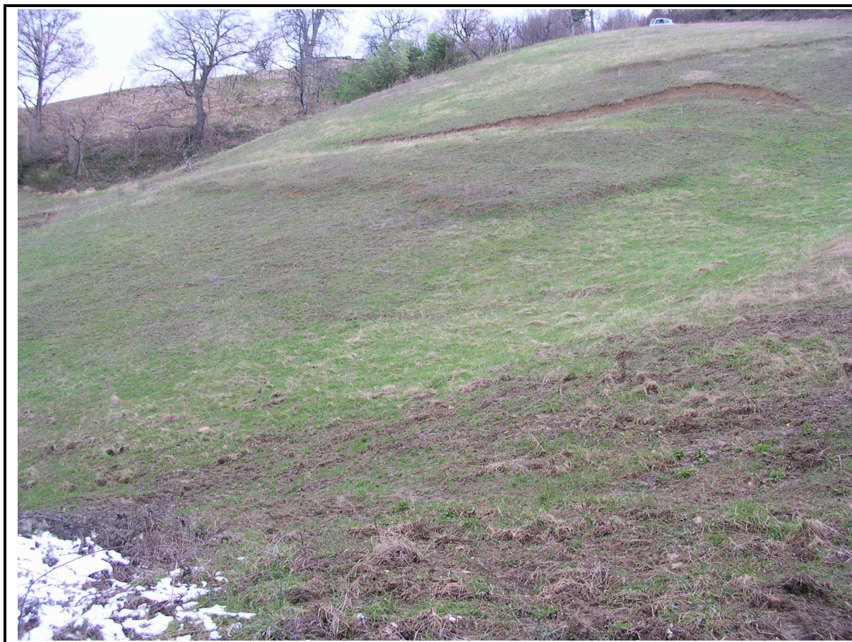
VEDUTA GENERALE CORPO DI FRANA