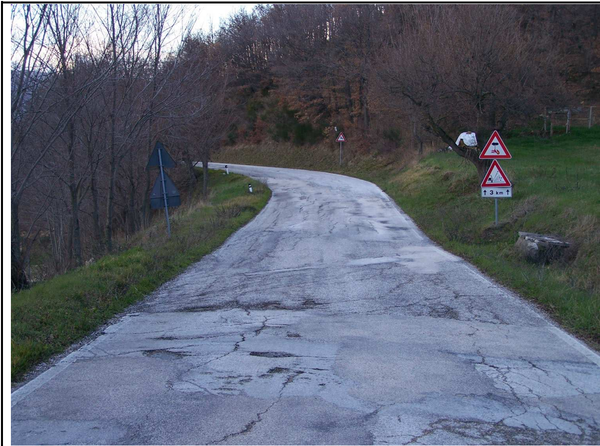
LESIONI STRADA PROVINCIALE