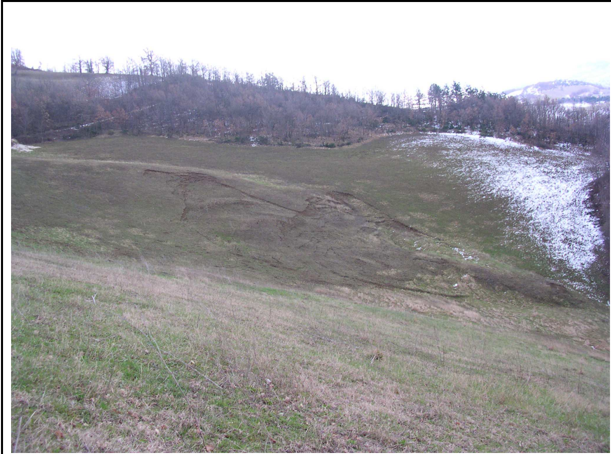
VEDUTA GENERALE DEL CORPO DI FRANA