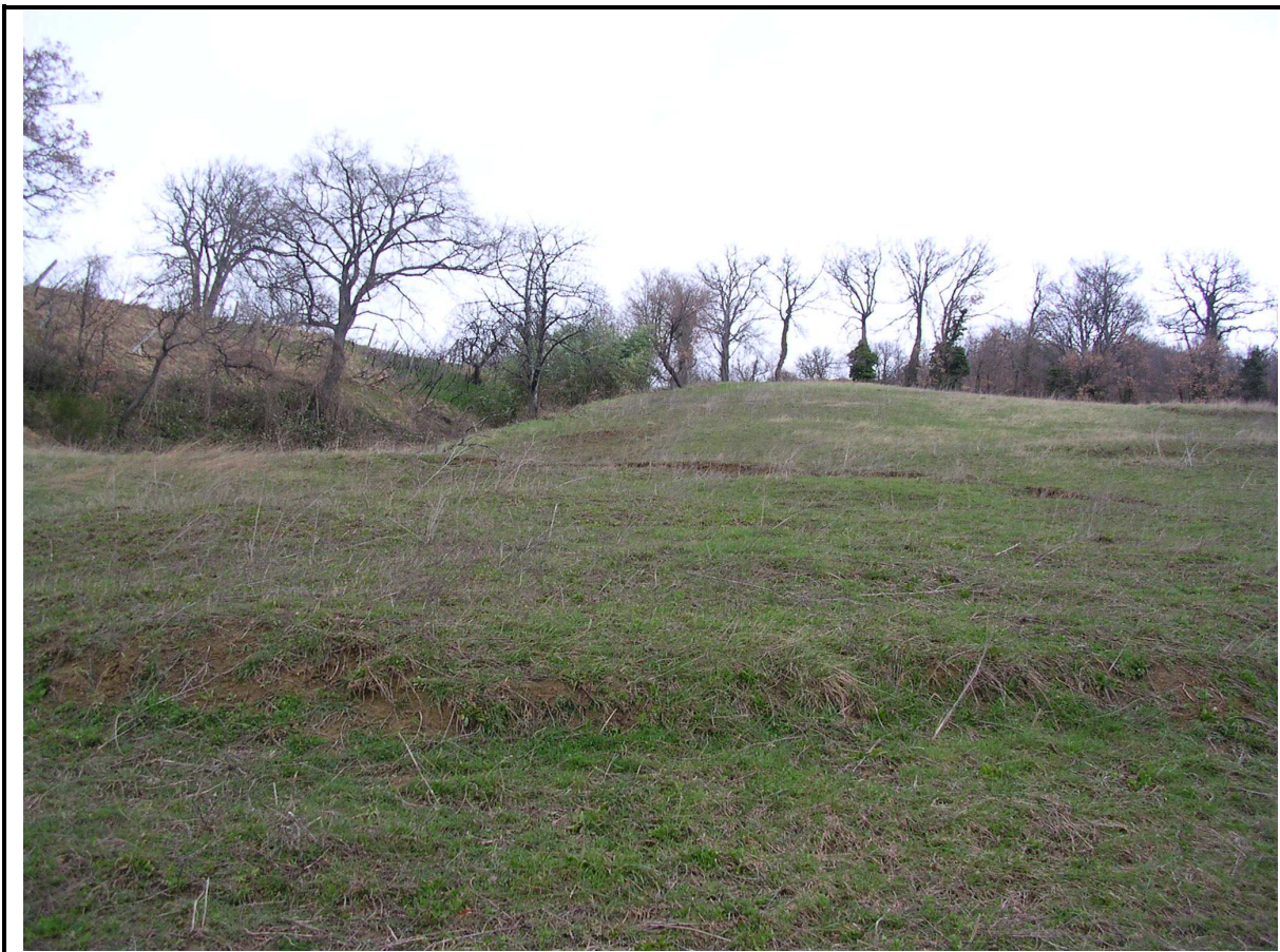
VEDUTA GENERALE CORPO DI FRANA