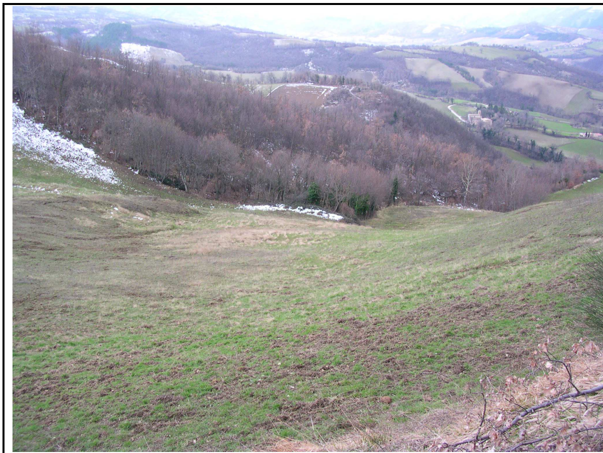
VEDUTA GENERALE CORPO DI FRANA