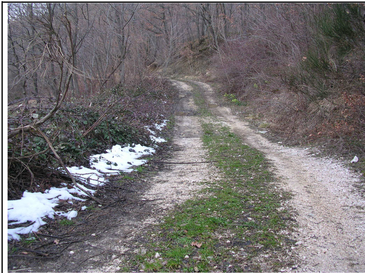
ABBASSAMENTO STRADA COMUNALE