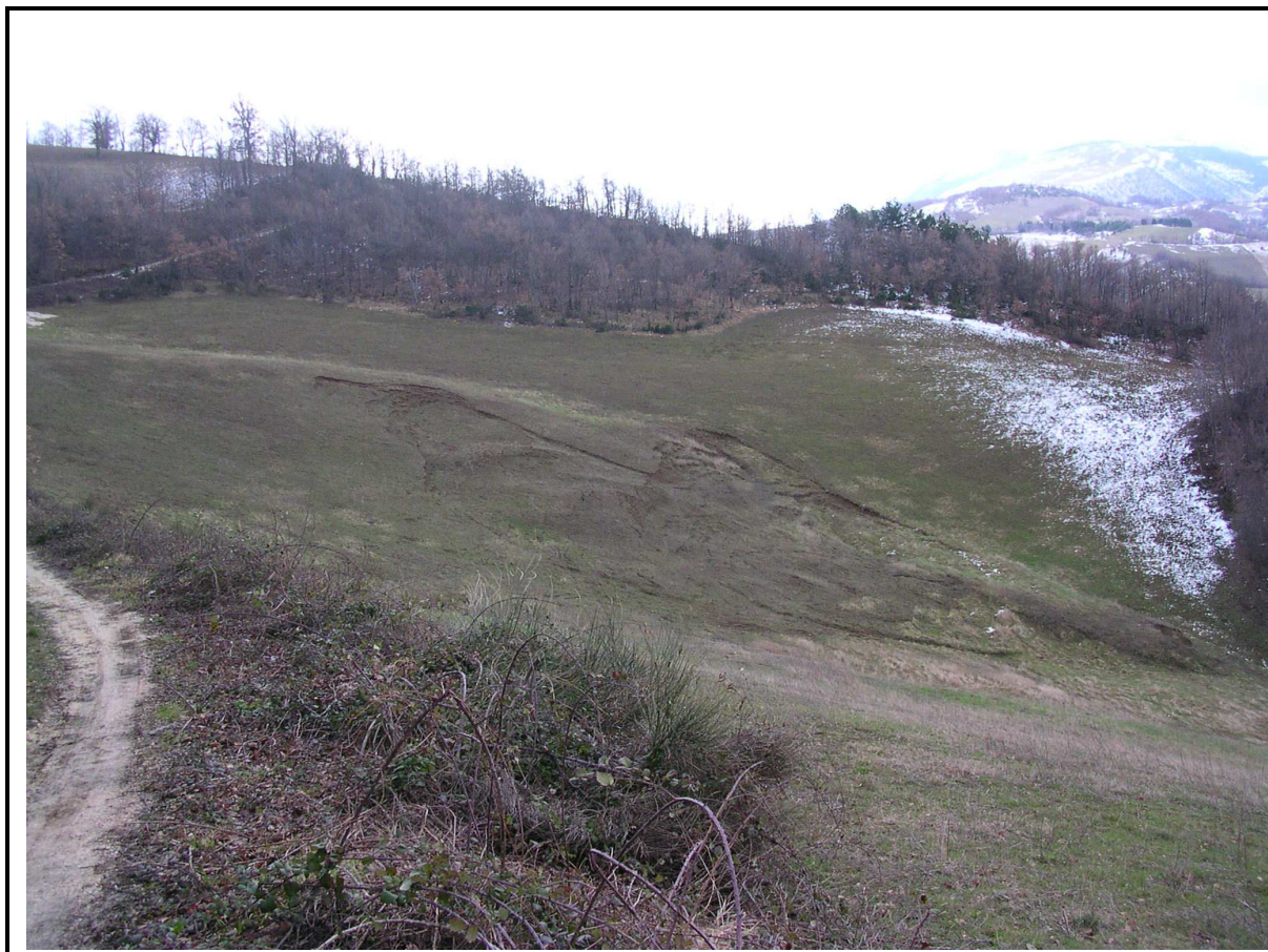
VEDUTA GENERALE CORPO DI FRANA