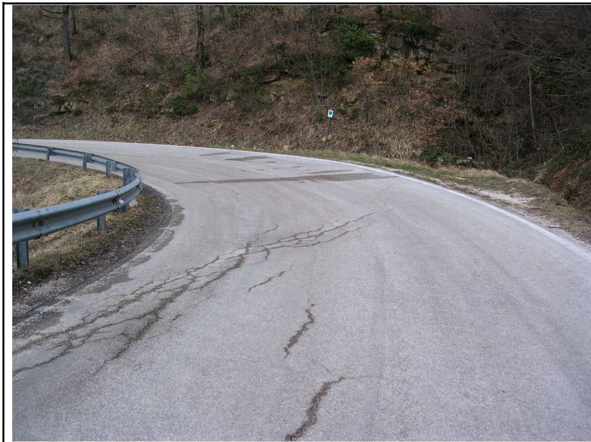
LESIONI STRADA PROVINCIALE PIEVEBOVIGLINA - FIASTRA