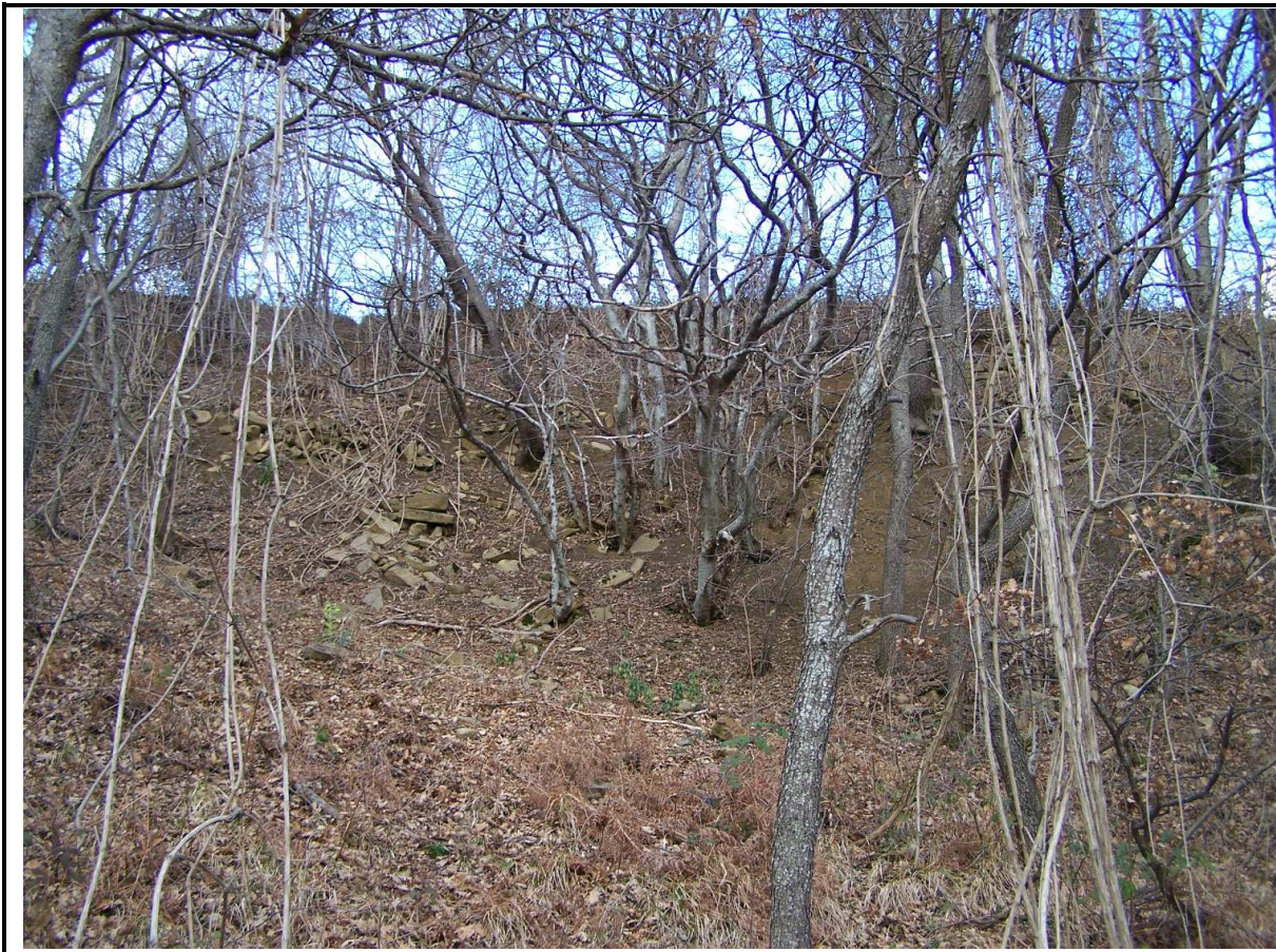
PARTICOLARE DELLA DELLA ZONA DI DISTACCO PRINCIPALE