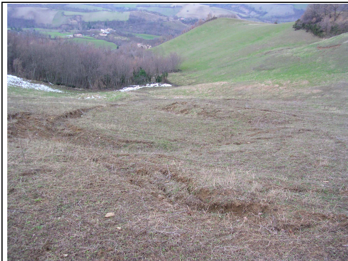
VEDUTA GENERALE CORPO DI FRANA