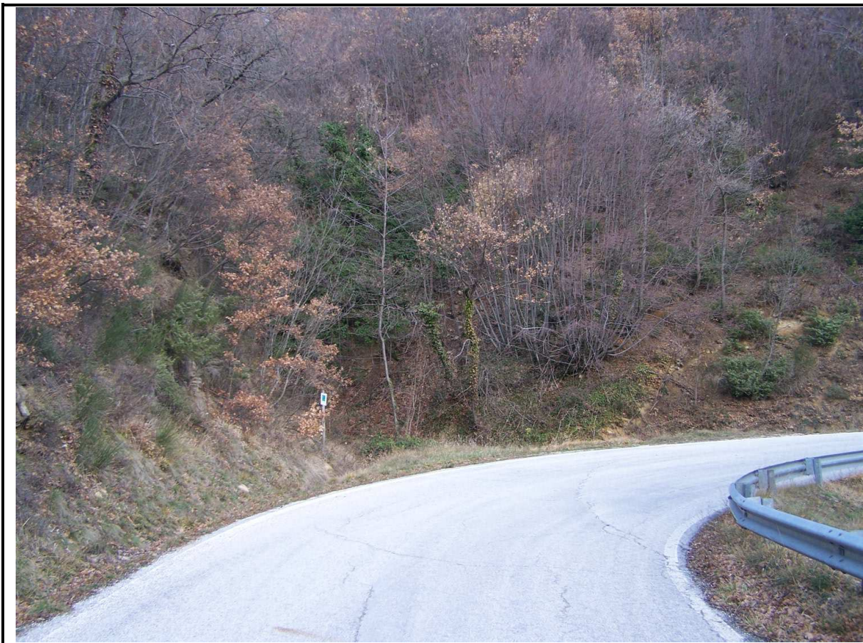
LESIONI STRADA PROVINCIALE