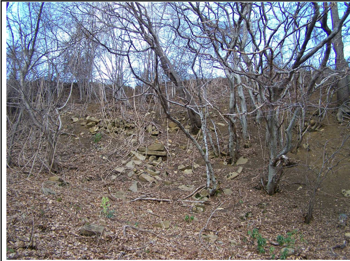
PARTICOLARE DELLA DELLA CORONA DI DISTACCO PRINCIPALE