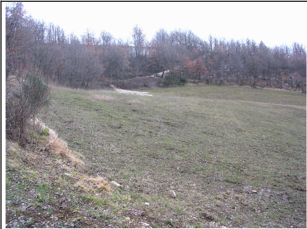
VEDUTA GENERALE CORPO DI FRANA