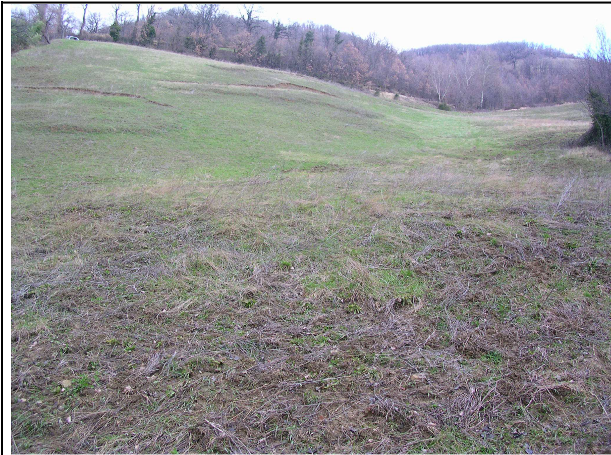
VEDUTA GENERALE CORPO DI FRANA