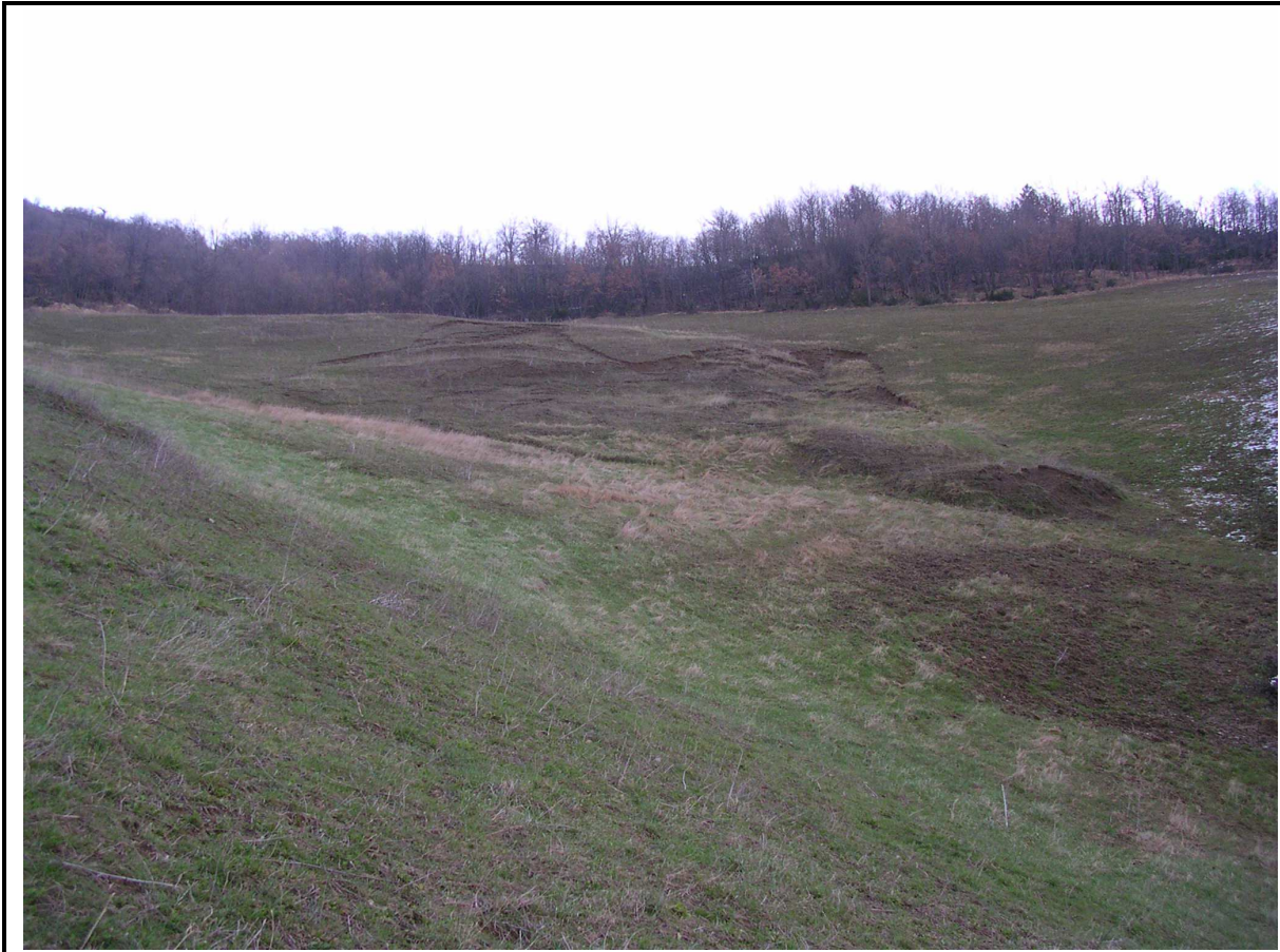
VEDUTA GENERALE CORPO DI FRANA SUPERFICIALE DA MEZZO