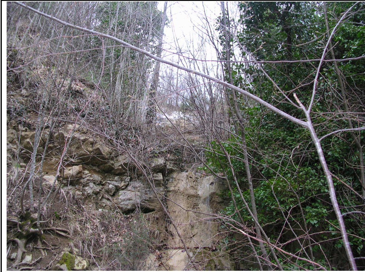
VISTA PARTICOLARE FOSSO DI RACCOLTA