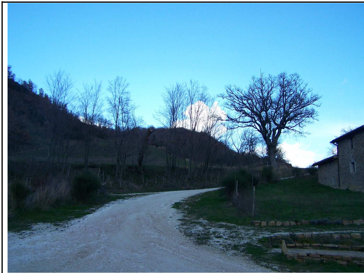
VEDUTA DA VALLE DEL VERSANTE IN DISSESTO