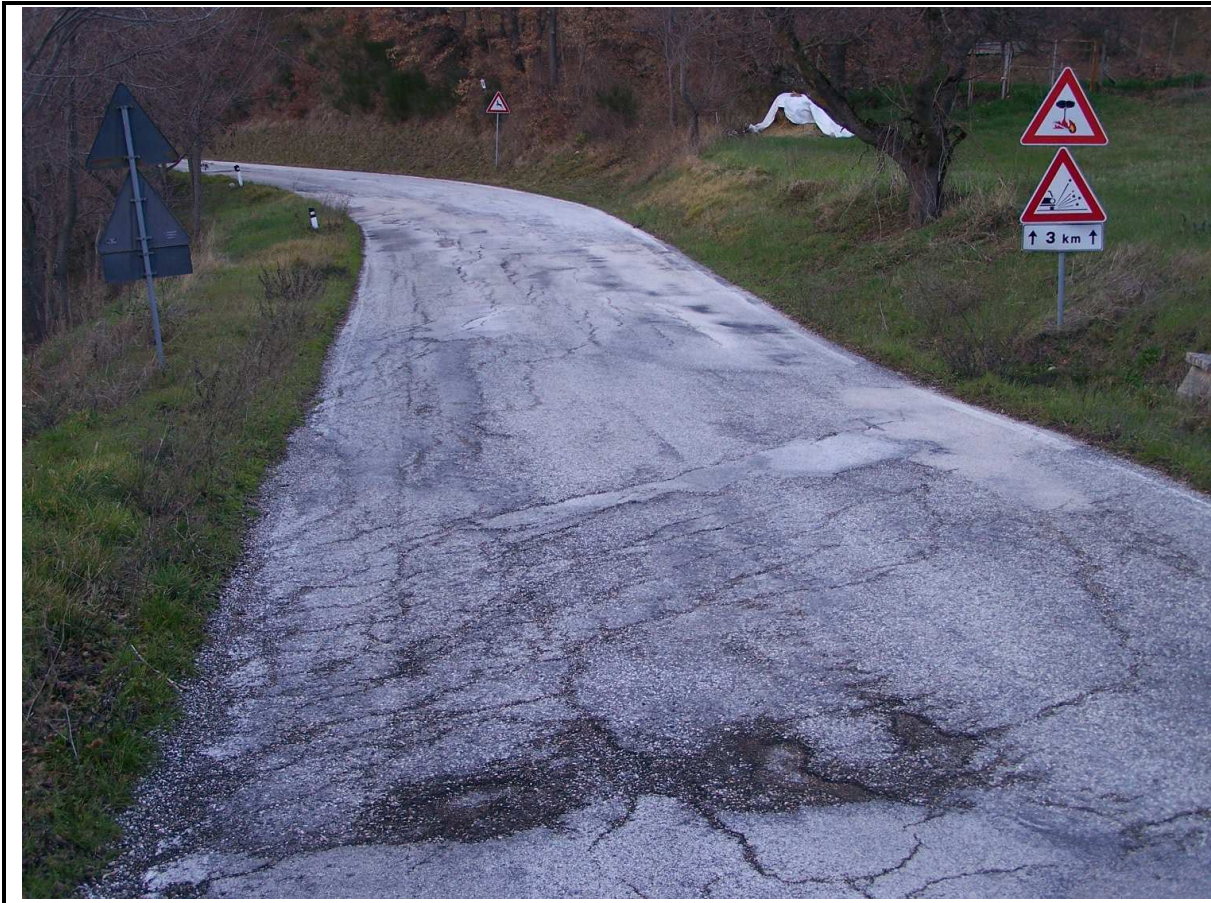
LESIONI STRADA PROVINCIALE