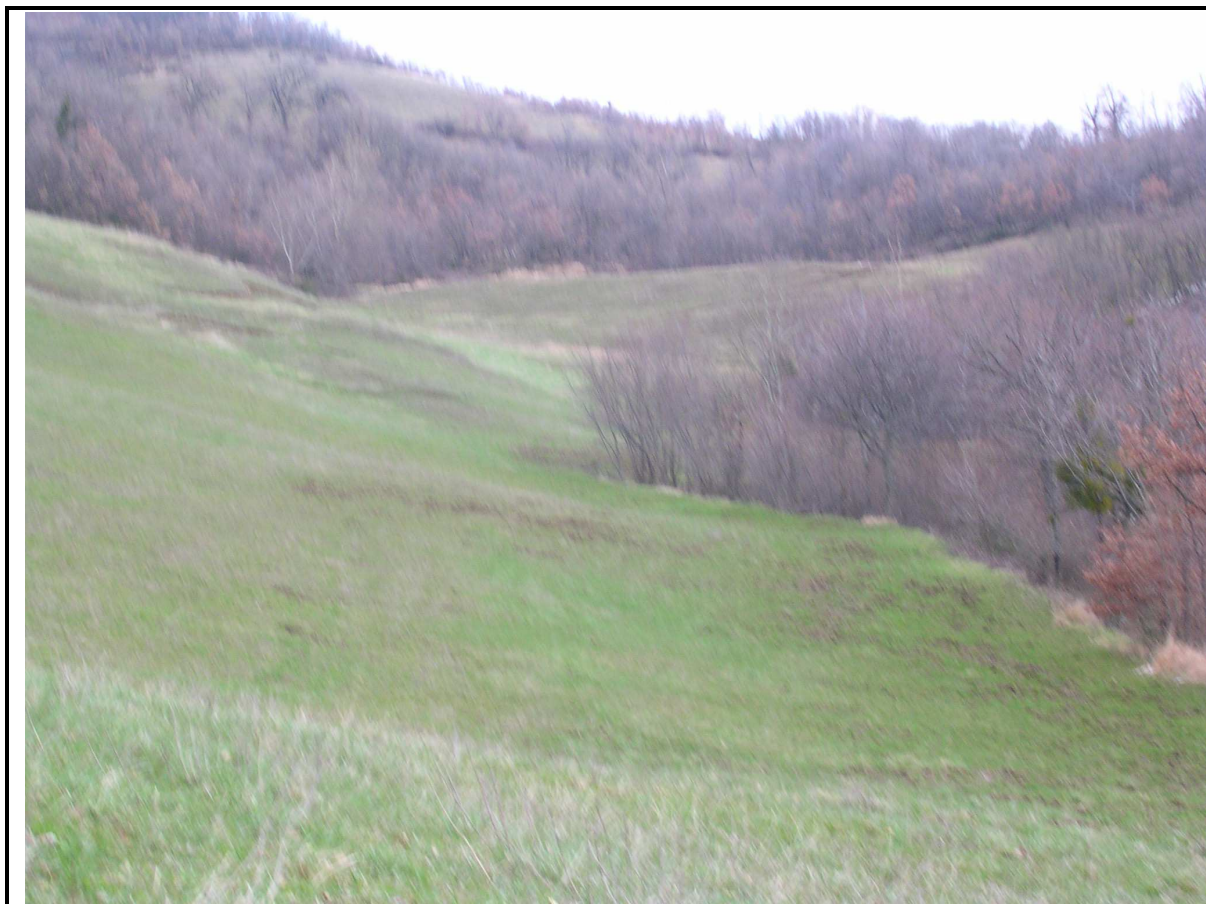
VEDUTA GENERALE CORPO DI FRANA