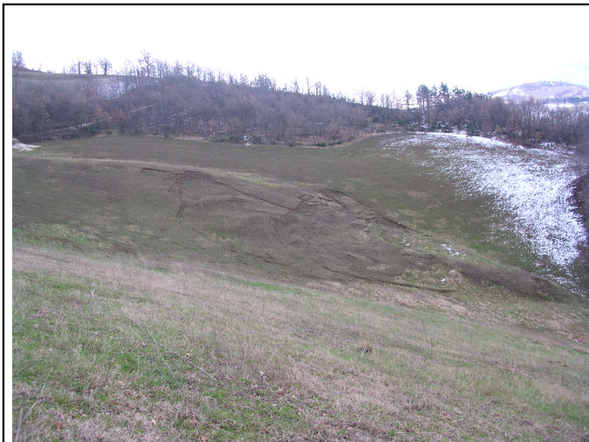
VEDUTA GENERALE DEL CORPO DI FRANA