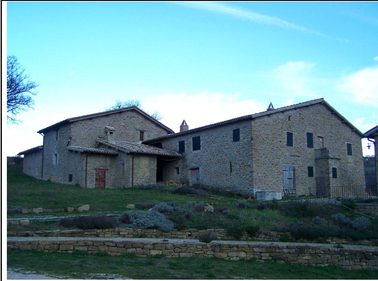
VEDUTA DELLA STRUTTURA RICETTIVA AGRITURISTICA "TERRE DELLA SIBILLA"