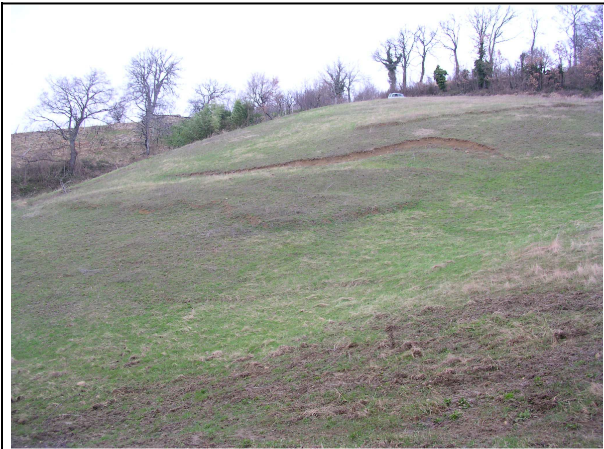
VEDUTA GENERALE CORPO DI FRANA