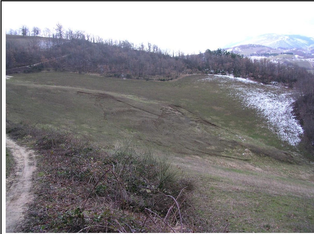
VEDUTA GENERALE CORPO DI FRANA