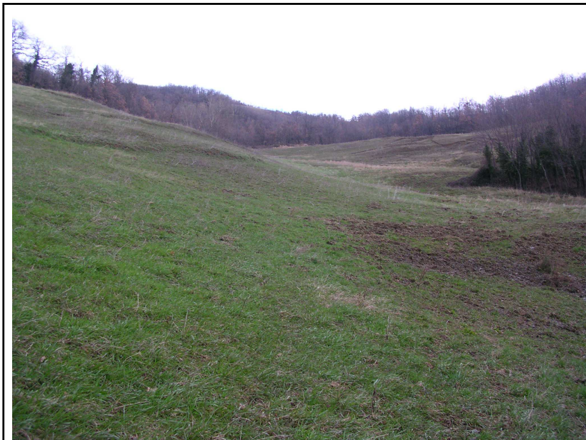
VEDUTA GENERALE CORPO DI FRANA