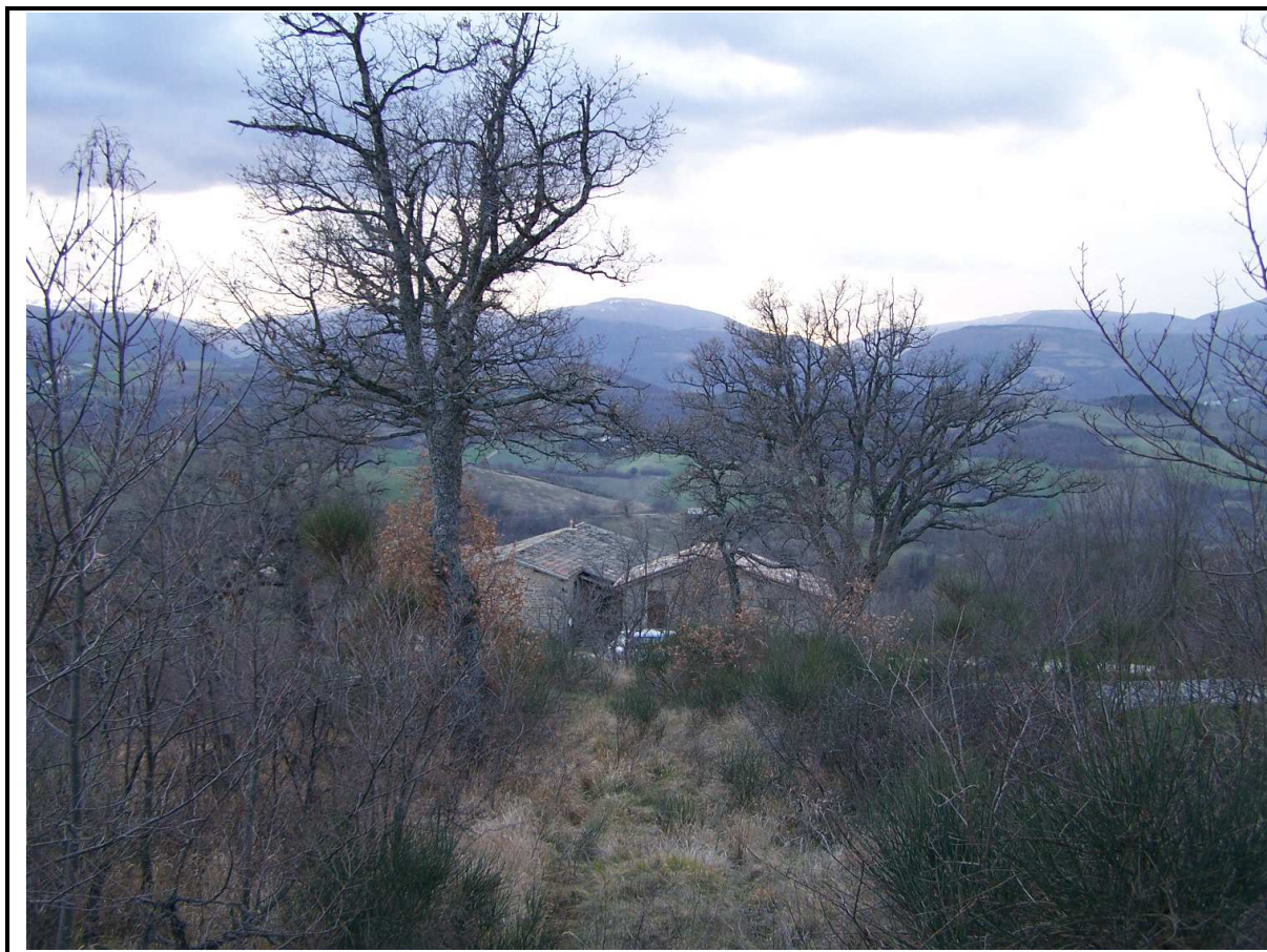
VEDUTA DA MONTE DELL'AGGLOMERATO URBANO