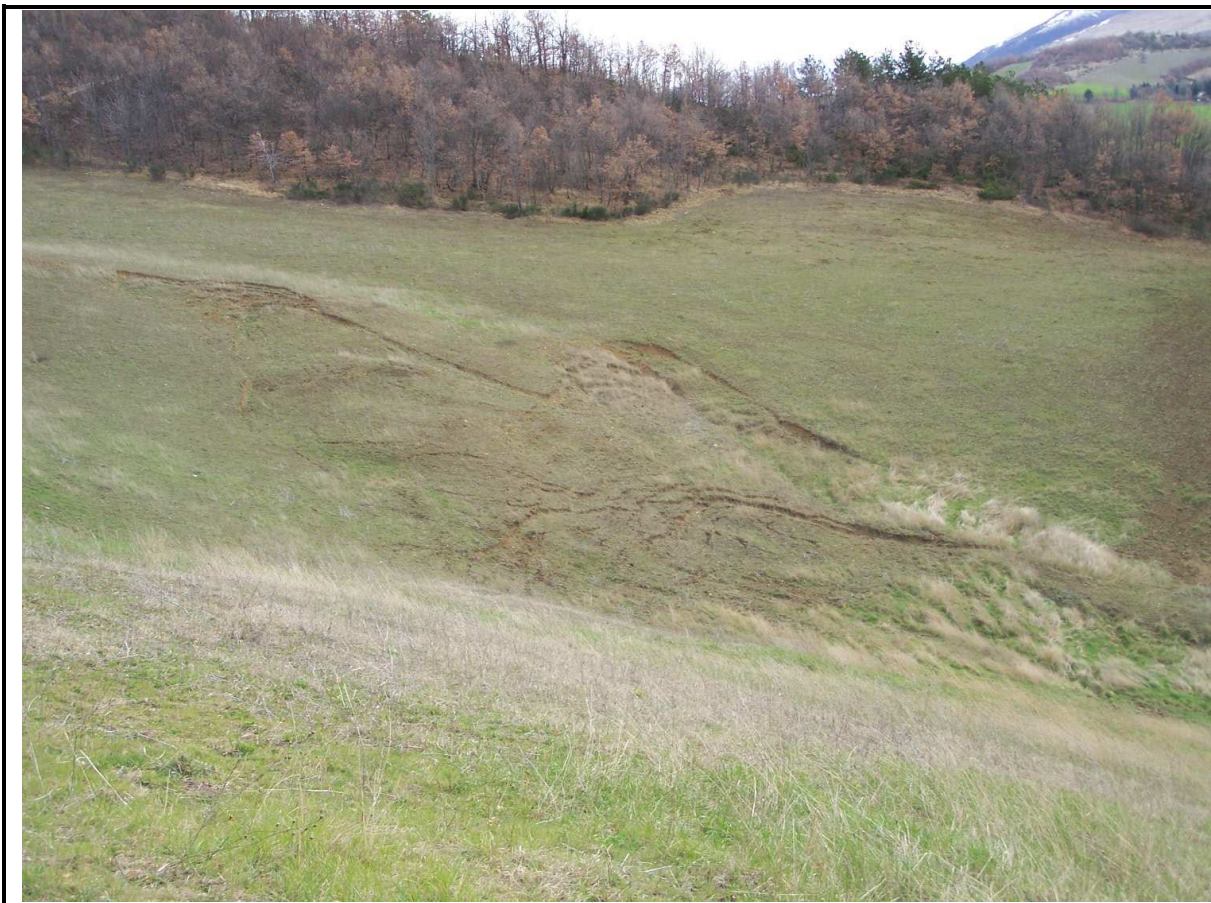
VEDUTA GENERALE CORPO DI FRANA