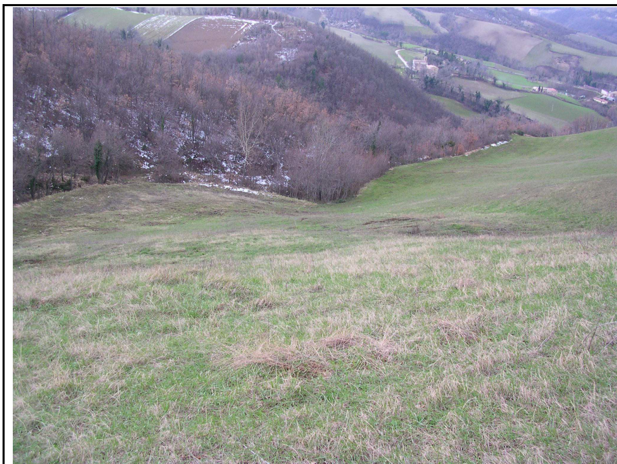
VEDUTA GENERALE CORPO DI FRANA DA MONTE