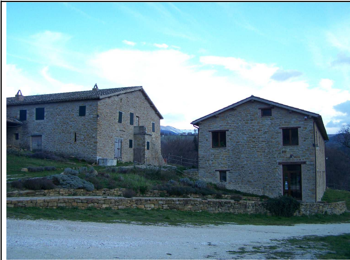
VEDUTA DELLA STRUTTURA RICETTIVA AGRITURISTICA "TERRE DELLA SIBILLA"