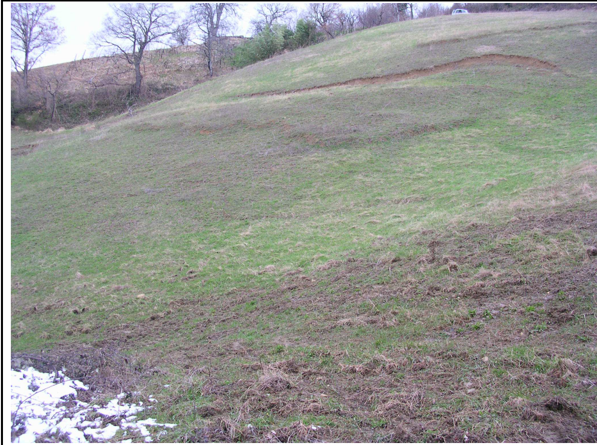
VEDUTA GENERALE CORPO DI FRANA