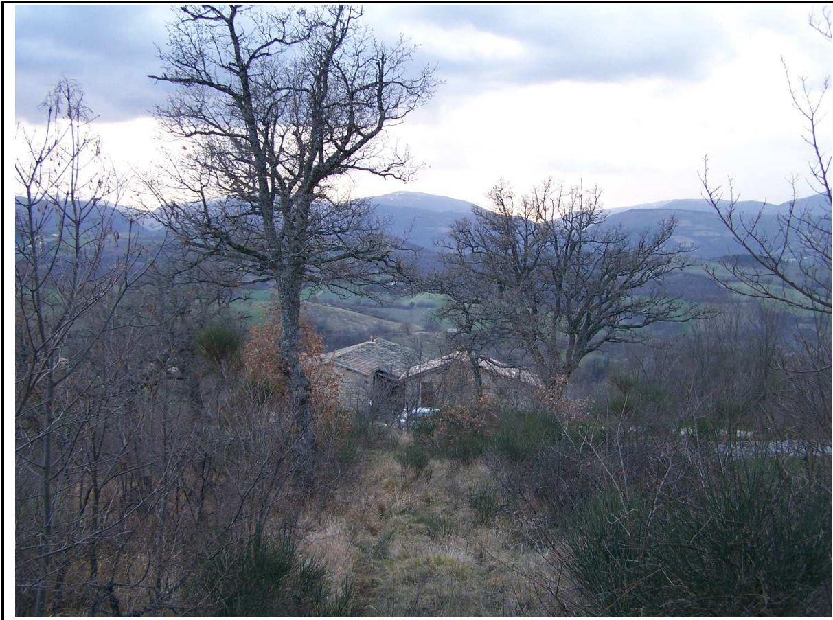
VEDUTA DA MONTE DELL'AGGLOMERATO URBANO