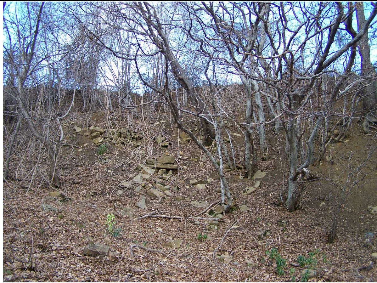
PARTICOLARE DELLA DELLA CORONA DI DISTACCO PRINCIPALE