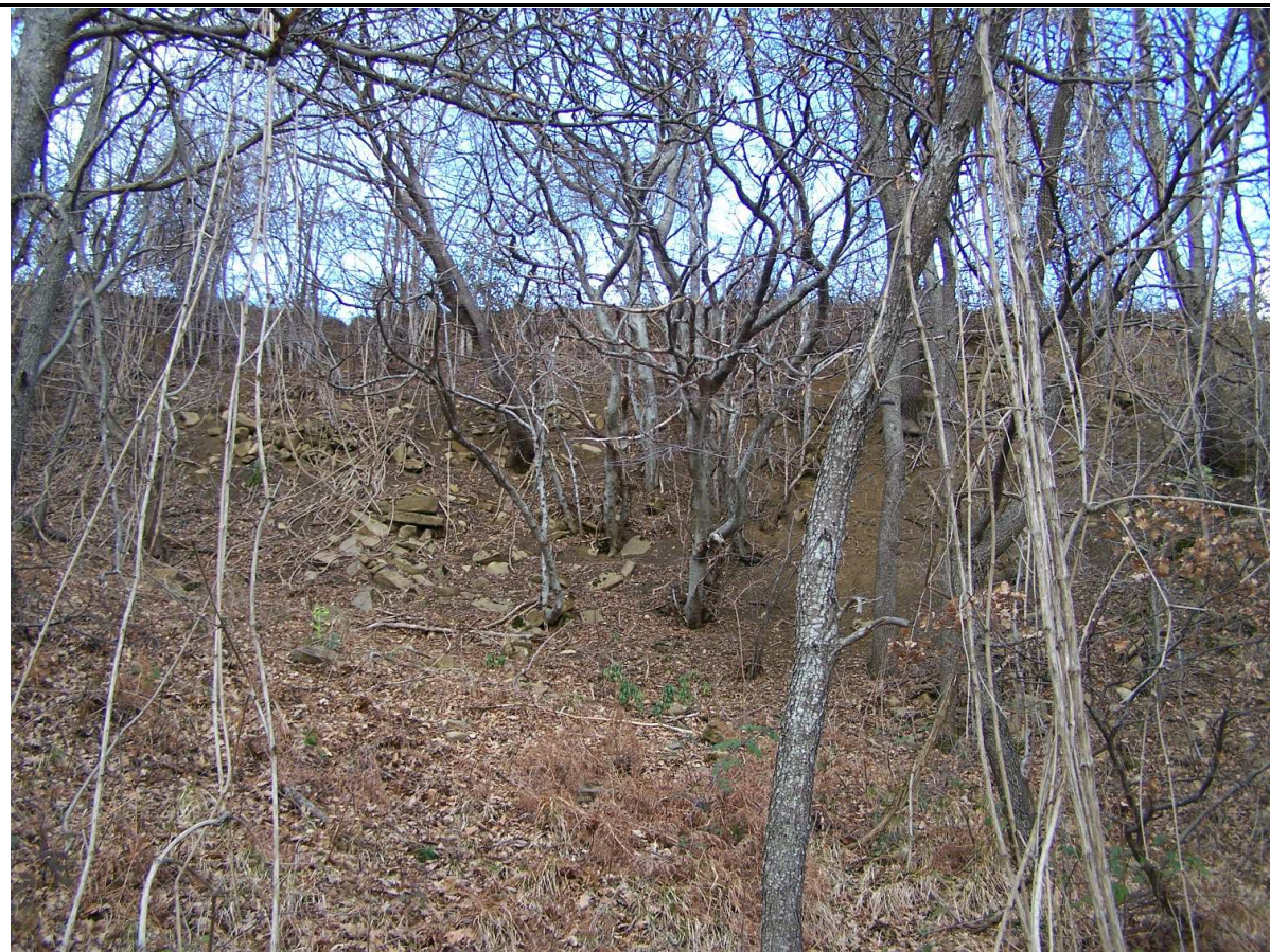
PARTICOLARE DELLA DELLA ZONA DI DISTACCO PRINCIPALE