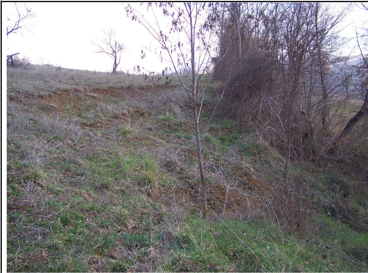
ARRETRAMENTO DELLA SCRAPATA PRINCIPALE CON EVIDENZE DI FRATTURE DI TRAZIONE