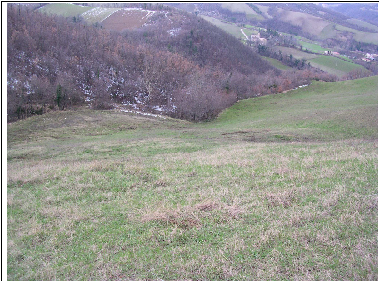
VEDUTA GENERALE CORPO DI FRANA DA MONTE