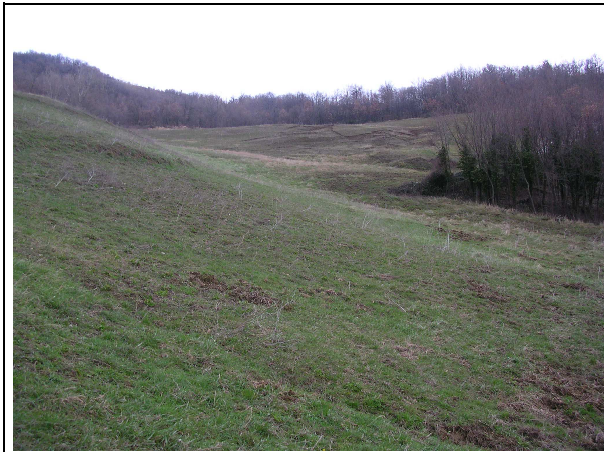
VEDUTA GENERALE CORPO DI FRANA