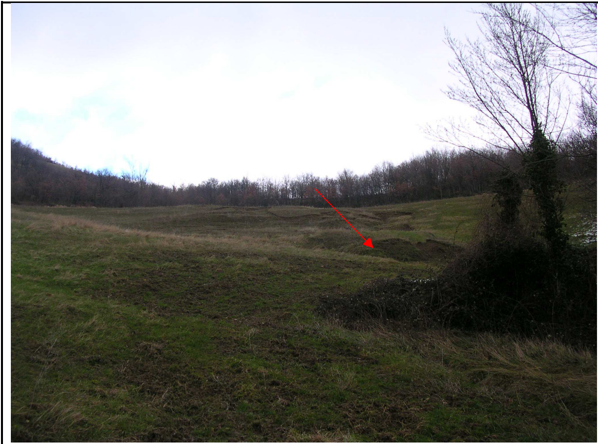
VEDUTA GENERALE CORPO DI FRANA CON EVIDENTE EMERGENZA ACQUIFERA