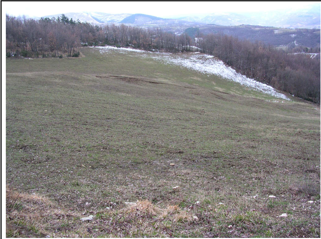
VEDUTA GENERALE CORPO DI FRANA