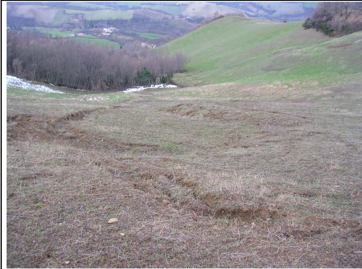
VEDUTA GENERALE CORPO DI FRANA