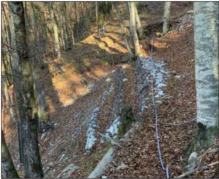
FOTOGRAFIA n° 01