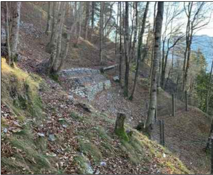
FOTOGRAFIA n° 02