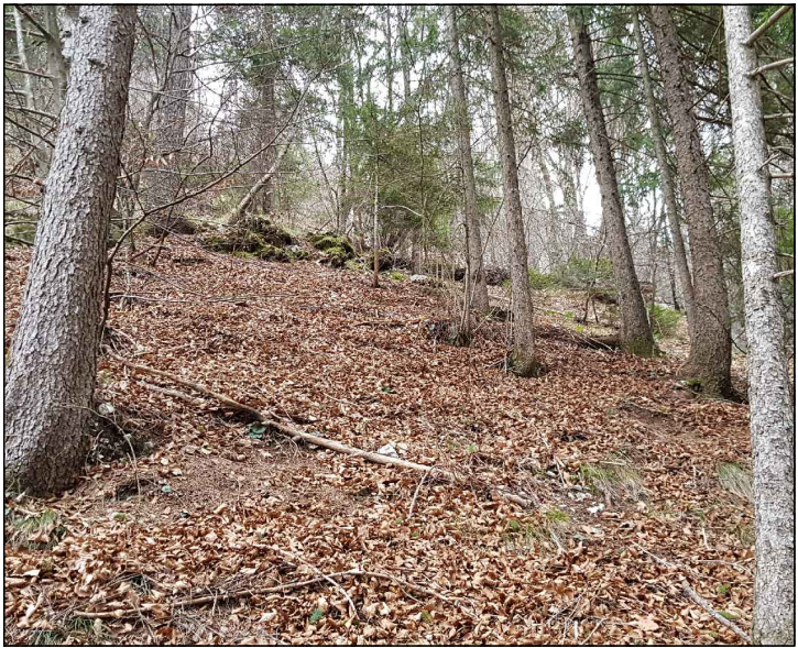
FOTOGRAFIA n° 06