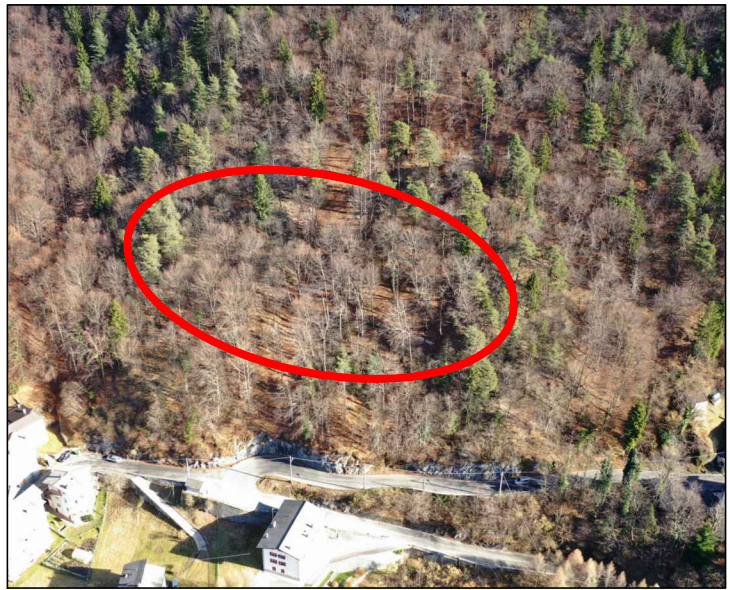
INQUADRAMENTO intervento 1