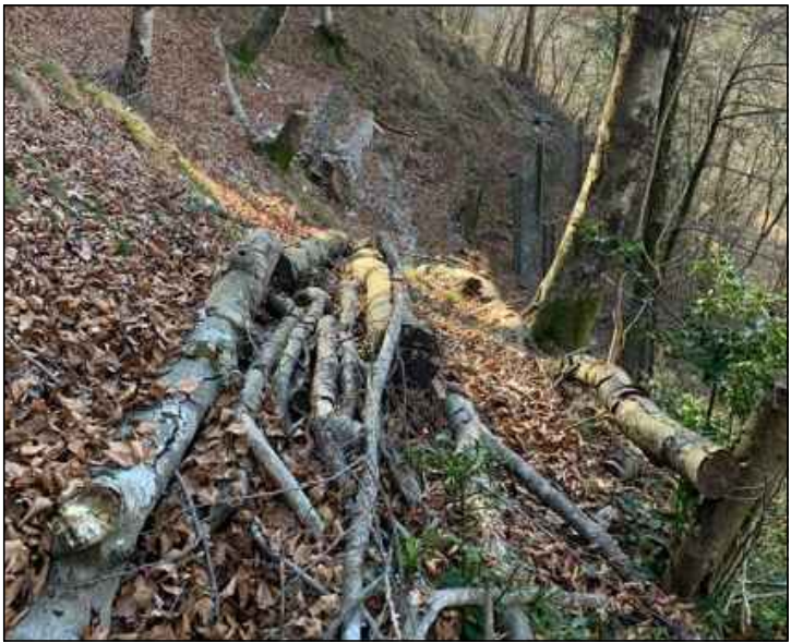
FOTOGRAFIA n° 03