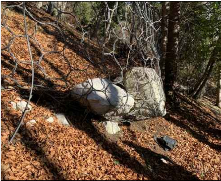
FOTOGRAFIA n° 05