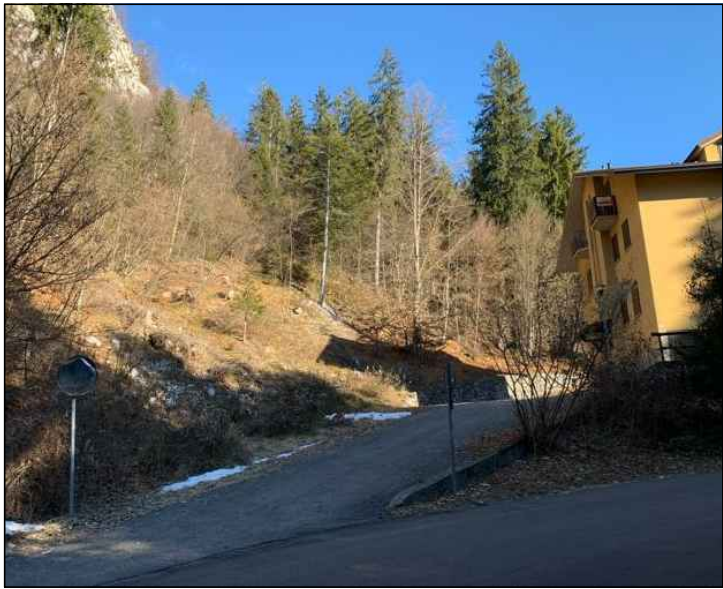
FOTOGRAFIA n° 04