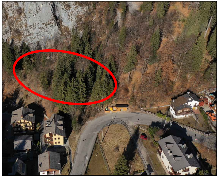
INQUADRAMENTO intervento 2