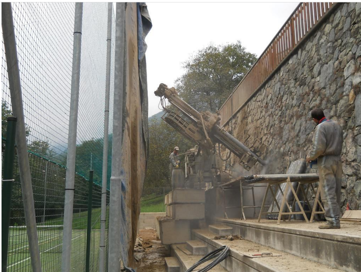
Intervento C (durante le lavorazioni) 4