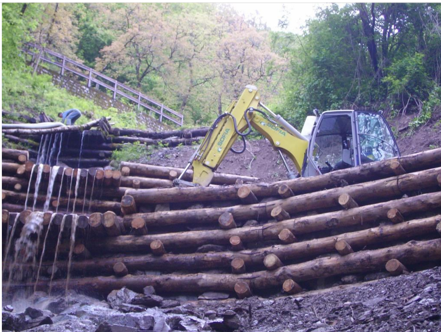
Intervento B (durante le lavorazioni) 6