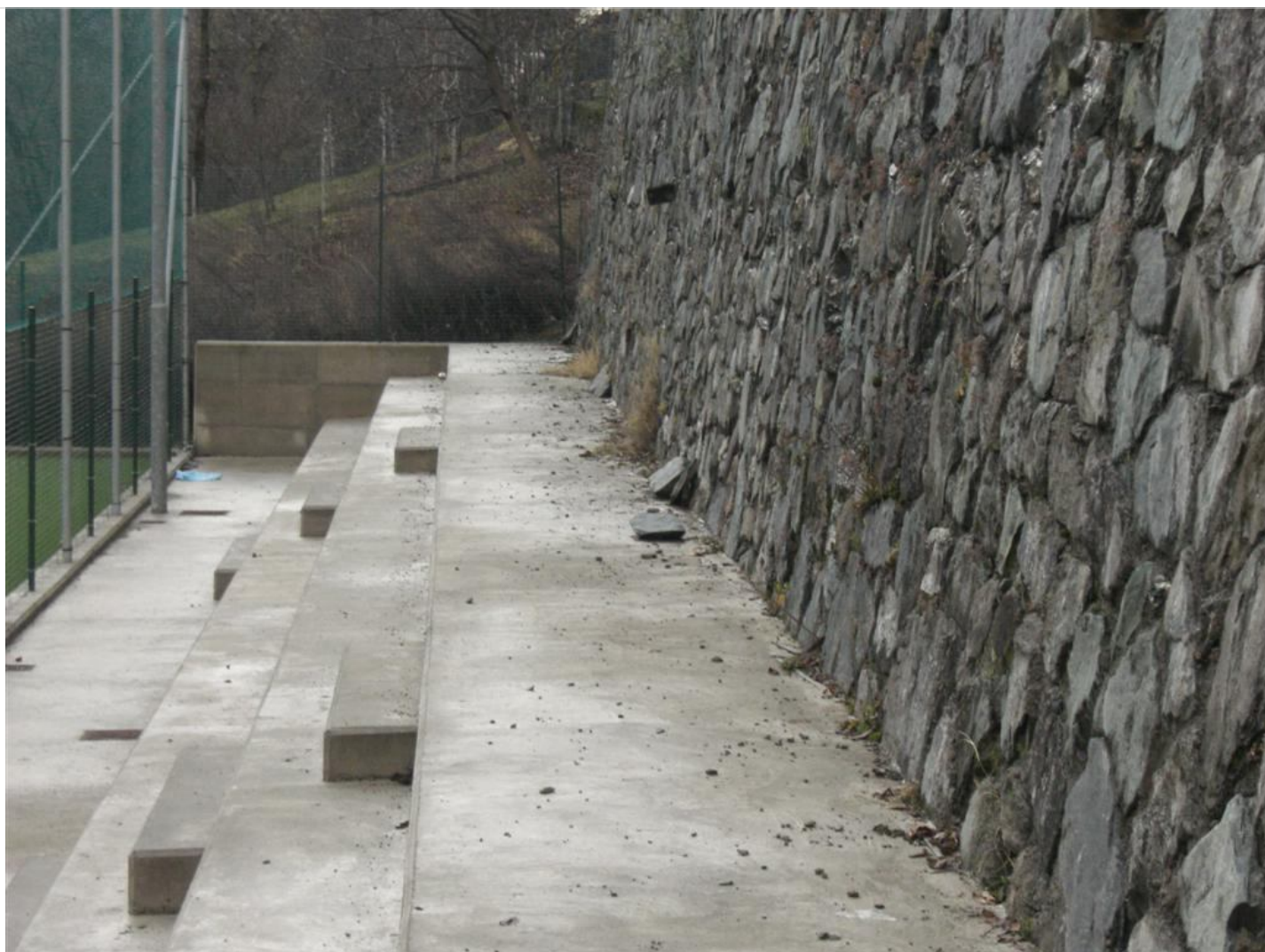
Intervento C (prima) 4