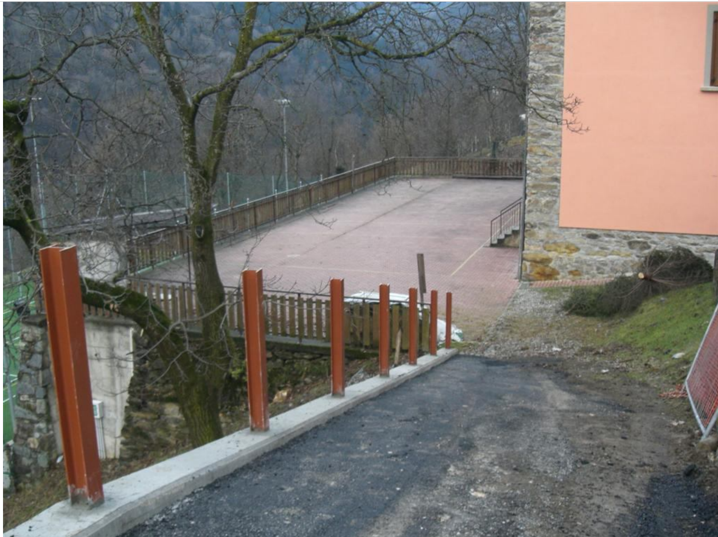
Intervento C (prima) 1