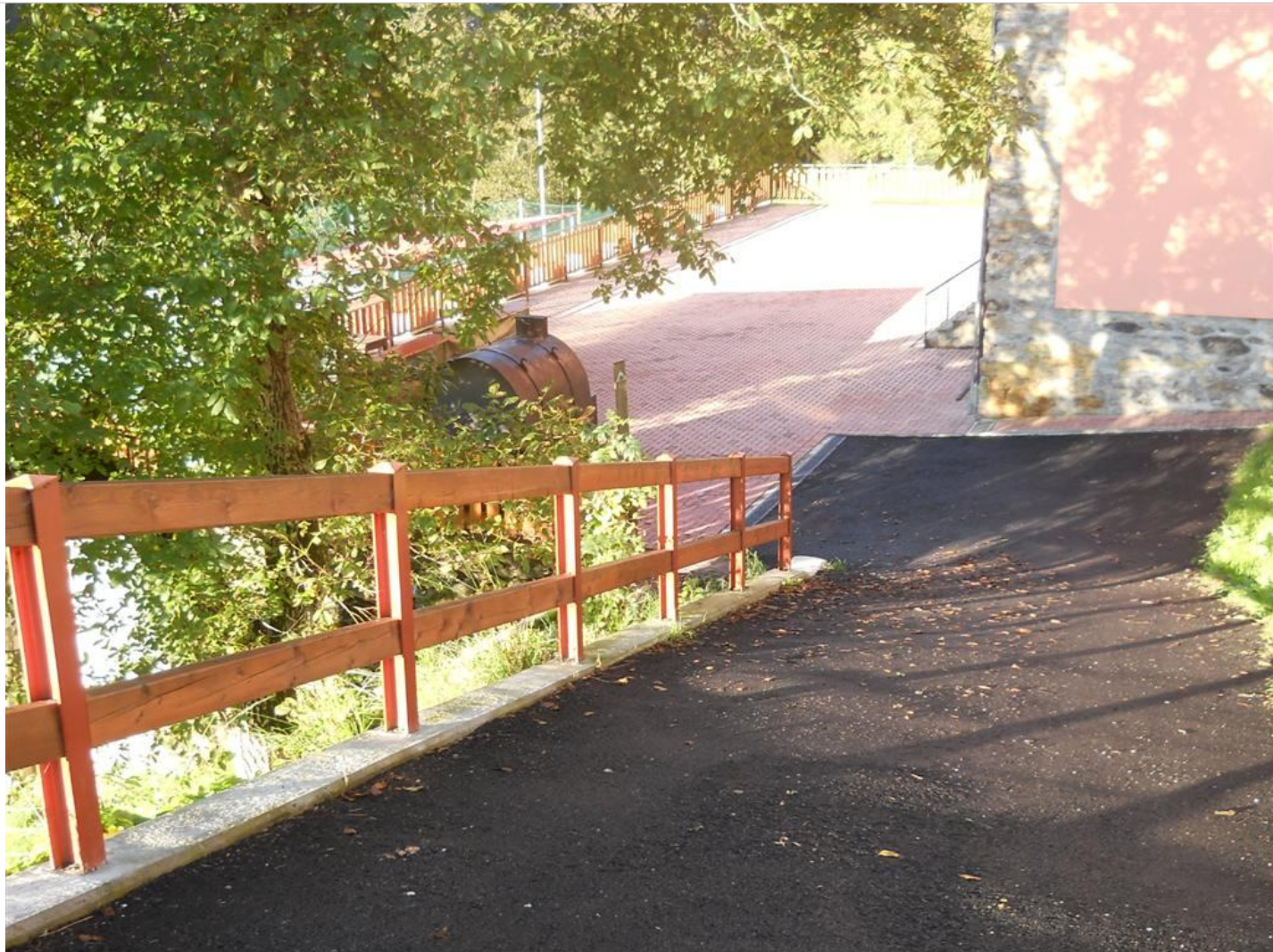
Intervento C (dopo) 1