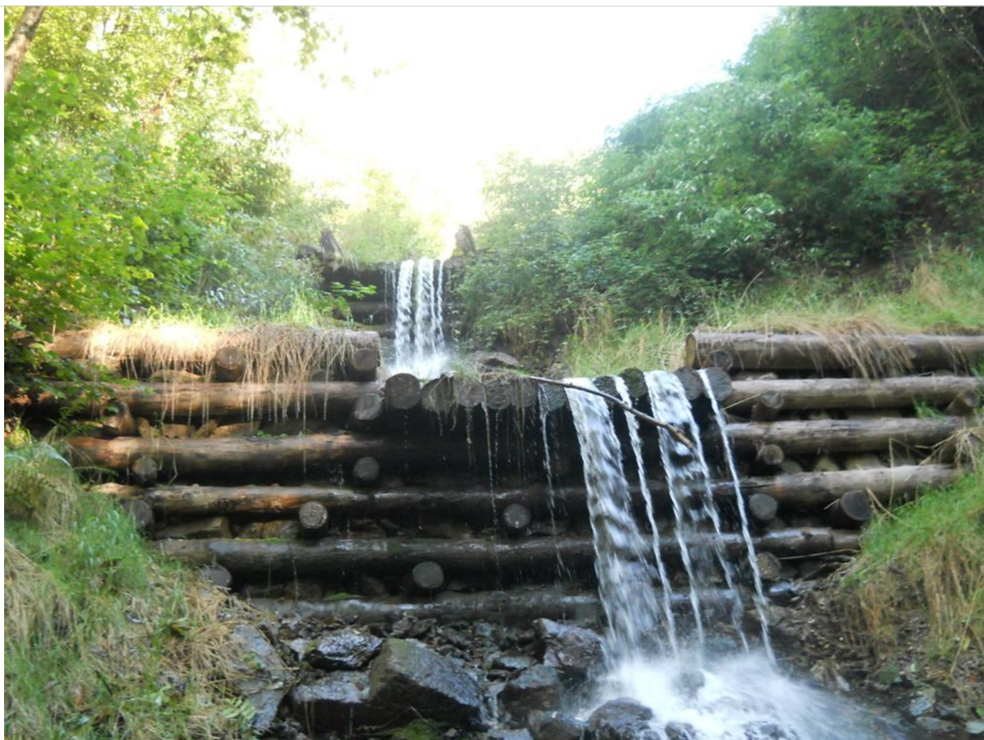
Intervento B (dopo) 2