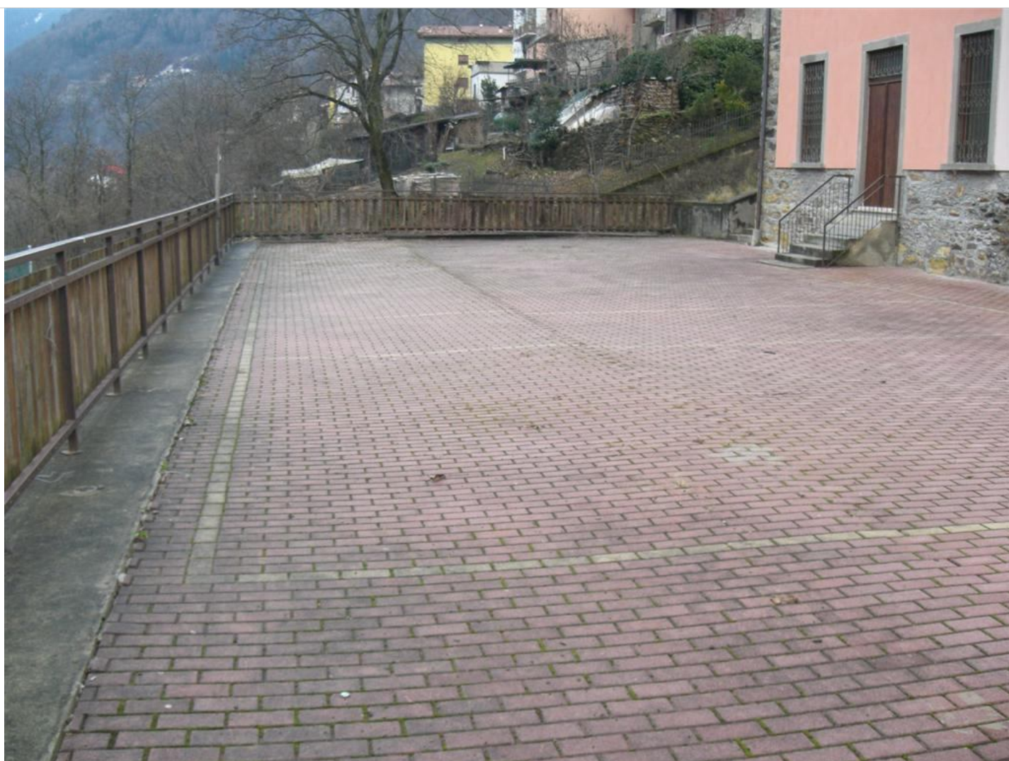
Intervento C (prima) 3