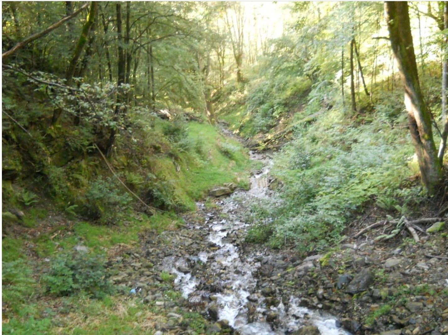
Intervento B (dopo) 3