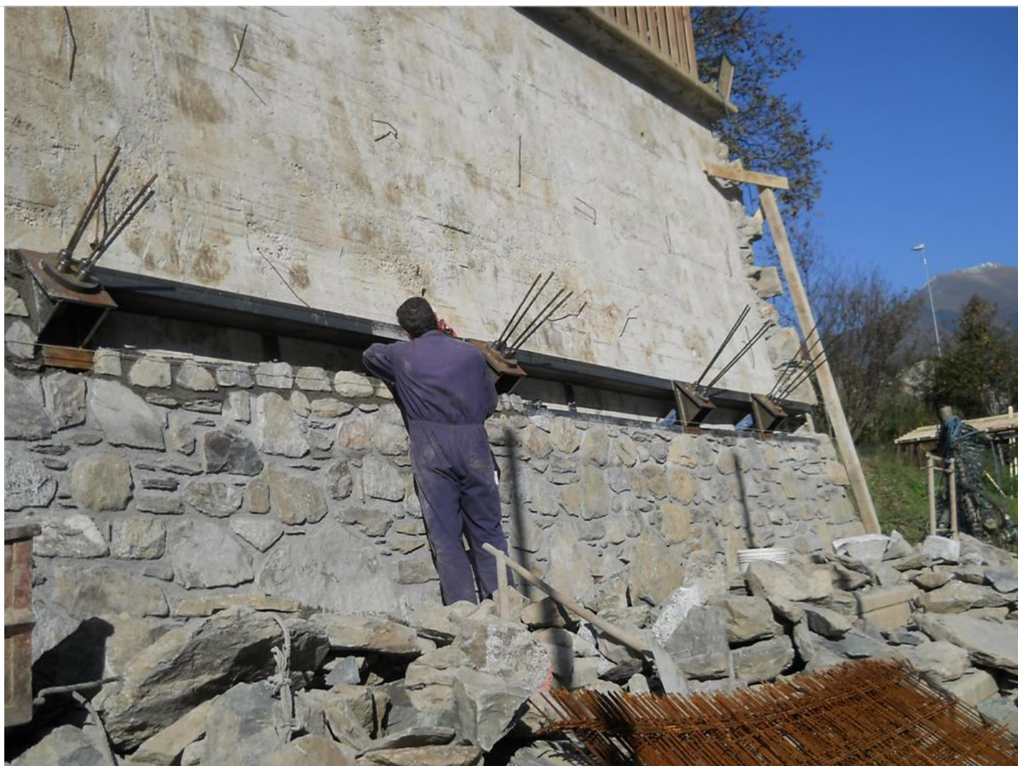
Intervento C (durante le lavorazioni) 6