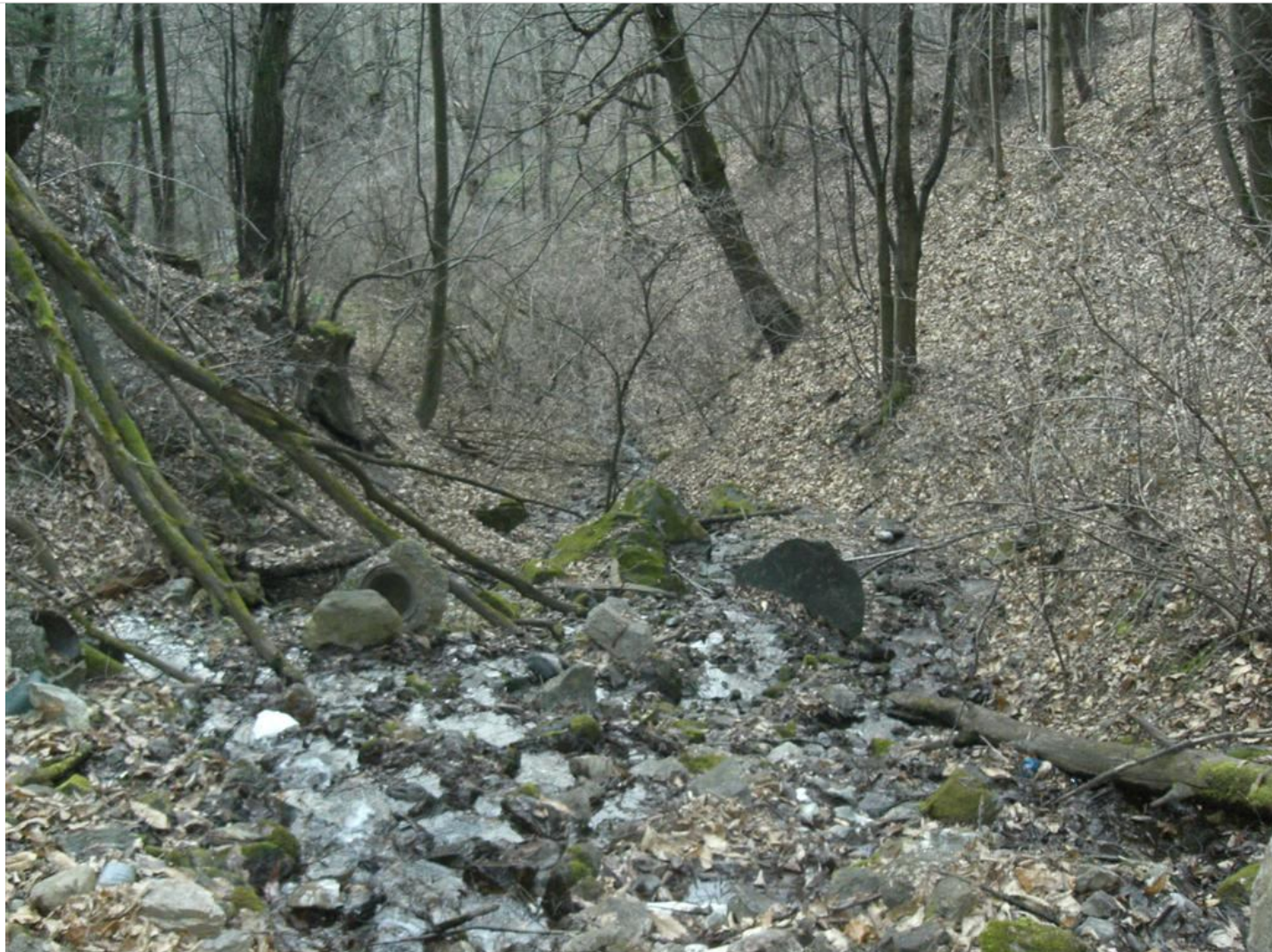
Intervento B (prima) 3