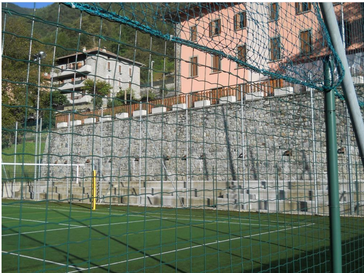
Intervento C (dopo) 2