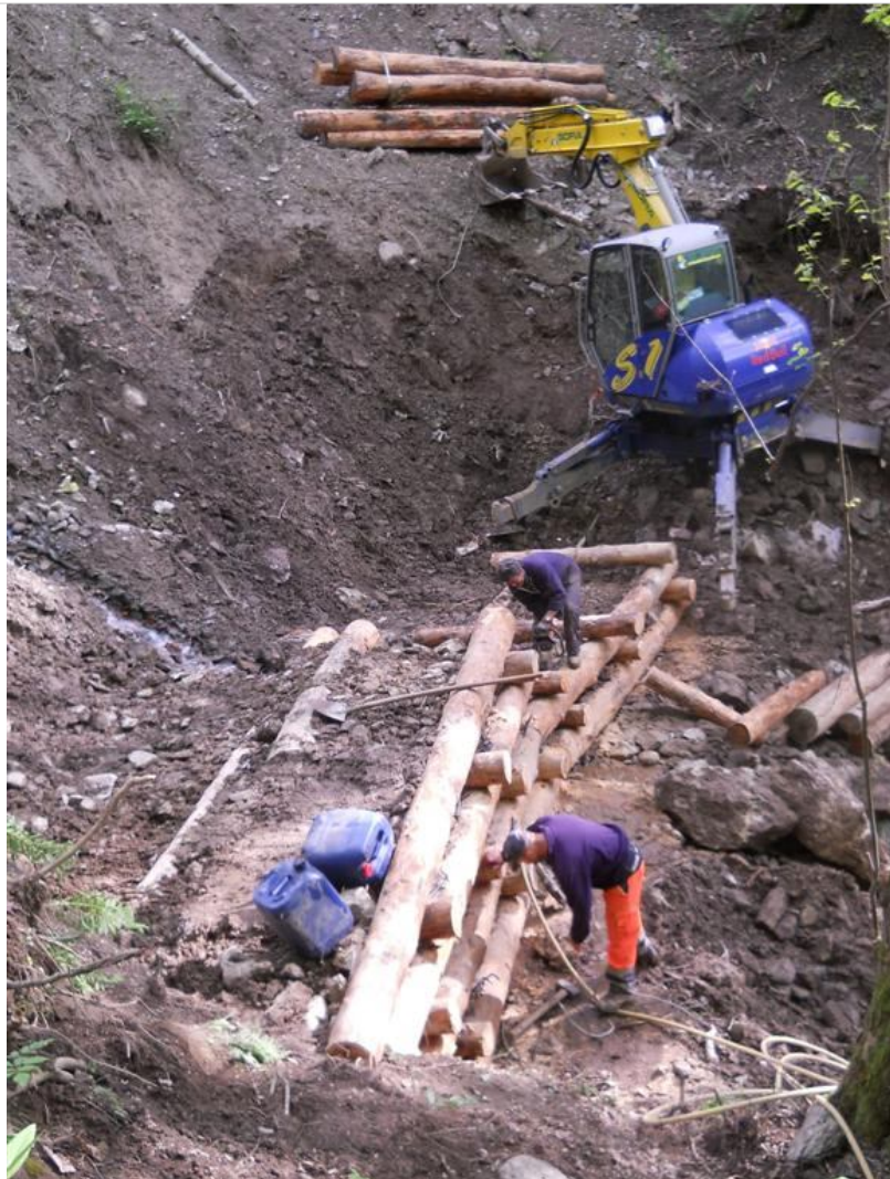
Intervento B (durante le lavorazioni) 3