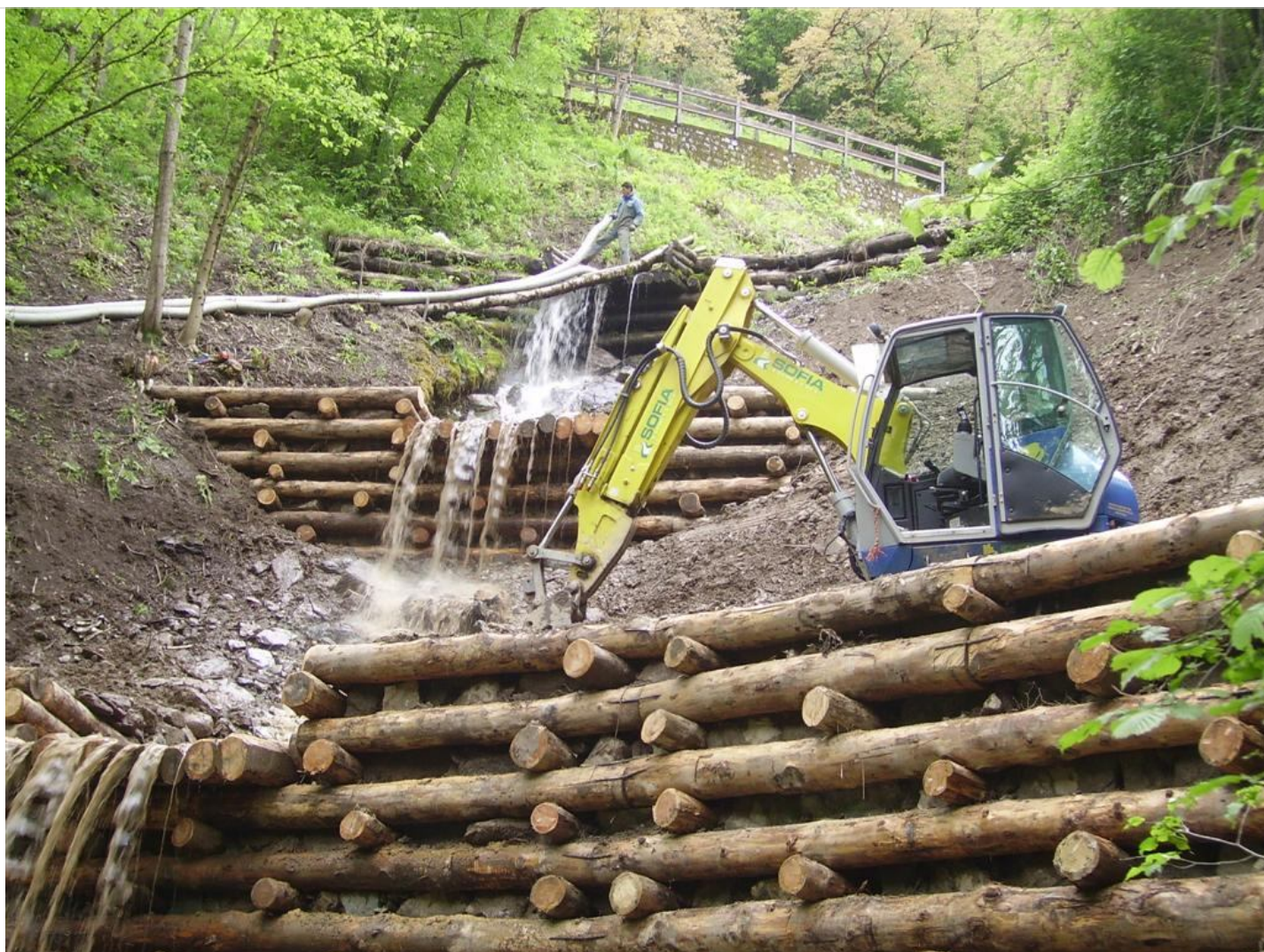
Intervento B (durante le lavorazioni) 10