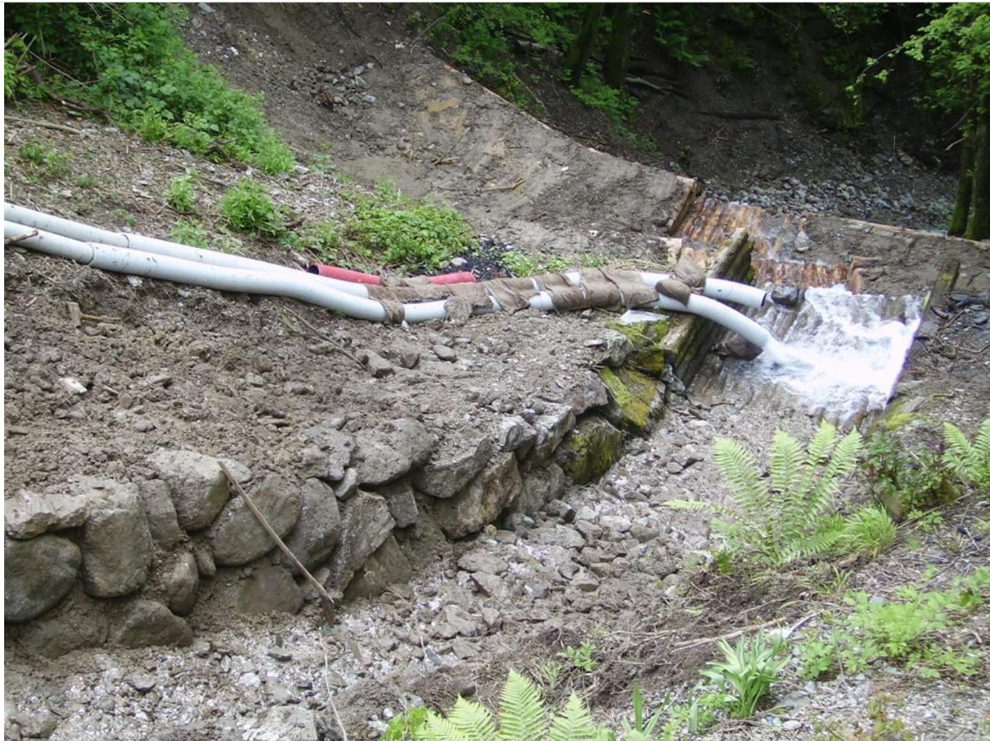
Intervento B (durante le lavorazioni) 11