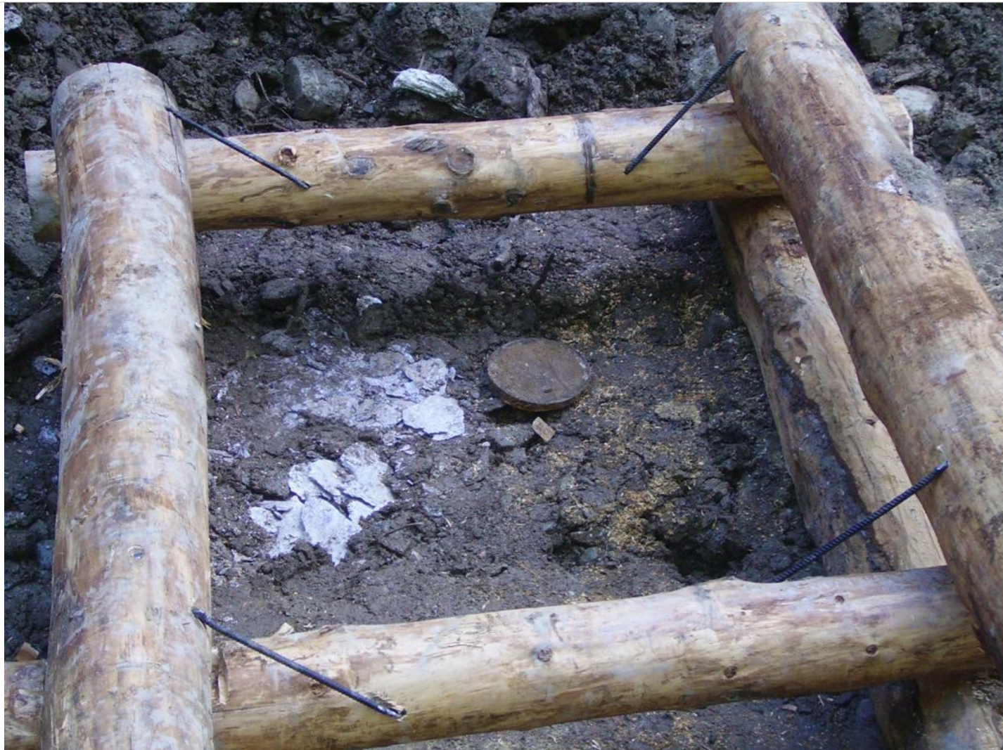
Intervento B (durante le lavorazioni) 1