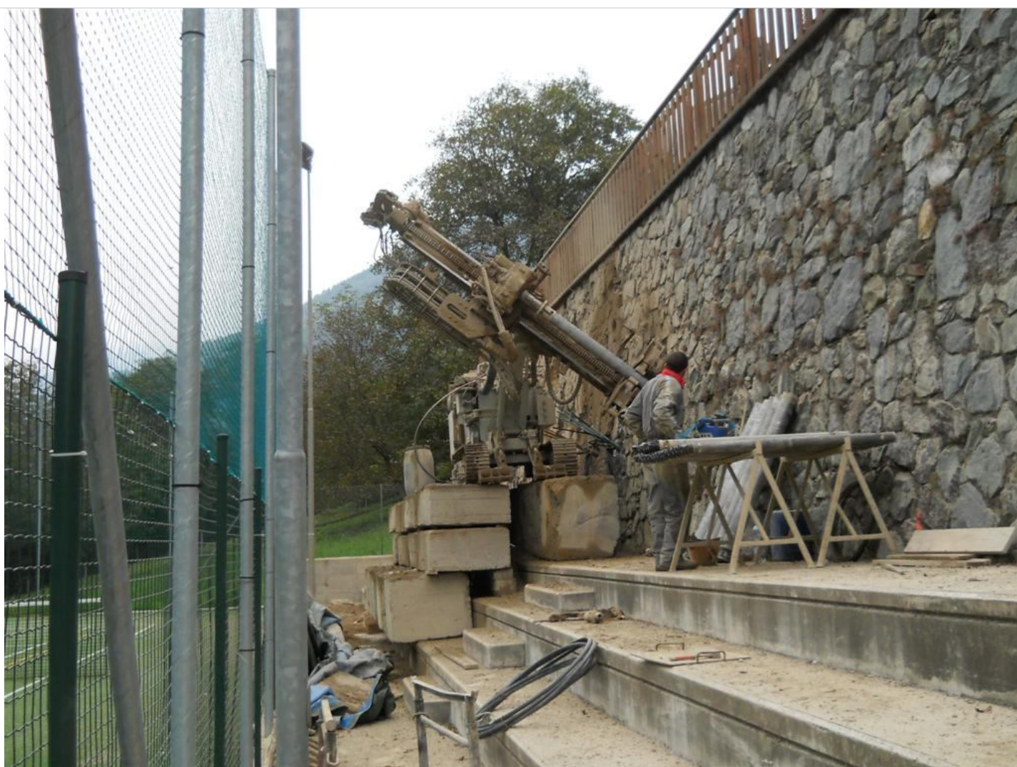
Intervento C (durante le lavorazioni) 1