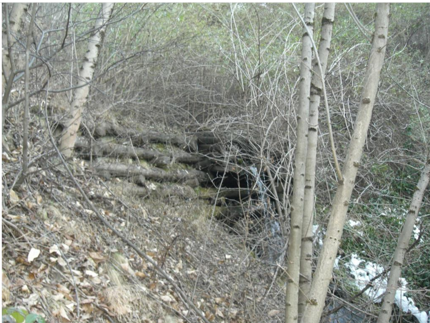
Intervento B (prima) 2