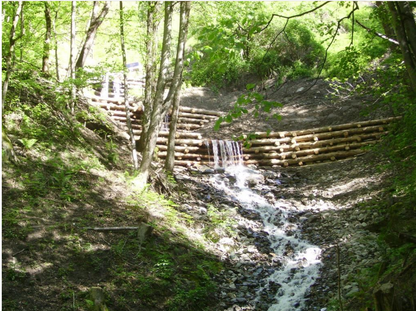
Intervento B (dopo) 1