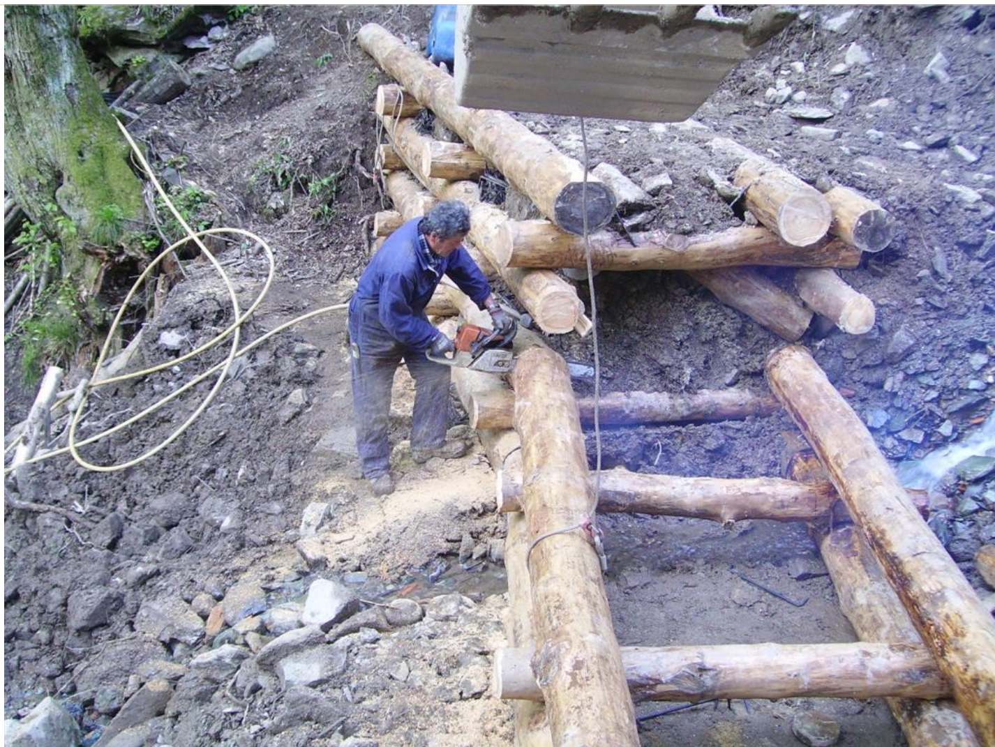
Intervento B (durante le lavorazioni) 4