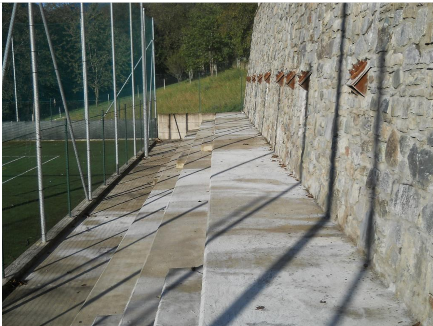
Intervento C (dopo) 4