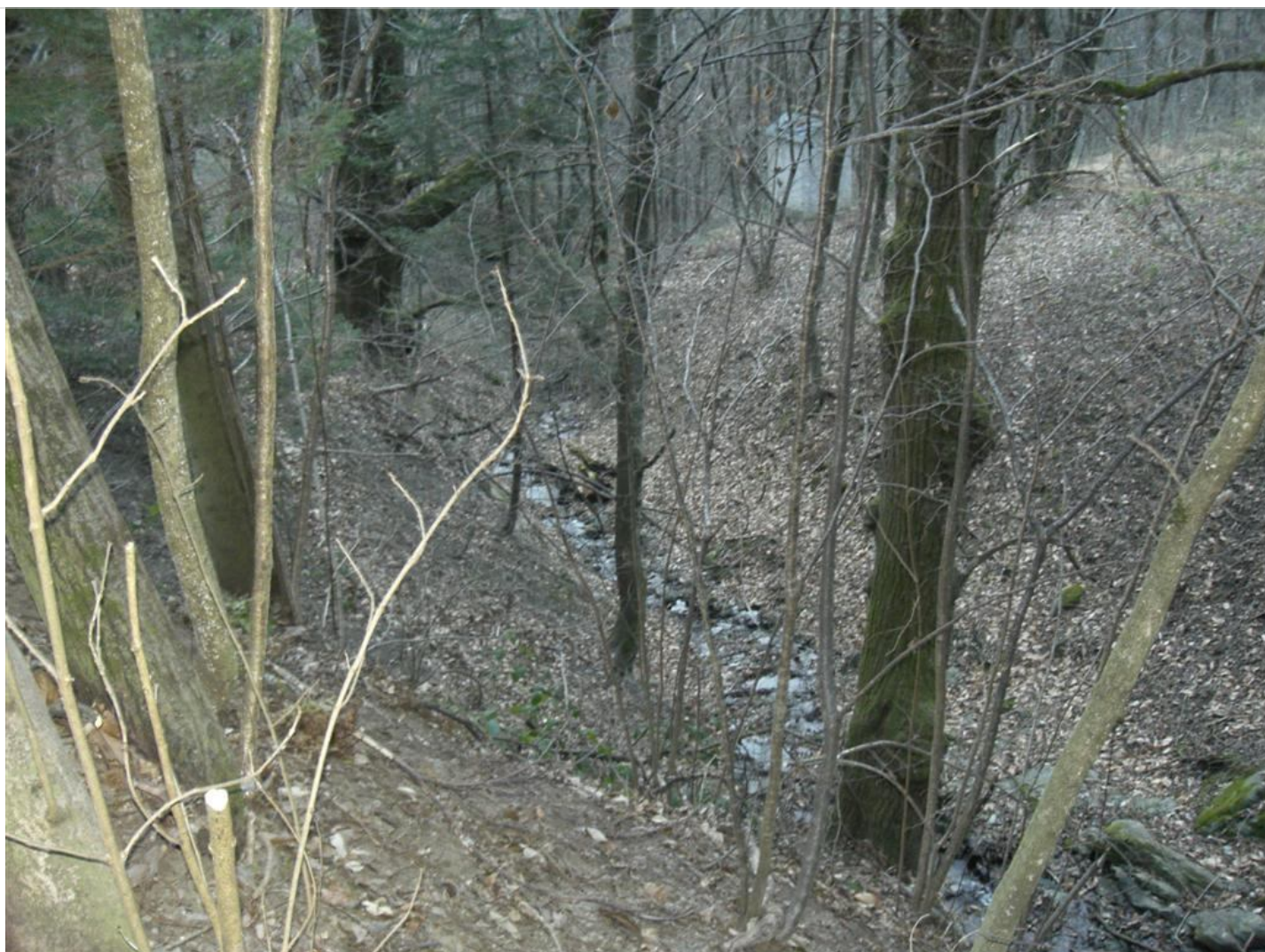
Intervento B (prima) 4