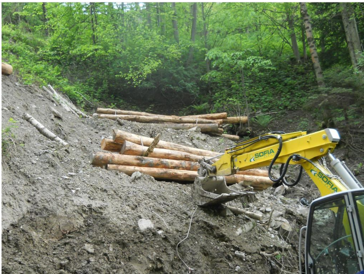
Intervento B (durante le lavorazioni) 2