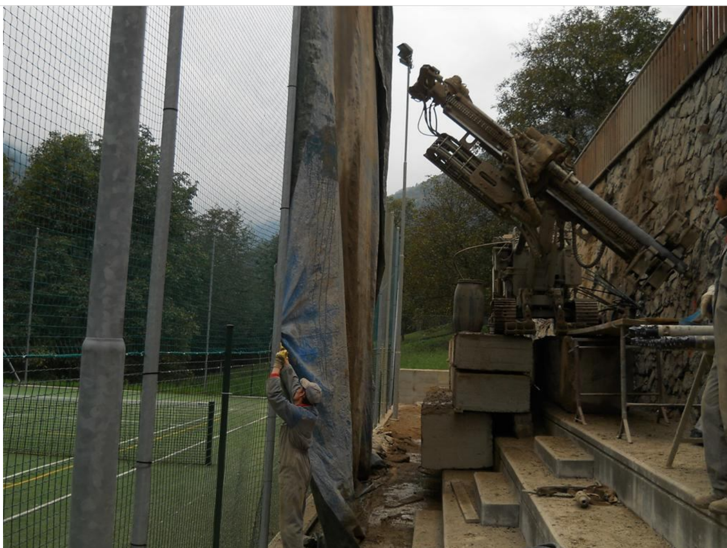
Intervento C (durante le lavorazioni) 3