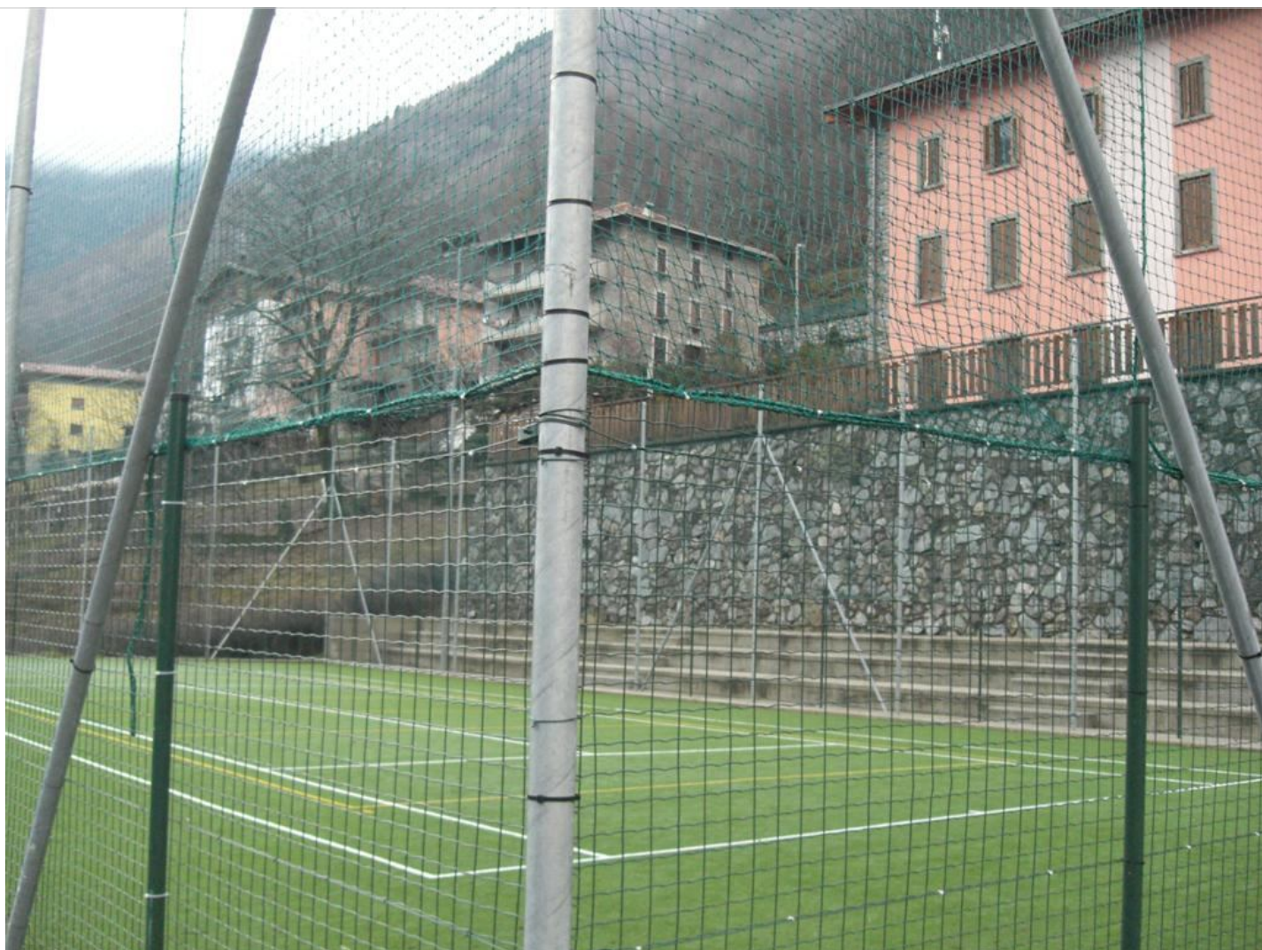
Intervento C (prima) 2