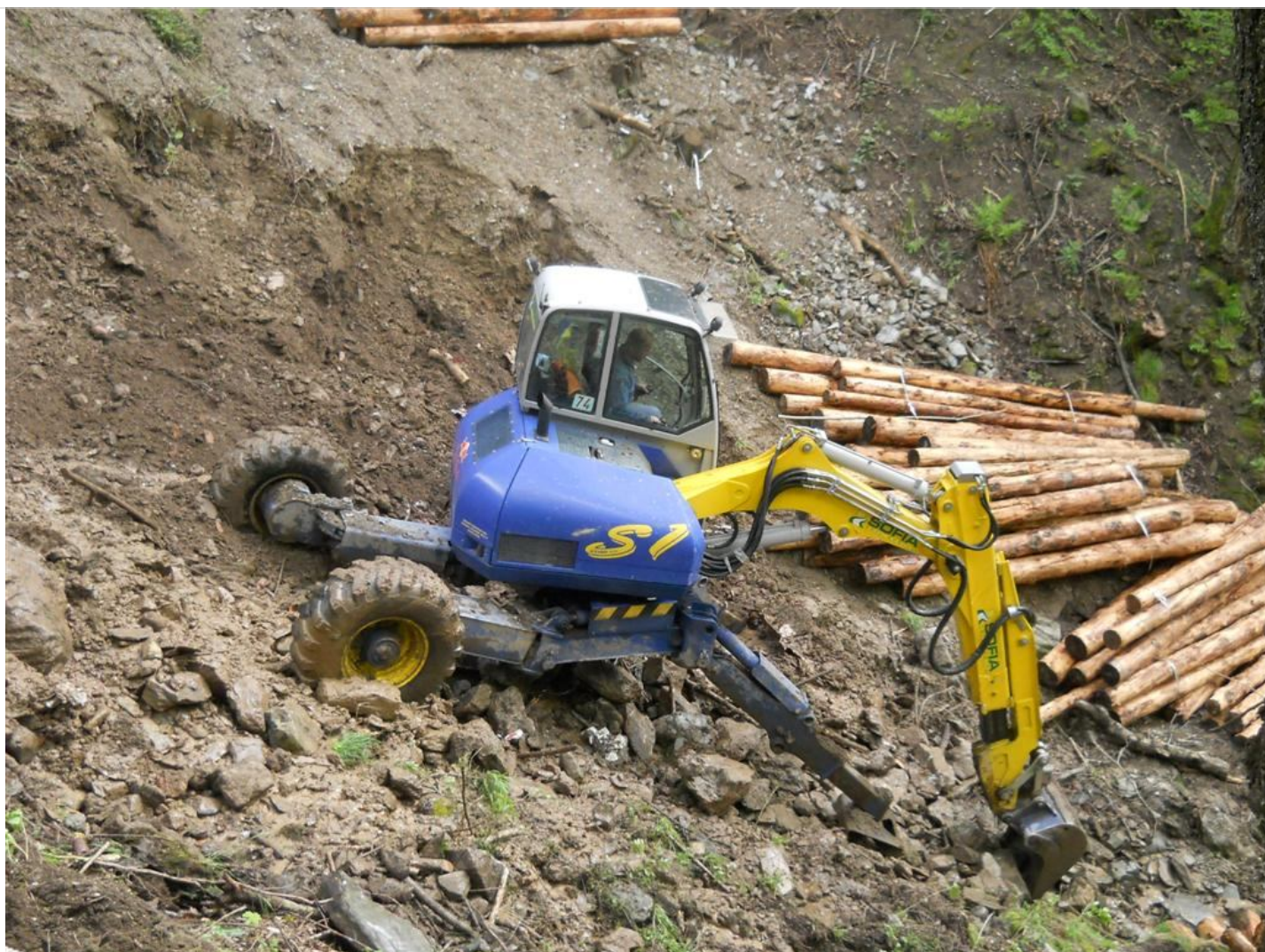
Intervento B (durante le lavorazioni) 12