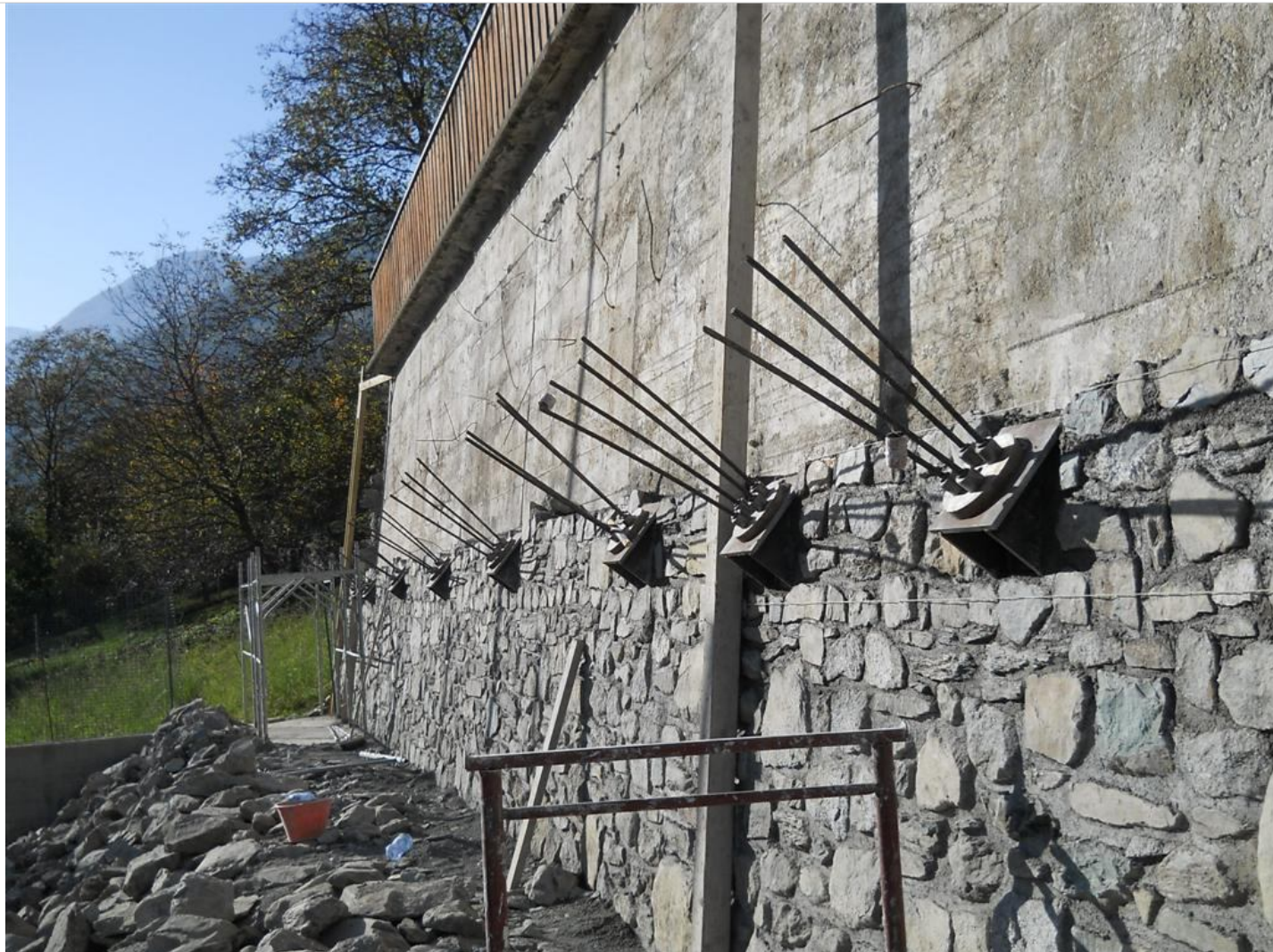
Intervento C (durante le lavorazioni) 5