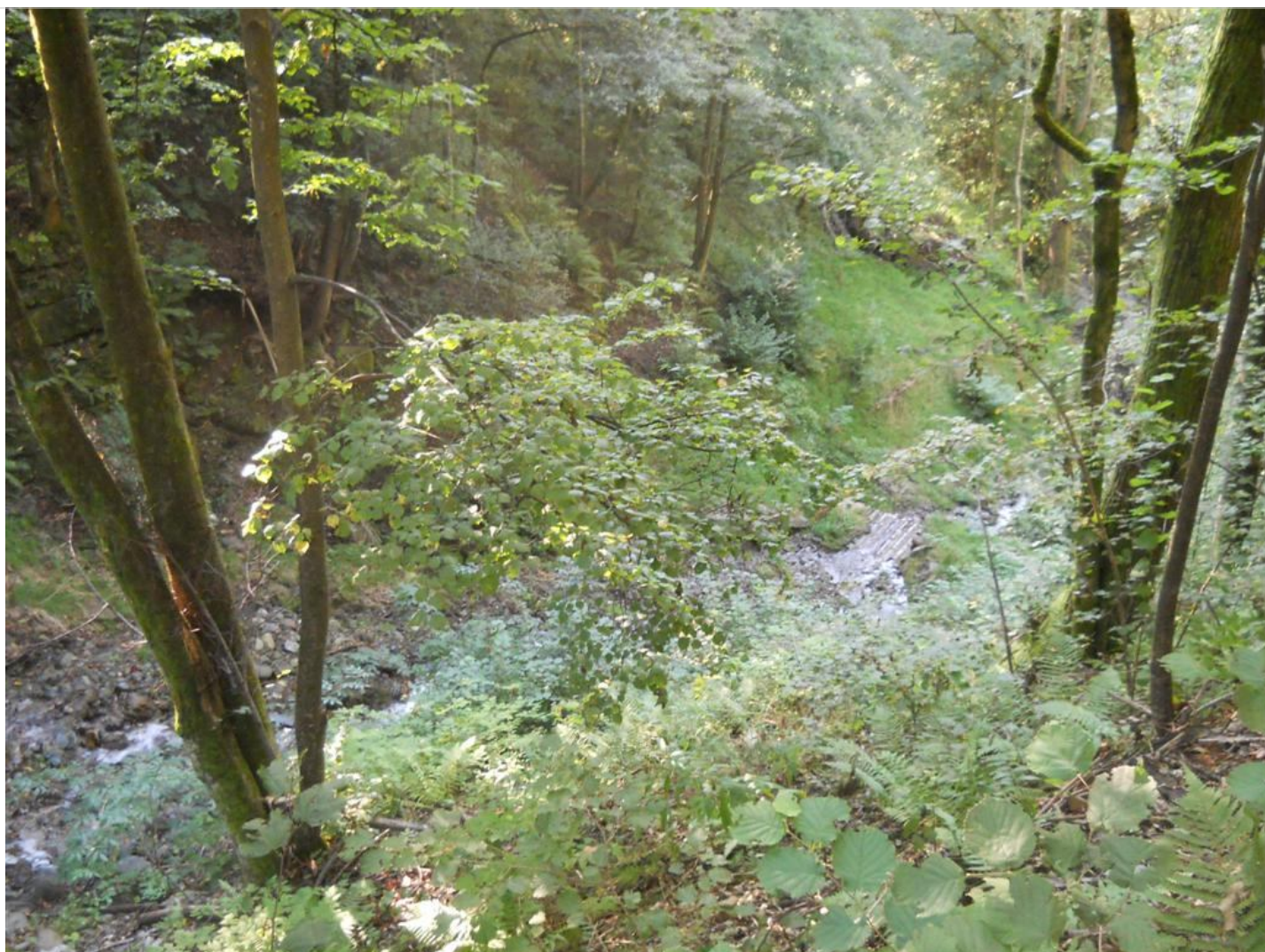
Intervento B (dopo) 4