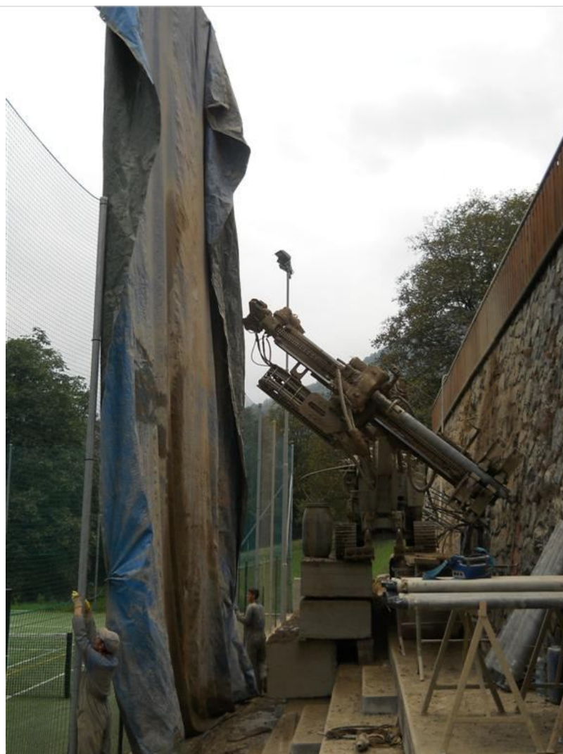
Intervento C (durante le lavorazioni) 2