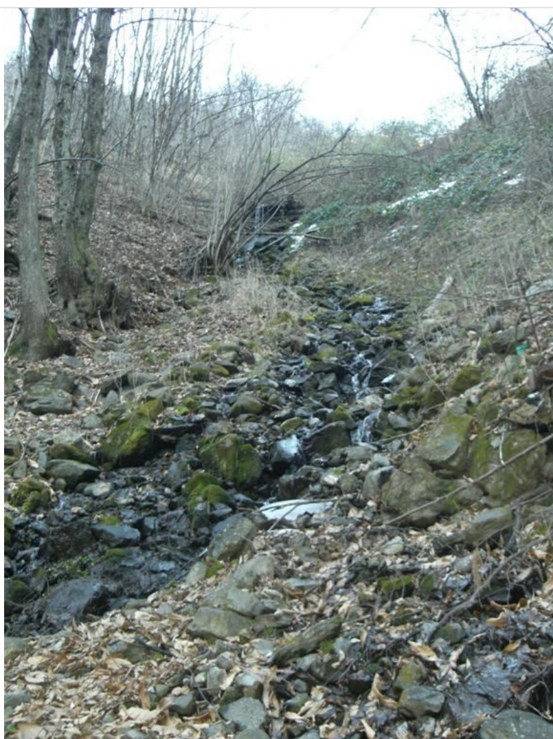
Intervento B (prima) 1