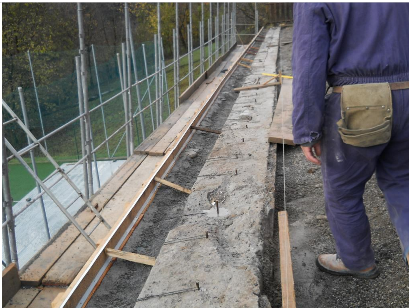
Intervento C (durante le lavorazioni) 8