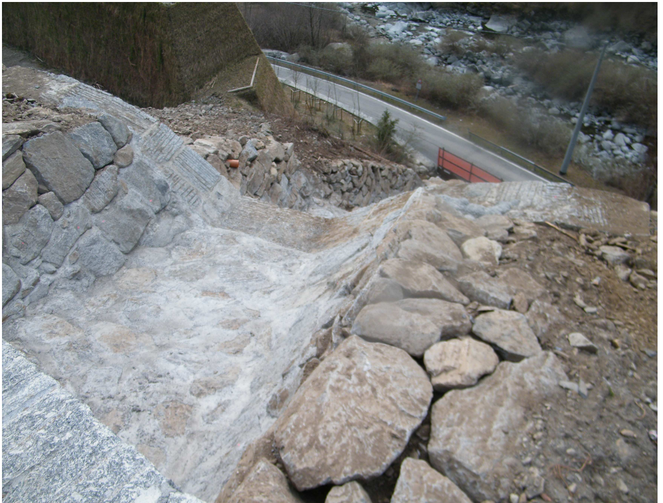
Interventi di adeguamento dell'alveo a valle della vasca e briglia n.2 completati