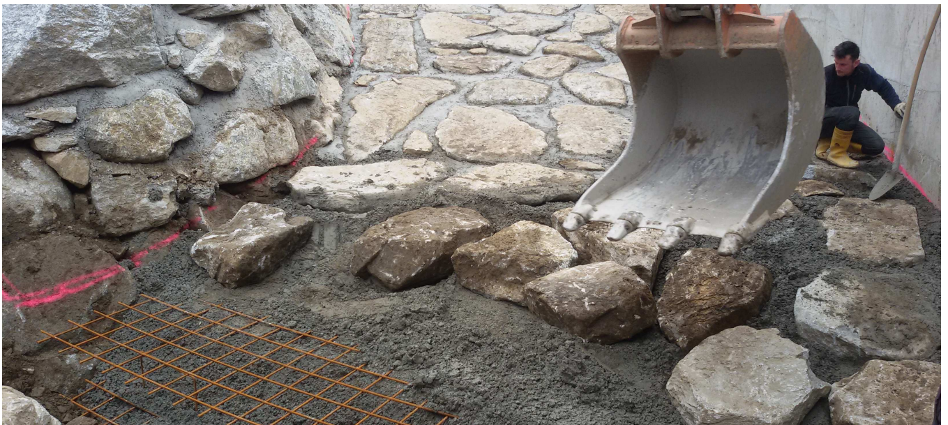
Realizzazione del fondo della vasca