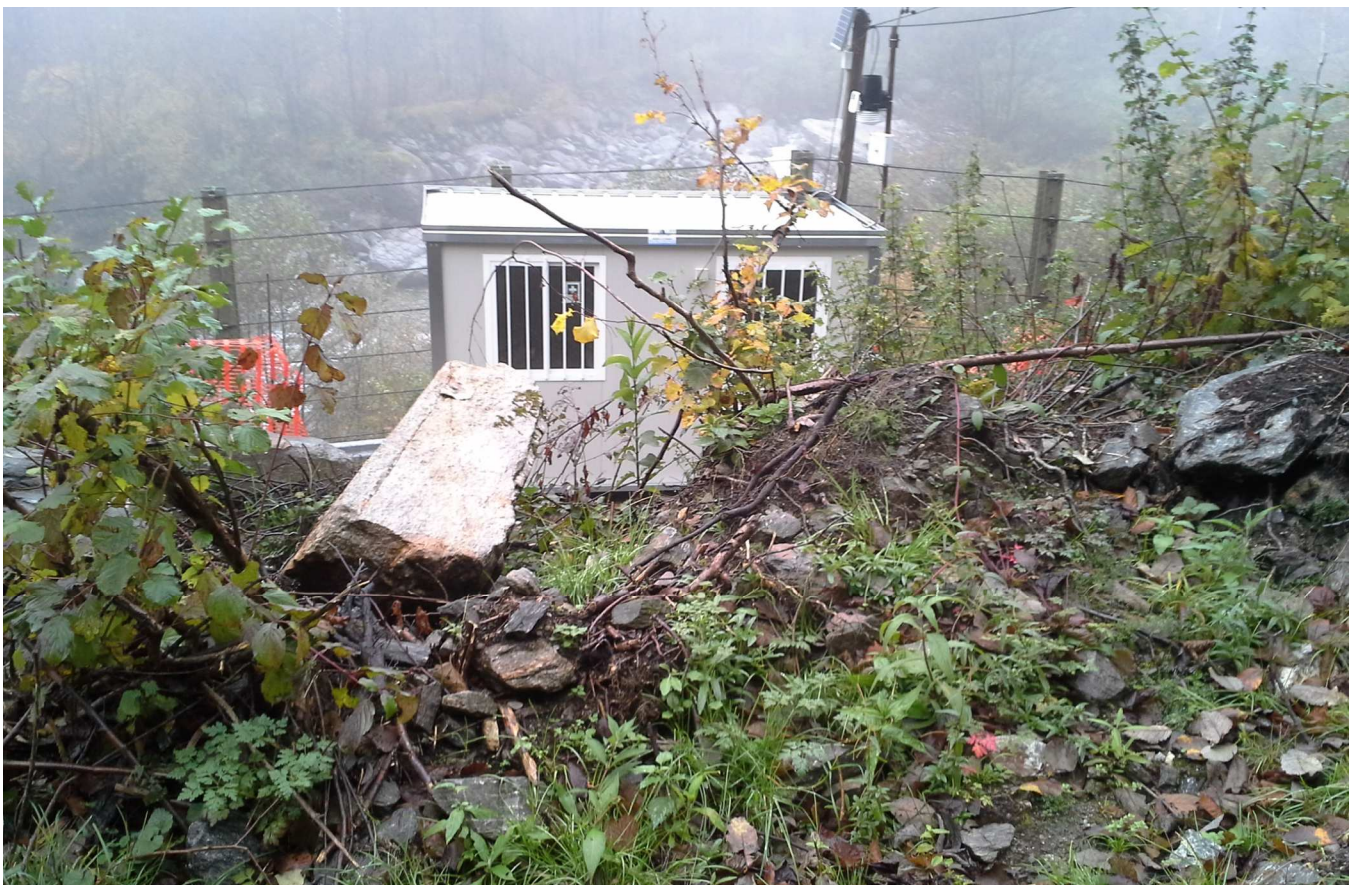
Ripresa del masso arrestatosi a monte della baracca di cantiere