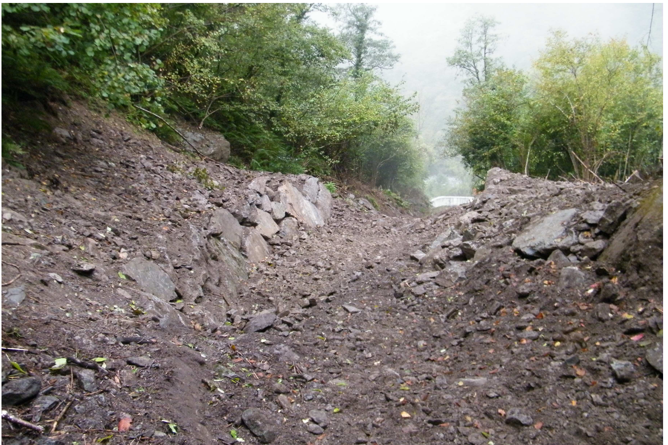
Lavori di adeguamento alveo nel settore tra la Briglia I e Briglia n.6