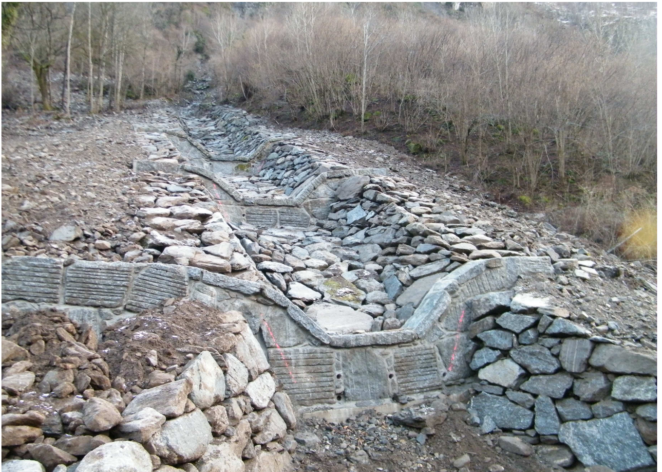
Lavori ultimati nel tratto di alveo a monte della vasca di accumulo