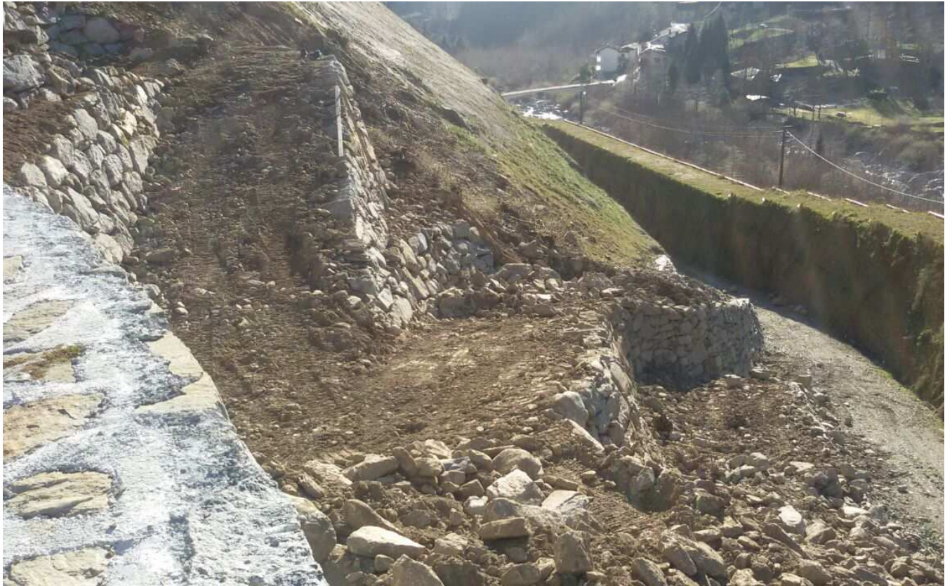
Strada di servizio lato sud in fase di ultimazione