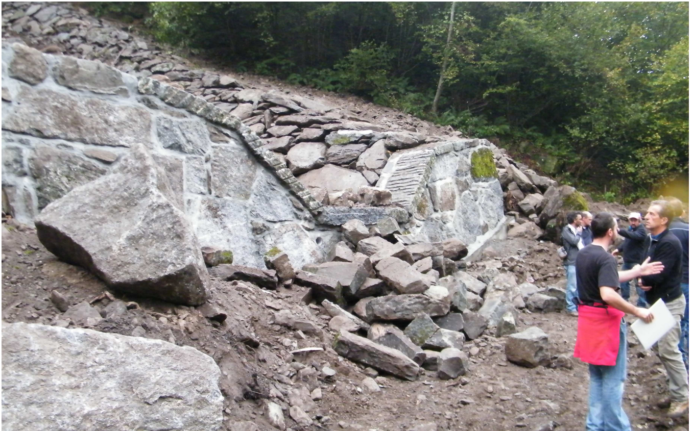
Ripresa fotografica della Briglia 6 e riprofilatura a monte completata