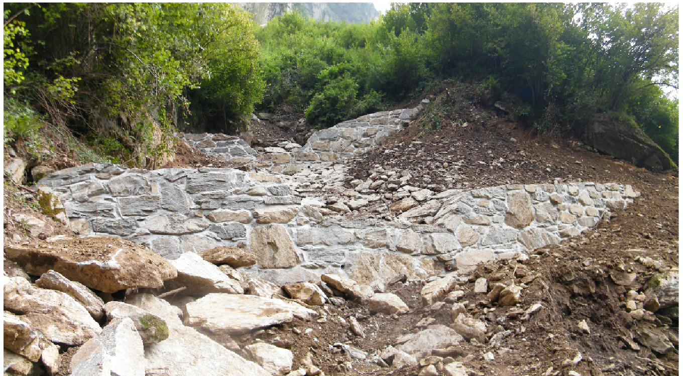
Ultimazione lavori Briglia I e II, riprofilatura versante ed adeguamento alveo