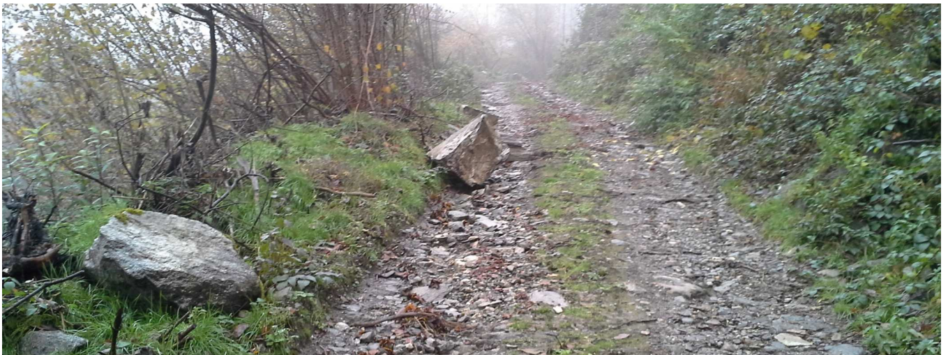
Ripresa dei massi arrestatisi a monte della strada provinciale