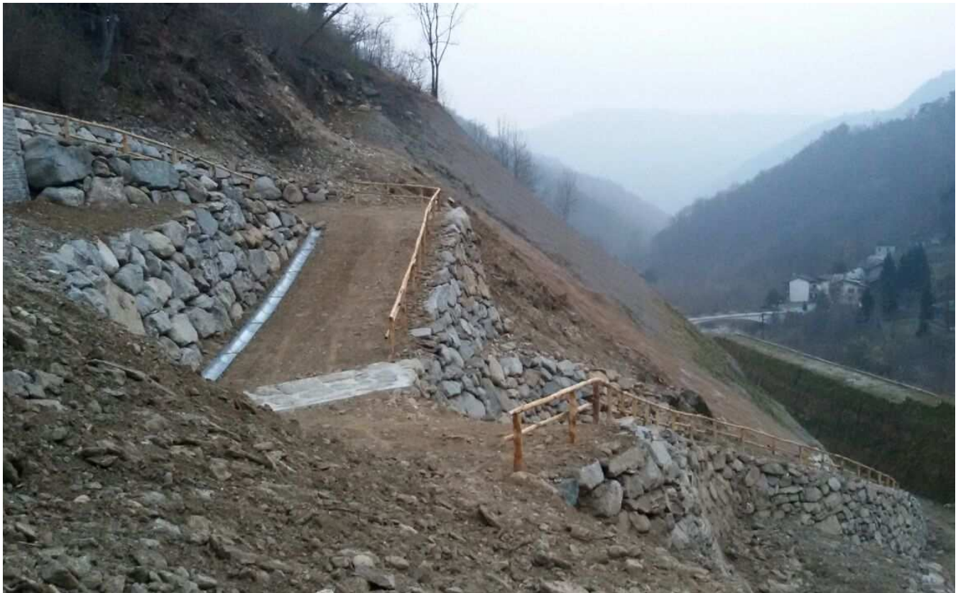
Strada Lato Sud ultimata, incluse le opere accessorie