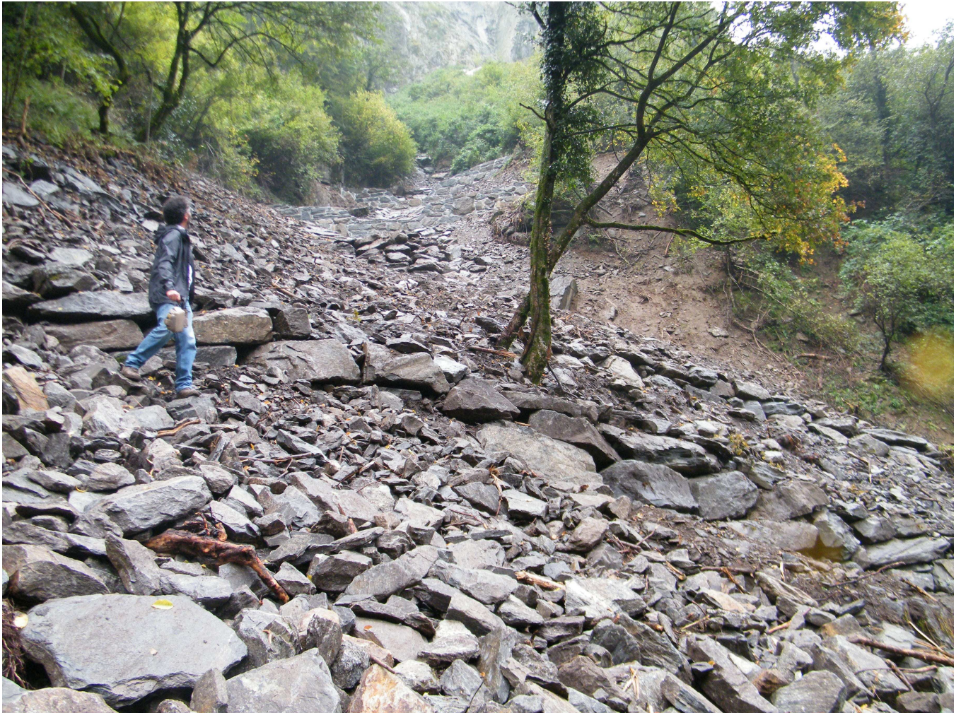
Vista panoramica da valle dalla zona di intervento sommitale dell'alveo