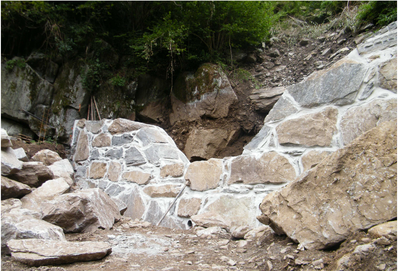
Briglia II – Opera ultimata