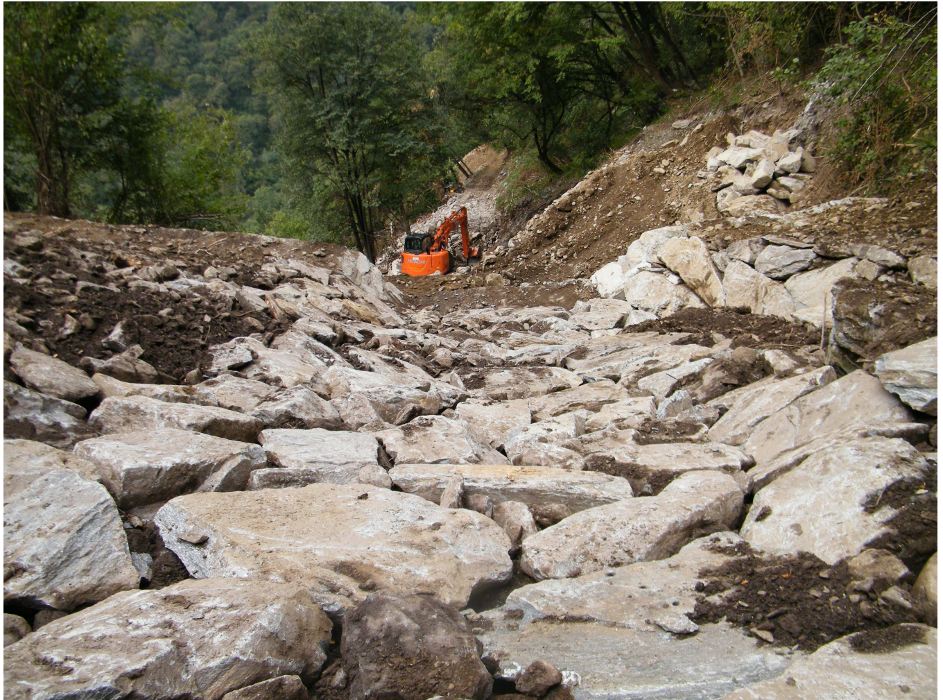
Riprofilatura e adeguamento dell'alveo nella porzione compresa tra Briglia I e Briglia II