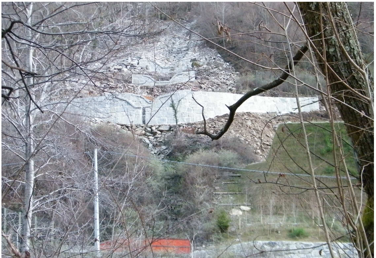
Vista dal versante opposto della briglia n.3 a lavori completati