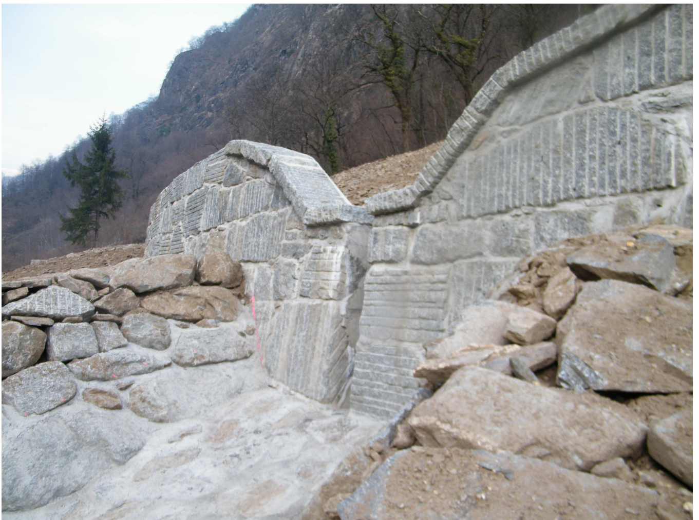
Vista da valle della Briglia n.3 a chiusura della vasca a lavori ultimati.