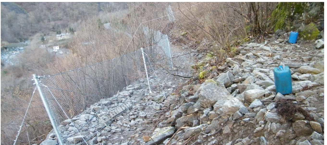
Tratta barriera paramassi provvisoria da 500 kJ