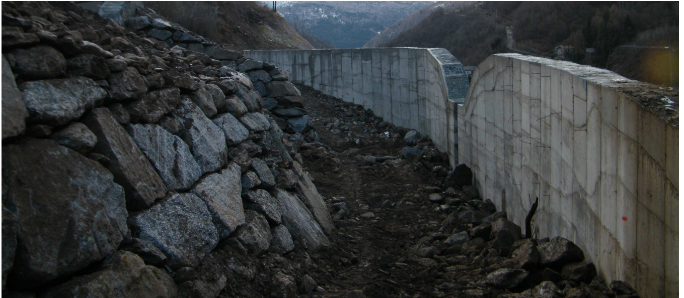
Realizzazione scogliere a monte della briglia n.3