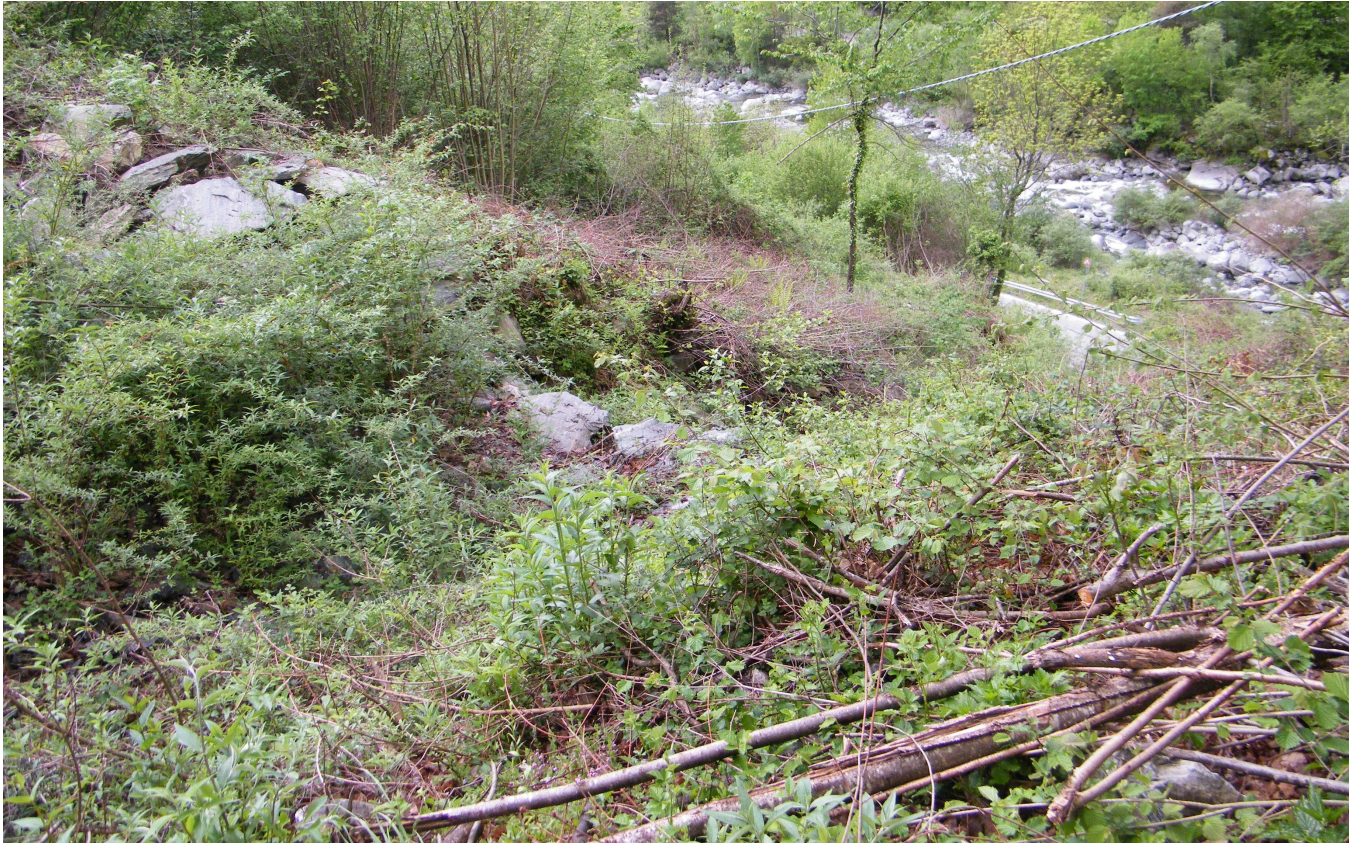
Alveo a valle della vasca nelle condizioni ante-operam