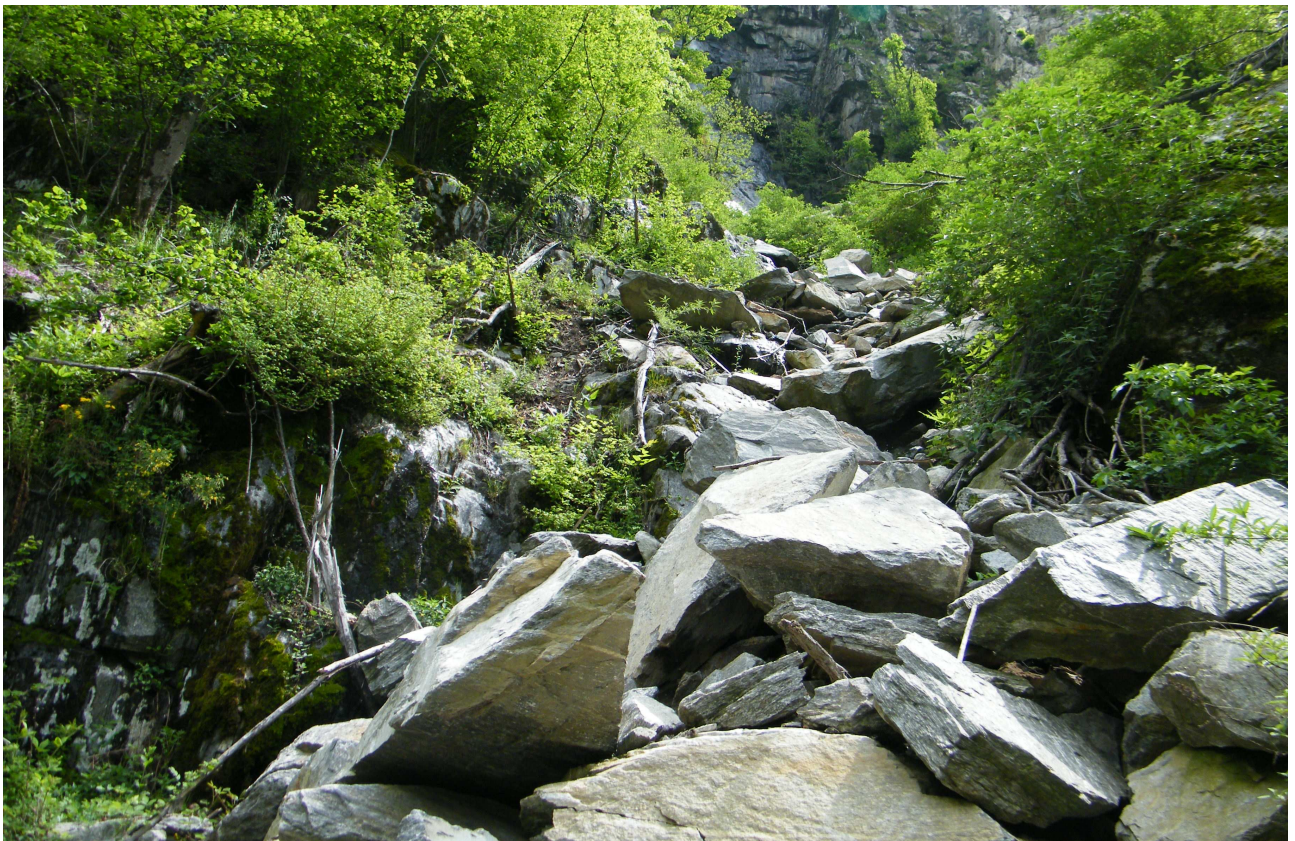
Ripresa fotografica tratto sommitale di alveo "ante-operam"