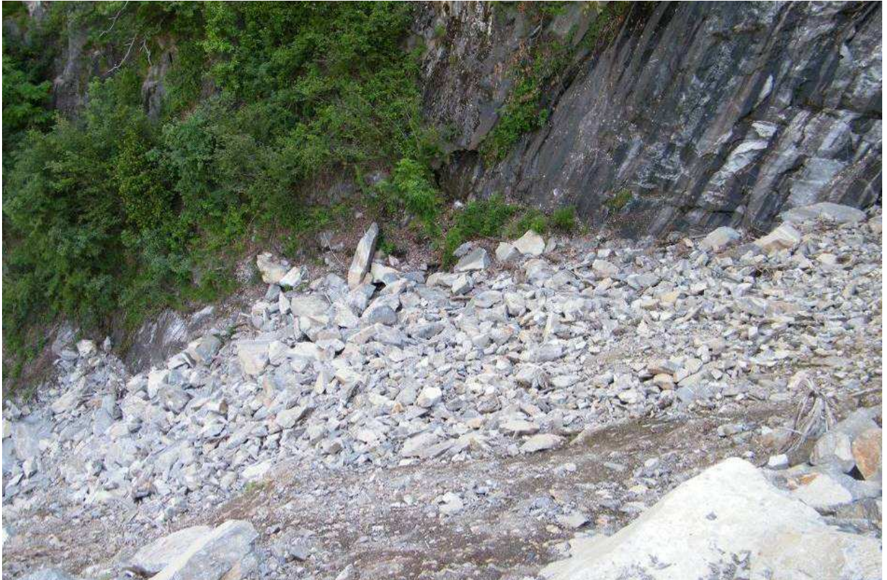
Accumulo materiale detritico nella porzione superiore dell'alveo generato dai crolli in roccia provenienti dalle falesie sovrastanti