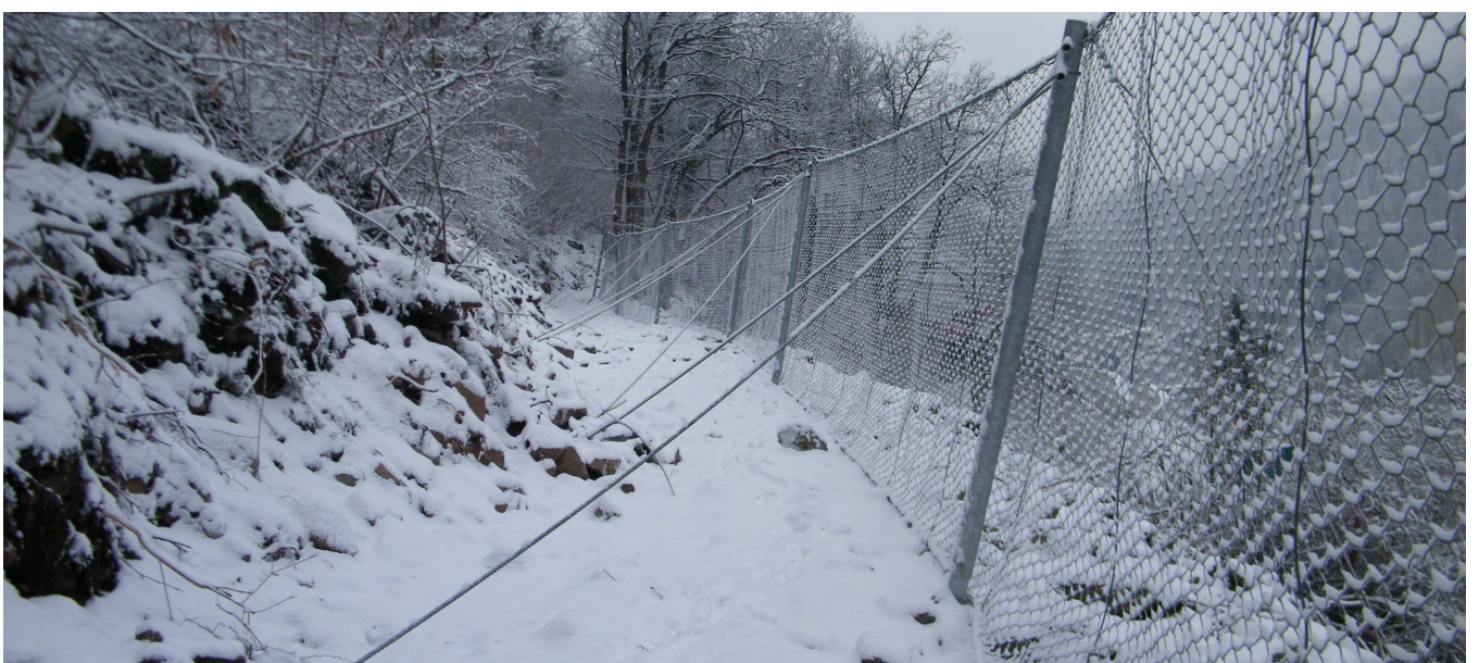
Tratta barriera paramassi provvisoria da 500 kJ