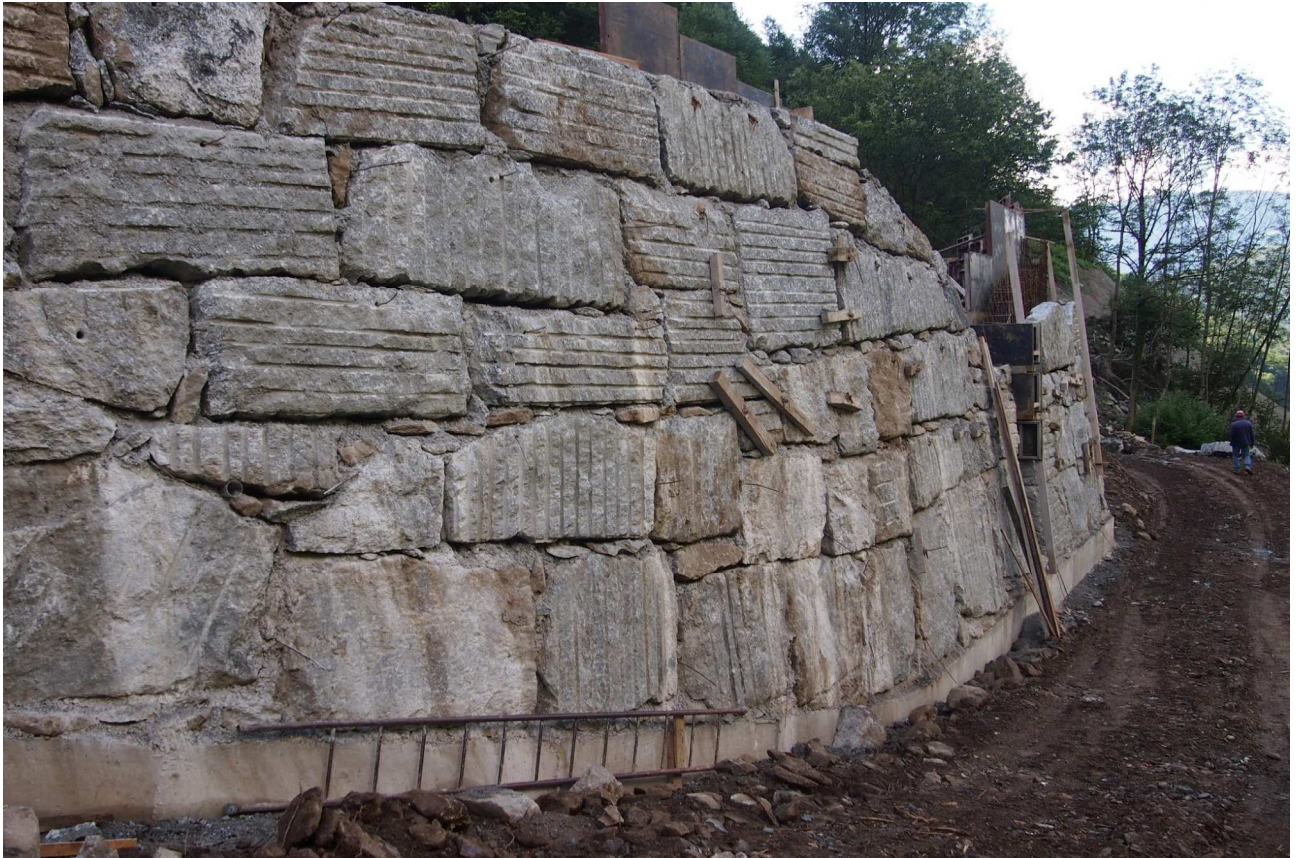
Fase di completamento del muro (lato valle) della briglia n.3