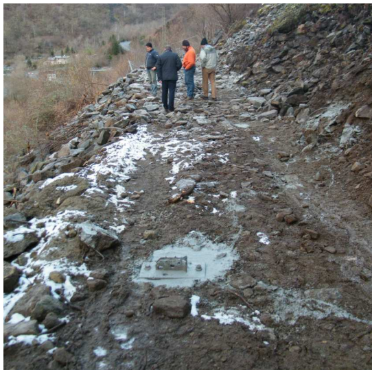
Fasi di realizzazione delle fondazioni delle barriere paramassi