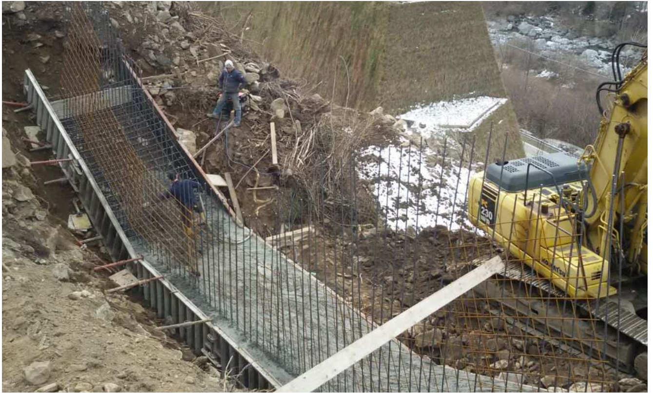
Lavori di realizzazione della Briglia n.2 – getto fondazione