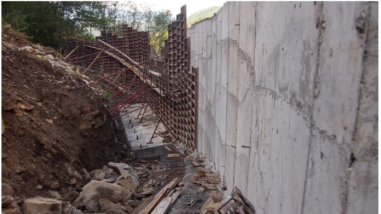
Fase di getto del muro in c.a. della briglia n.3