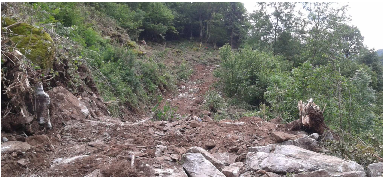
Ripresa primi interventi di scavo e tracciamento strada di servizio lato Nord

Lavori di tracciamento, scavo, riprofilatura versante, realizzazione scogliere e regimazione idraulica