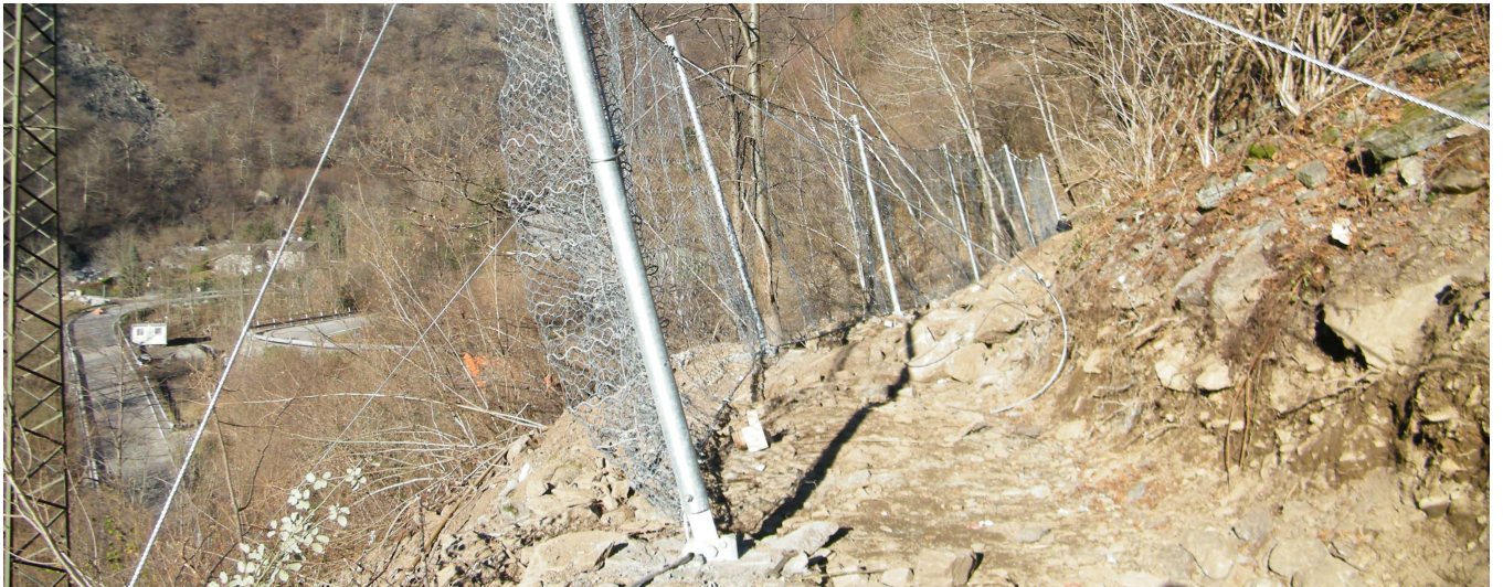
Tratta barriera paramassi provvisoria da 1000 kJ