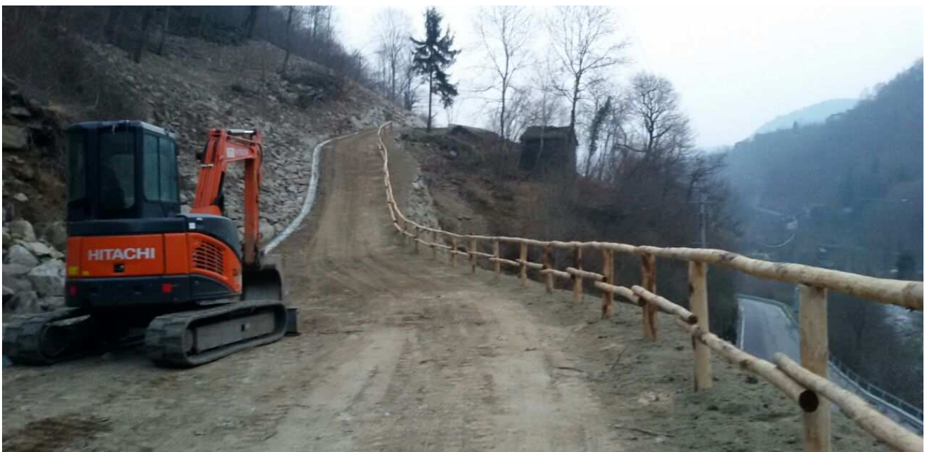
Strada di Servizio Lato Nord a lavori ultimati con le opere accessorie