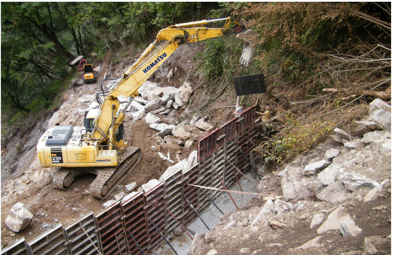
Fasi costruttive della briglia I