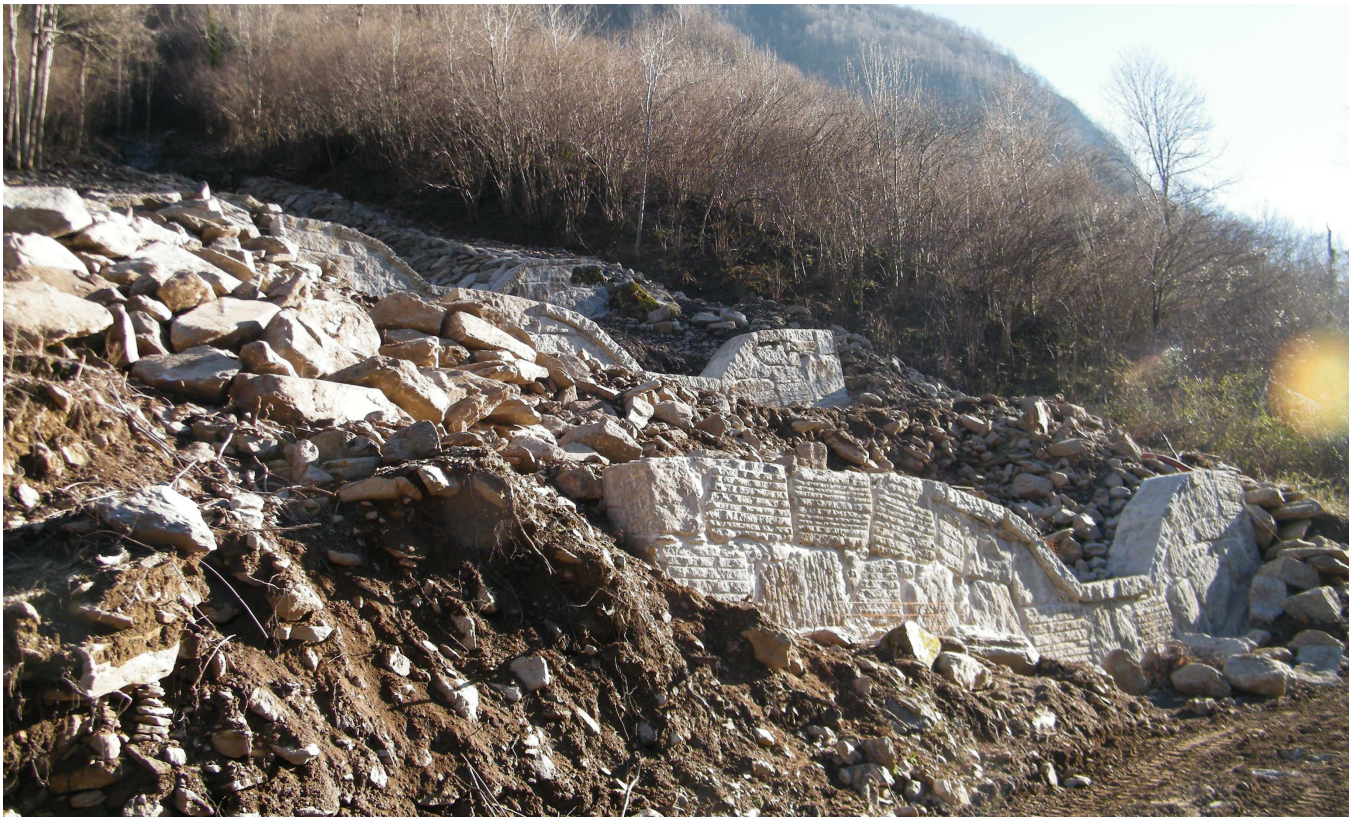
Briglie n. 4, 5 e 6 completate