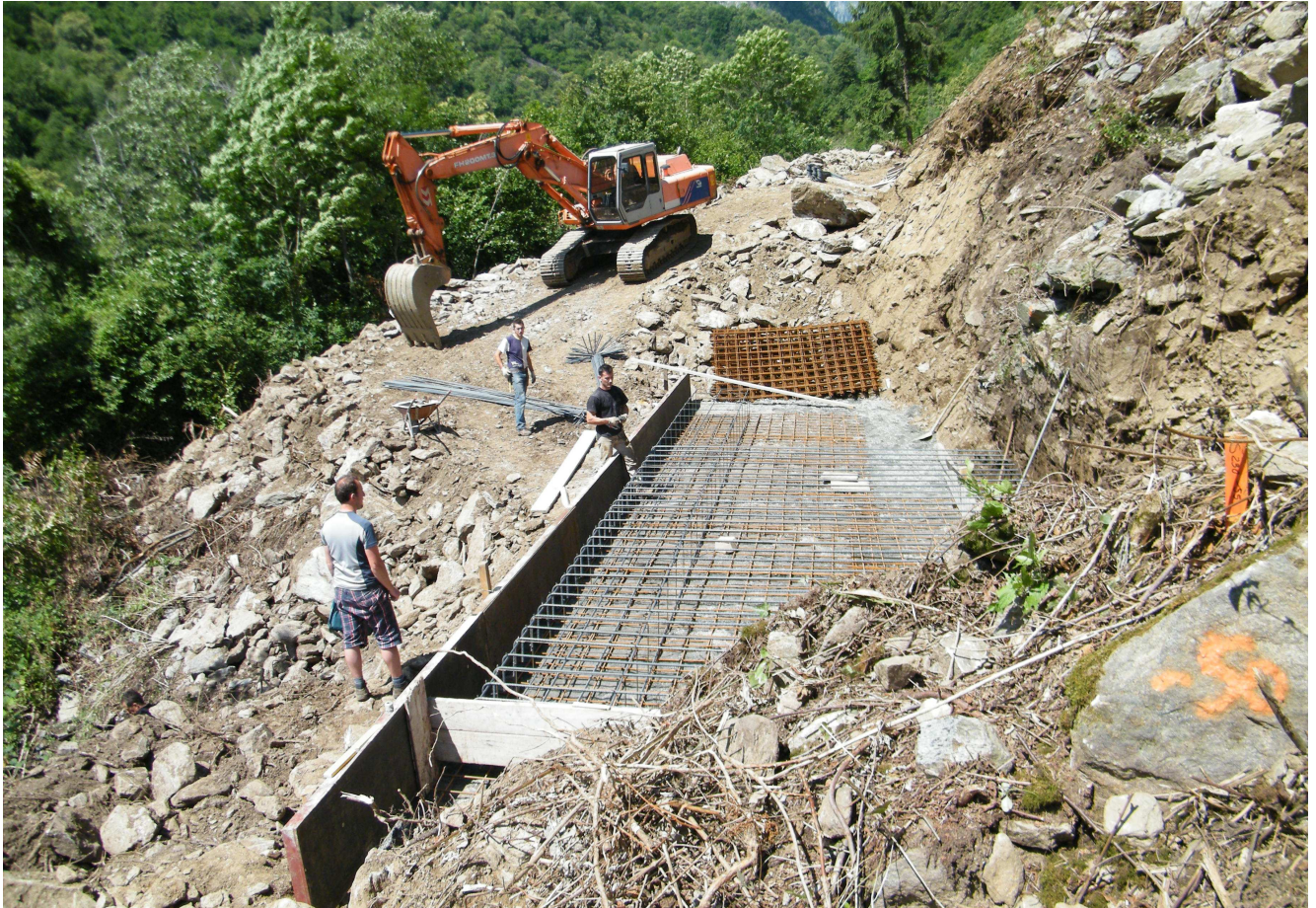
Fase di realizzazione della fondazione della Briglia n.3