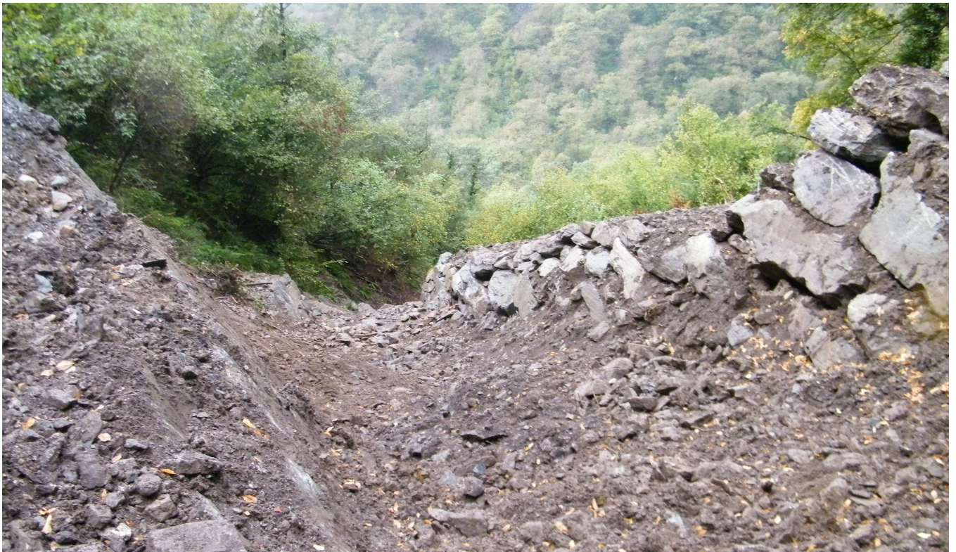
Lavori di adeguamento alveo nel settore a valle delle Briglie I e II