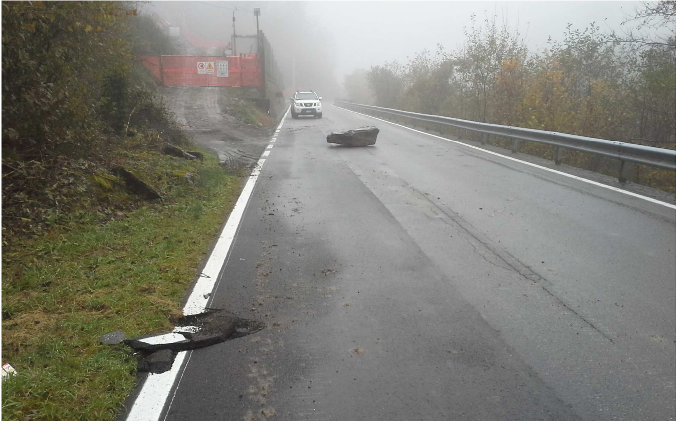
Ripresa del masso che ha raggiunto la strada provinciale