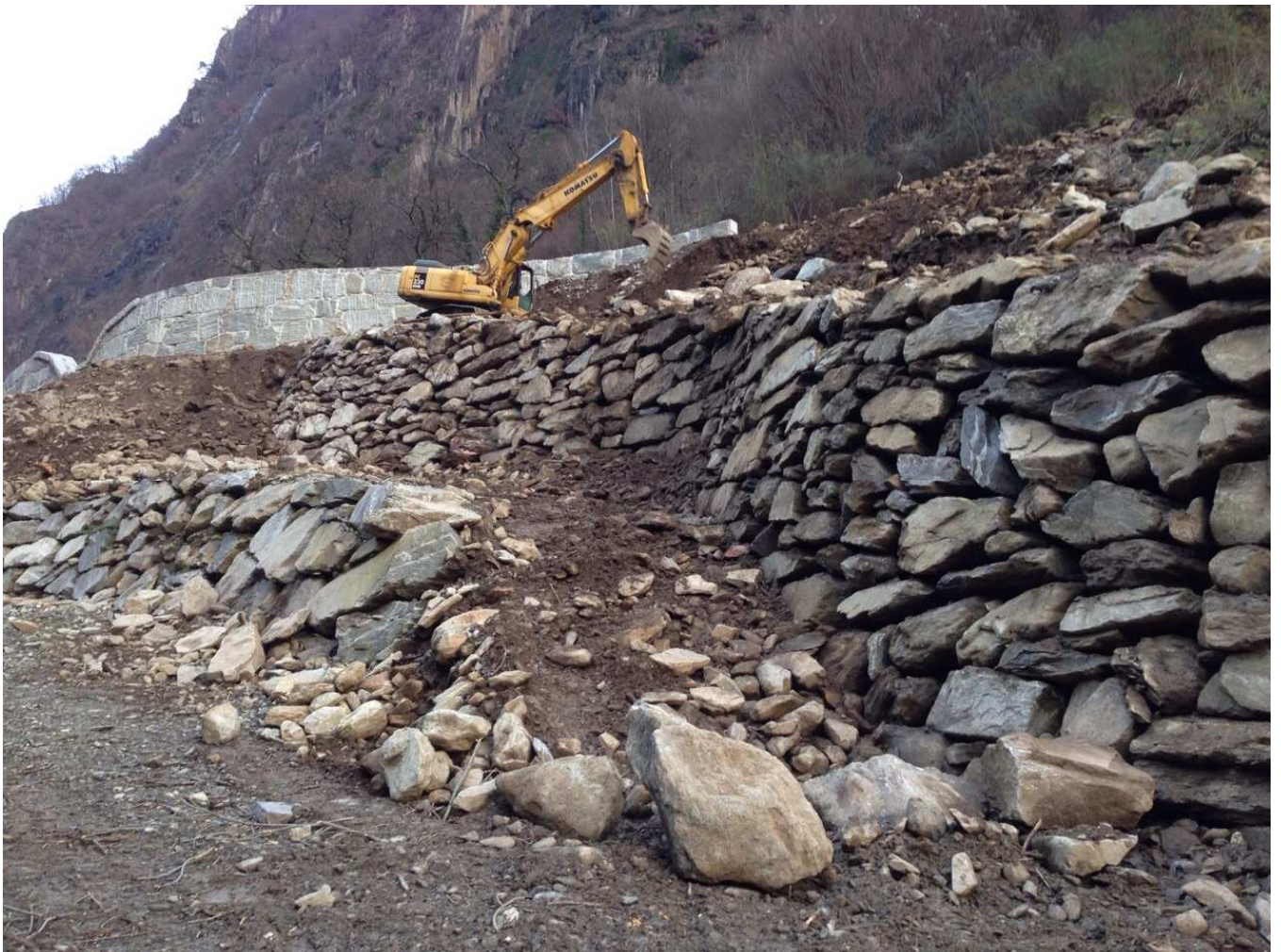
Realizzazione prima rampa della strada di servizio lato sud