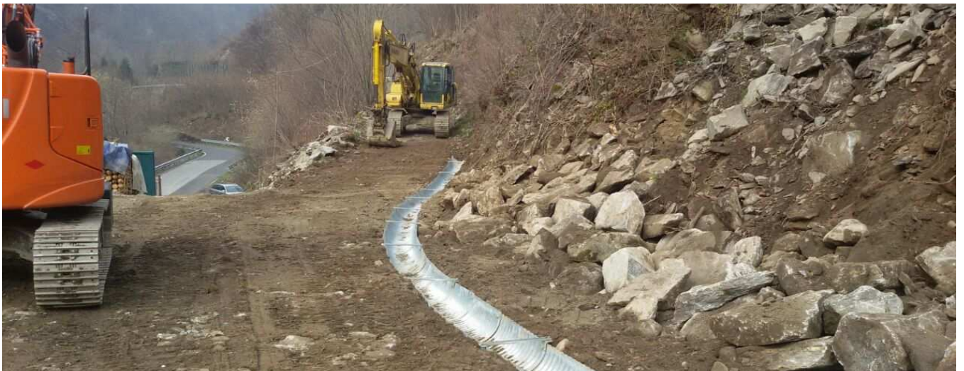
Strada di servizio lato Nord, dettaglio opere di regimazione delle acque