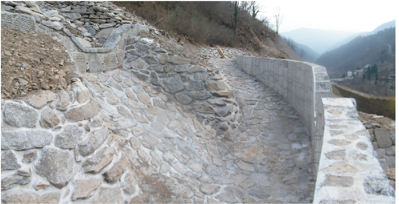
Vasca di accumulo a lavori ultimati