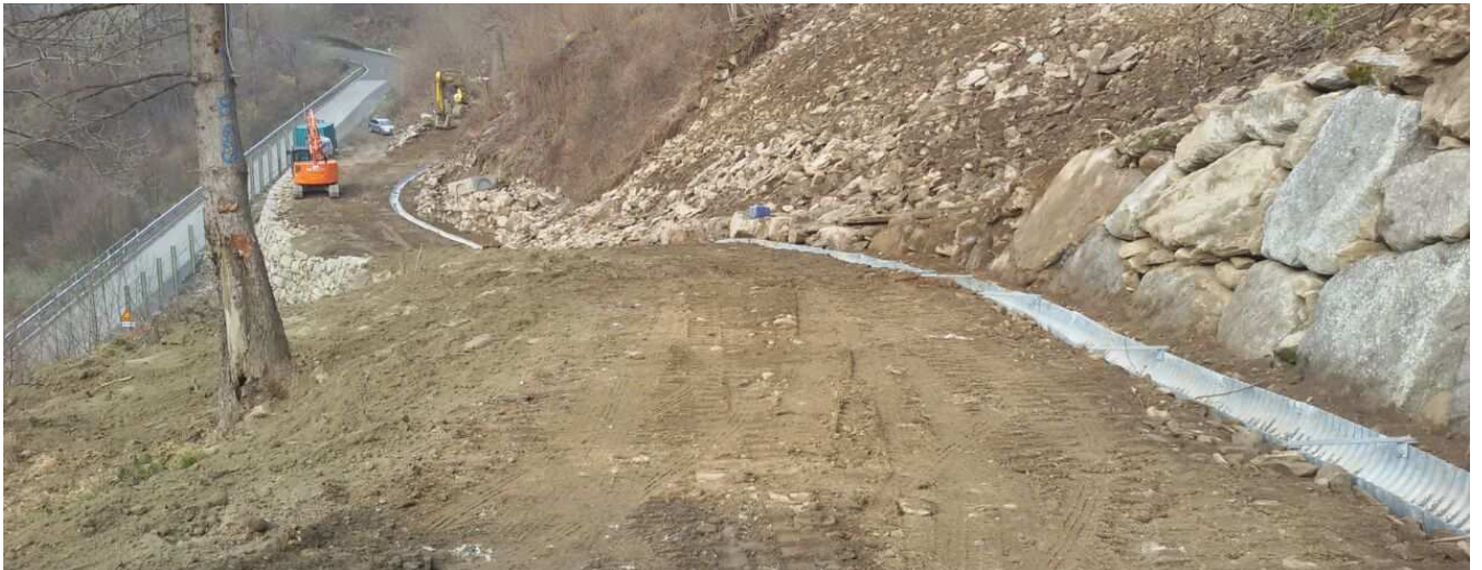
Ripresa fotografica da Sud della strada di servizio lato Nord