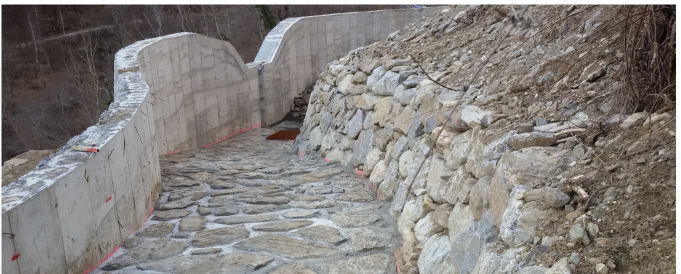
Rampa di accesso alla vasca (lato sud) in fase di completamento