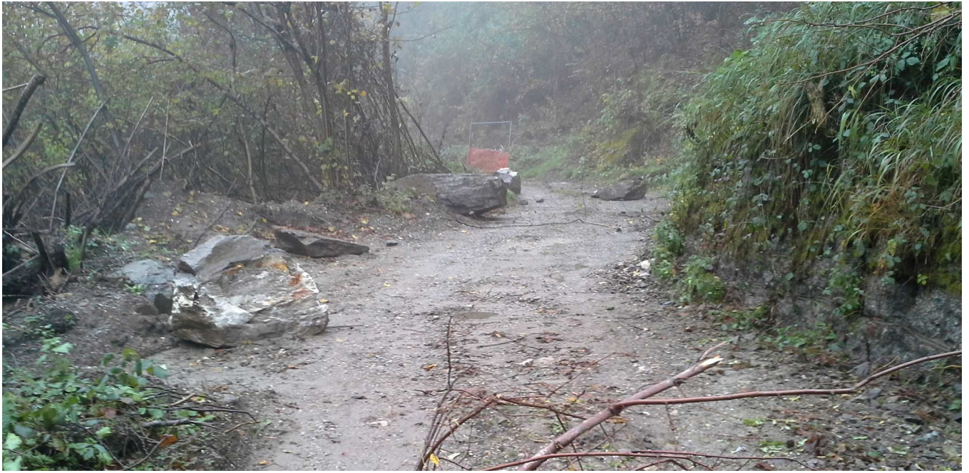
Ripresa dei massi arrestatisi a monte della strada provinciale