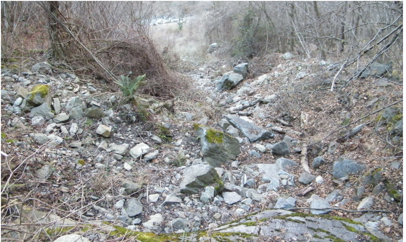
Alveo a monte della vasca di accumulo nella condizione ante-operam