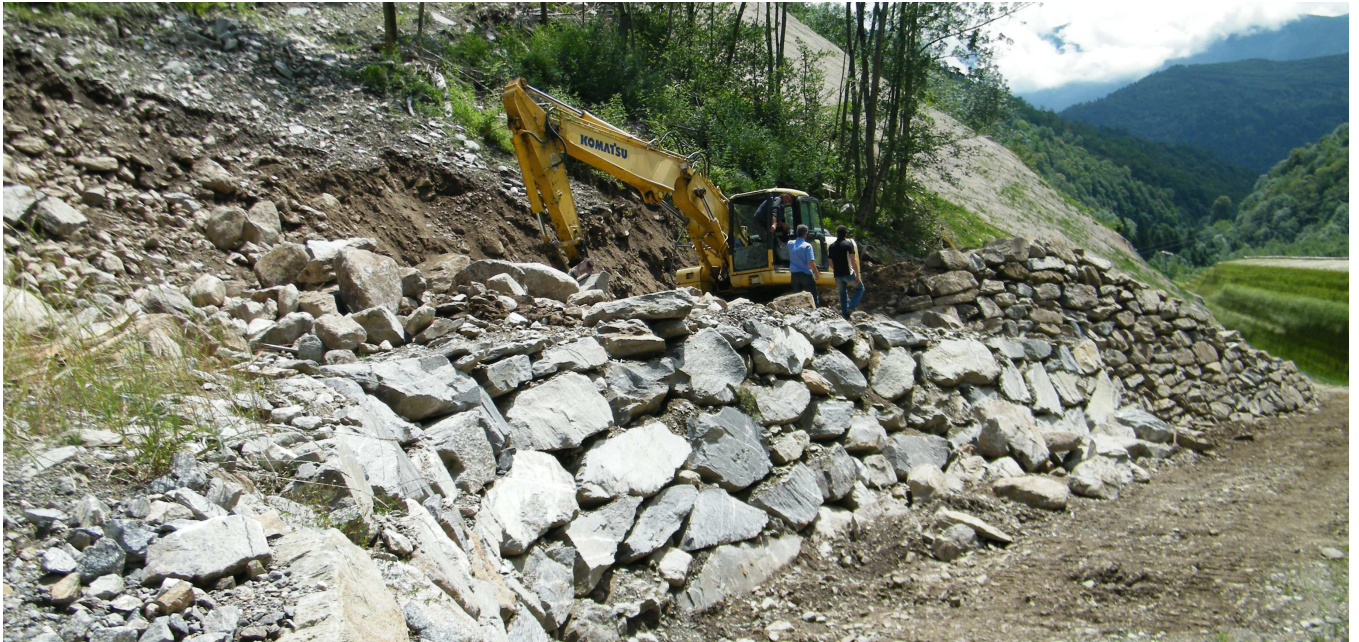
Realizzazione prima rampa della strada di servizio lato sud

Lavori di tracciamento, scavo, riprofilatura versante, realizzazione scogliere e regimazione idraulica