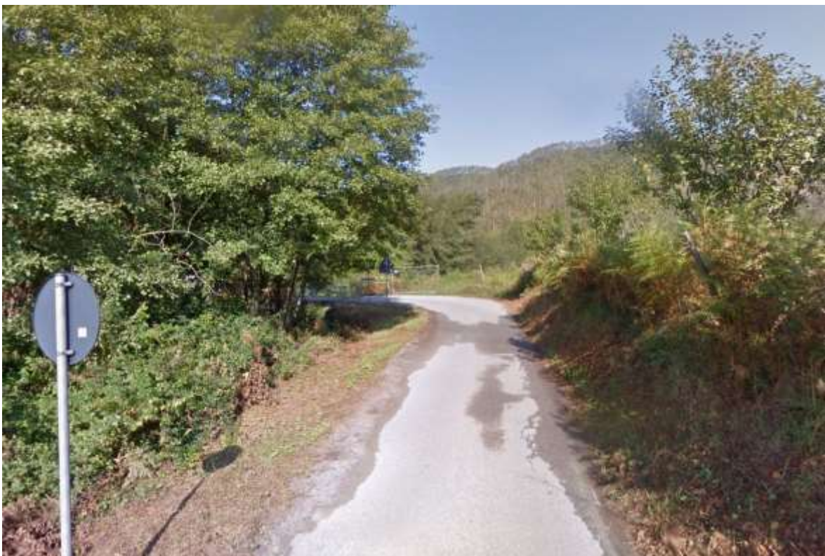
Vista dell'area di intervento in prossimità del ponte crollato (situazione precedente all'alluvione).