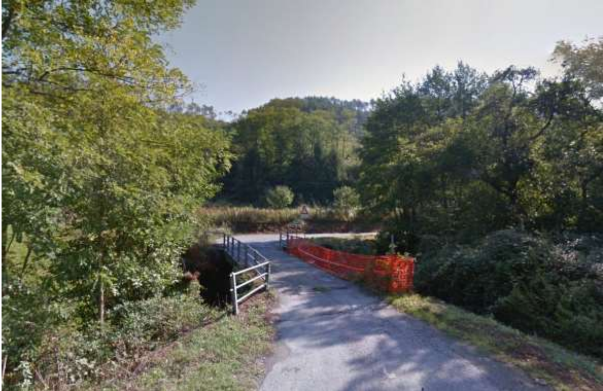
Vista di dettaglio del ponte crollato (situazione precedente all'alluvione).