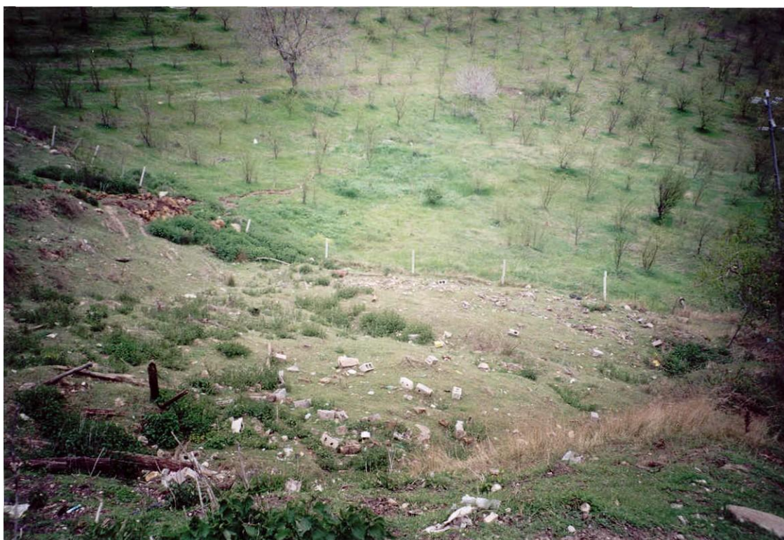
Foto 3. Panoramica vista dall'alto del ripido pendio in frana, prima dell'inizio dei lavori di consolidamento e di sistemazione (maggio 2001).