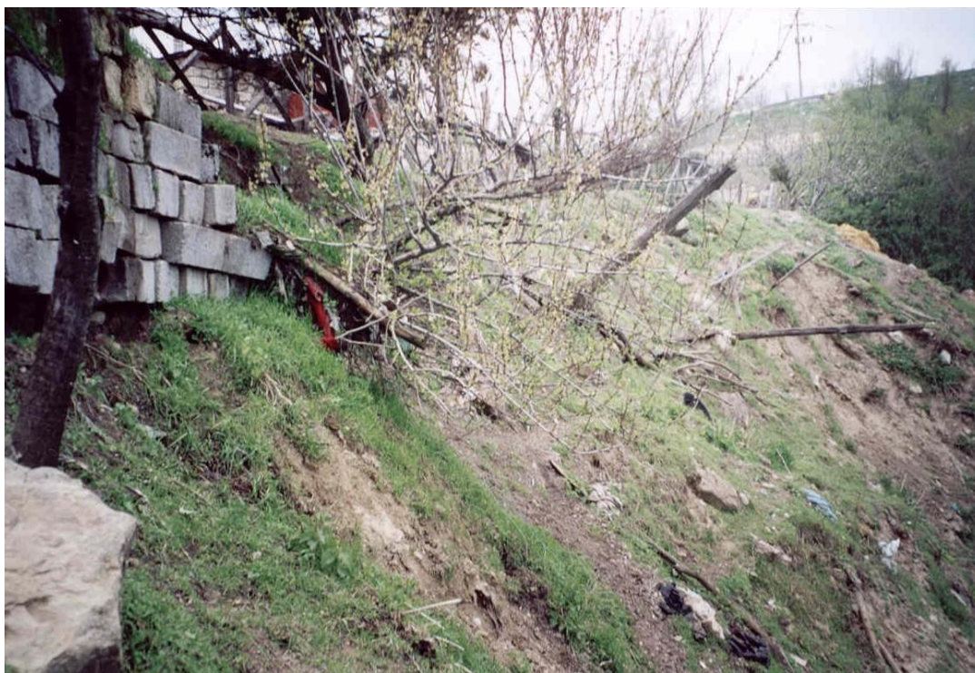
Foto 1. Particolare dell'Orlo della scarpata di frana che lambisce la recinzione esterna del piazzale antistante i fabbricati di Proprietà "Melino", prima dell'inizio dei lavori di consolidamento e di sistemazione (maggio 2001).