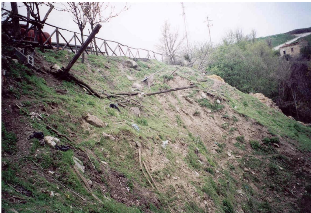
Foto 2. Panoramica della parte alta pendio in frana, prima dell'inizio dei lavori di consolidamento e di sistemazione. Sullo sfondo è visibile la recinzione del piazzale antistante i fabbricati e la strada di accesso Via Casalgrande (maggio 2001).