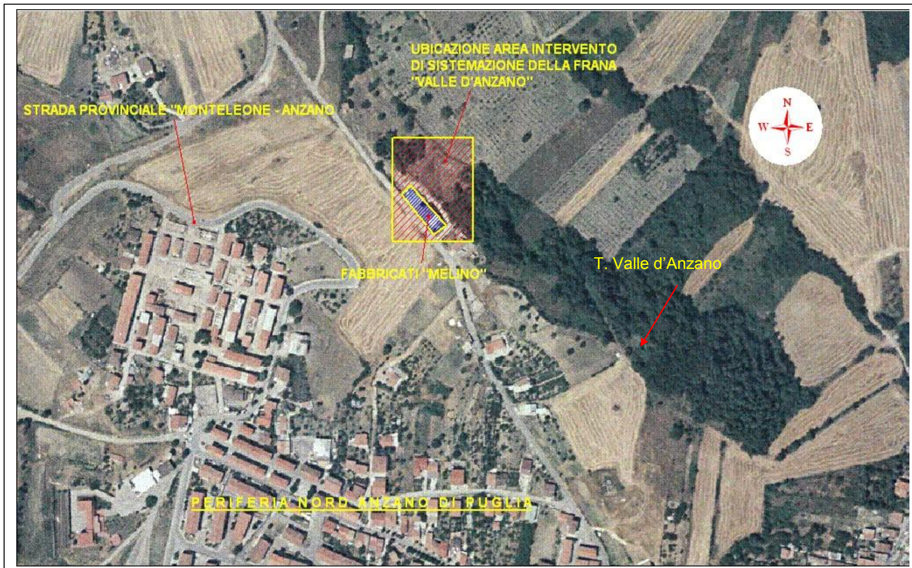
Figura 3. Ubicazione dell'area dell'intervento di consolidamento e di sistemazione dell'area in frana "Valle d'Anzano", nella periferia nord occidentale del centro abitato di Anzano di Puglia (Fg) - (Ortofoto - fonte Terra Italy).