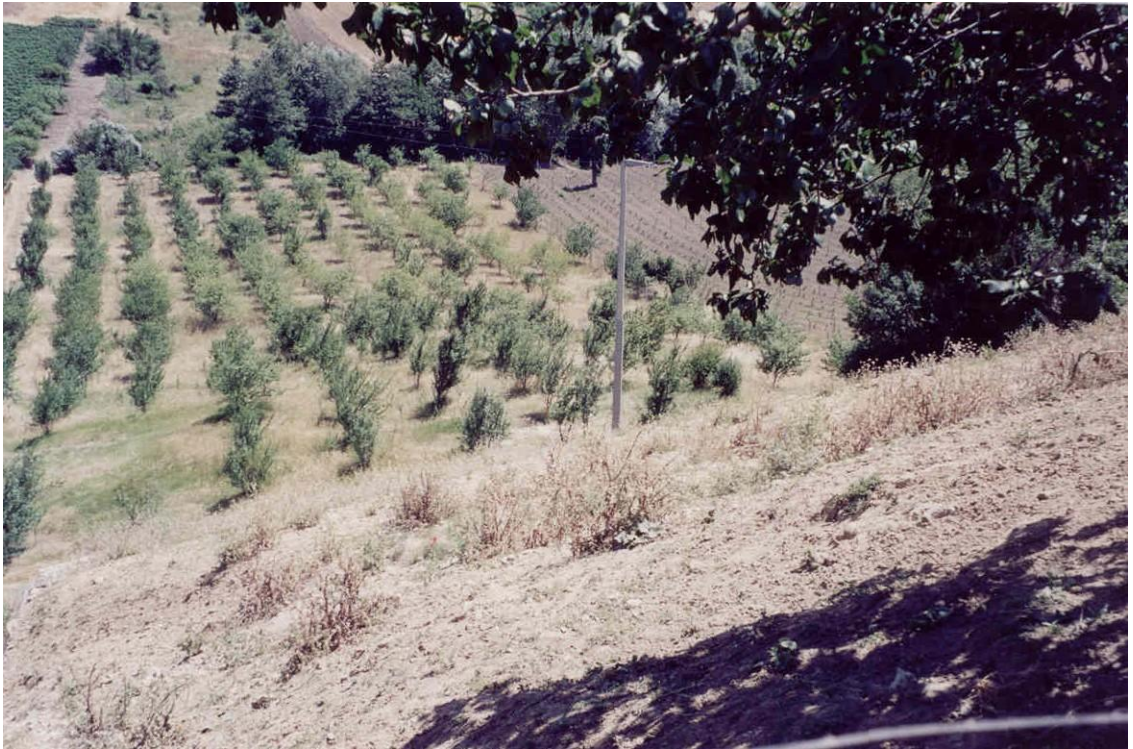
Foto 4. Panoramica vista dall'alto del pendio, a lavori di consolidamento e sistemazione della frana ultimati e collaudati (Foto luglio 2003)