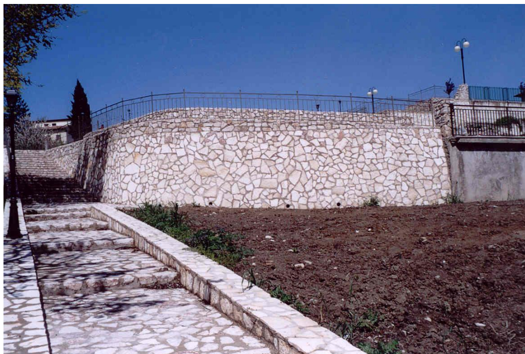
Foto 7. Particolare dei muri di sostegno dei terrazzamenti e delle rampe d’accesso rivestiti con lastre di pietra. (Foto maggio 2004)