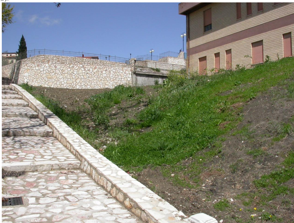
Foto 5. Vista panoramica, dal basso, della zona a valle del fabbricato della Colonia Estiva, a lavori di consolidamento e di risanamento ambientale dell’area in dissesto ultimati (Foto maggio 2004)