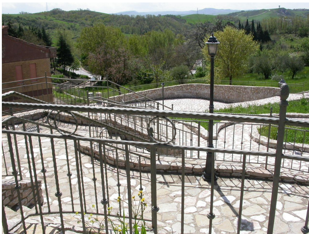
Foto 5. Vista panoramica, dall’alto, della zona a monte del fabbricato della Colonia Estiva a lavori ultimati. L’area, che prima dell’intervento versava in stato di abbandono e degrado, è stata sistemata con terrazzamenti sostenuti da muri in c.a., collegati tra loro da rampe e percorsi pedonali. I muri e la pavimentazione degli spiazzi e delle rampe sono stati rivestiti con lastre di pietra (Foto maggio 2004).