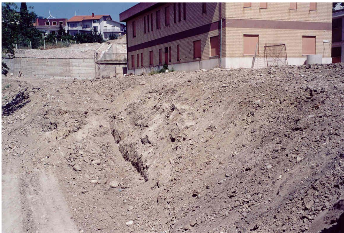
Foto 4. Lavori in corso di riprofilatura con gradonatura e terrazzamenti, sostenuti da muri in c.a. dell’area circostante il fabbricato della Colonia Estiva occupata da materiali di riporto (Foto aprile 2002).