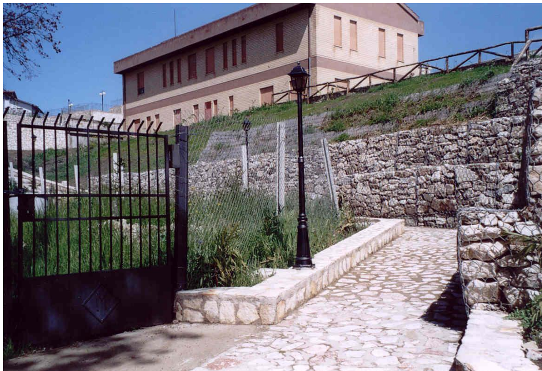
Foto 8. Vista panoramica della zona a valle del fabbricato della Colonia Estiva, a lavori ultimati. Il Pendio è stato consolidato mediante una struttura di sostegno costituita da gabbionate e terre rinforzate rinverdite (Foto maggio 2004)