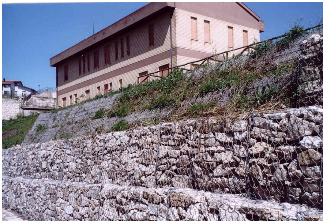
Foto 10. Particolare della gabbionata di sostegno e delle terre rinforzate inverdite, realizzate per il consolidamento dell'area a valle della Colonia Estiva (Foto maggio 2004)