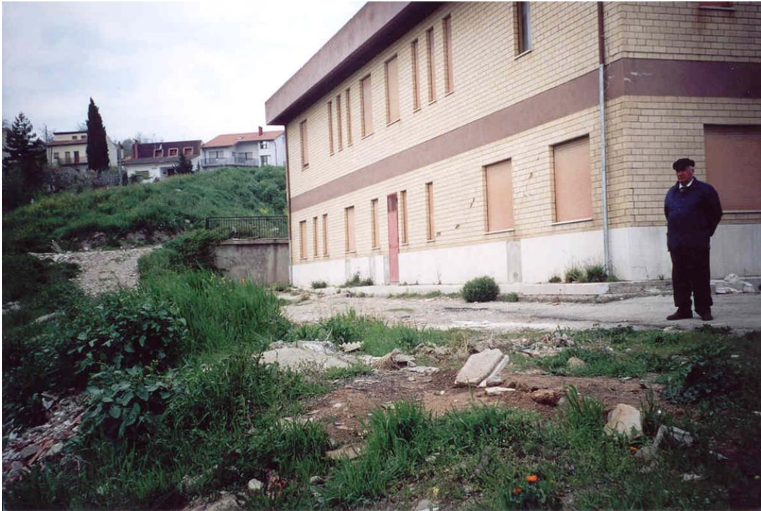
Foto 1. Panoramica dell'area in dissesto della Colonia Estiva in stato di abbandono, prima dell'inizio dei lavori di consolidamento e di sistemazione (maggio 2001).