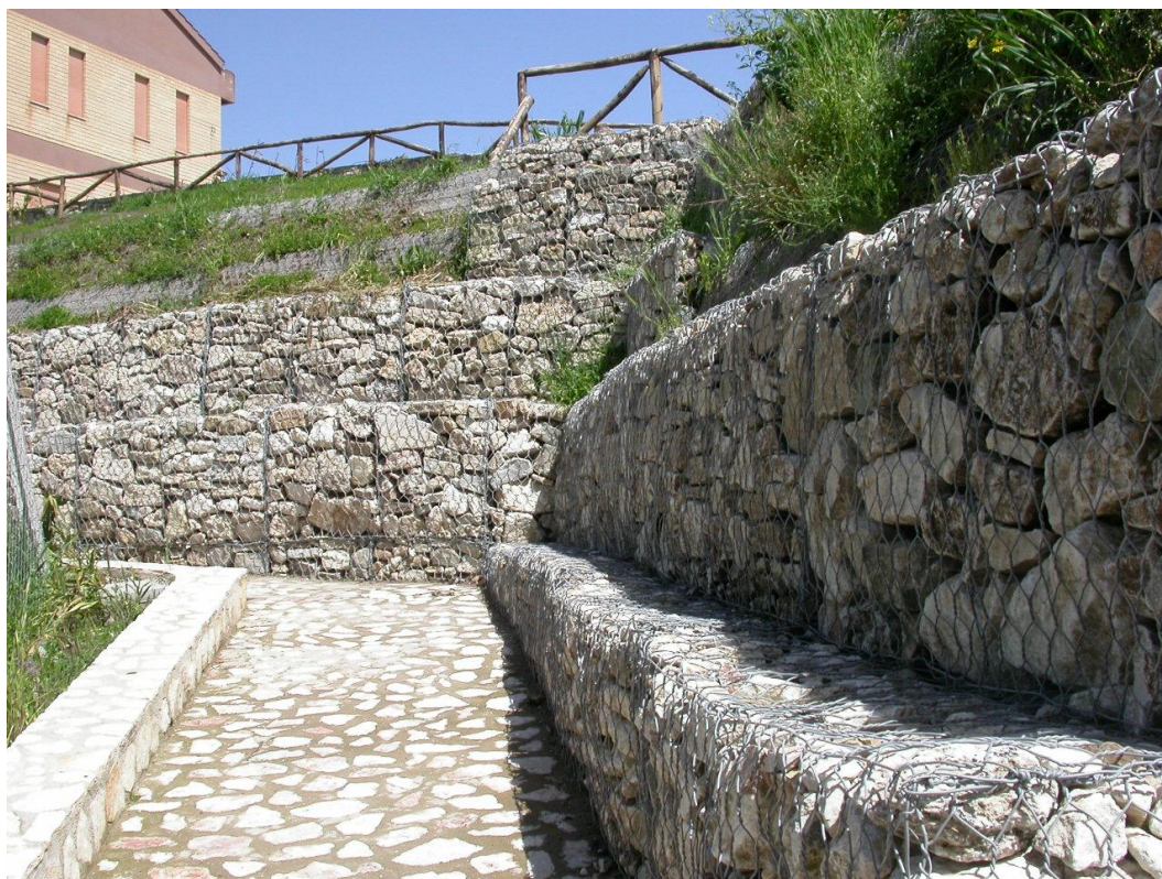
Foto 9. Particolare dell'intervento di consolidamento del pendio a valle del fabbricato della Casa Colonica, con la rampa d'accesso all'area sistemata (Foto maggio 2004)