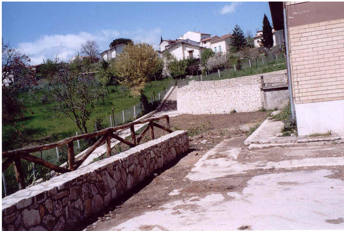
Foto 3. Intervento di consolidamento del fabbricato dissestato della Colonia Estiva. Esso è stato realizzato mediante un diaframma di contenimento ubicato in corrispondenza del lato e dello spigolo sul lato valle dell'edificio, costituito da pali accostati collegati in testa da trave in c.a. (Foto maggio 2004).

Foto 2. Particolare dei dissesti statici e dei cedimenti differenziali delle fondazioni che interessano il fabbricato della Colonia Estiva nei versanti del vallone San Giuseppe, nella periferia meridionale del centro urbano di Anzano di Puglia (FG).